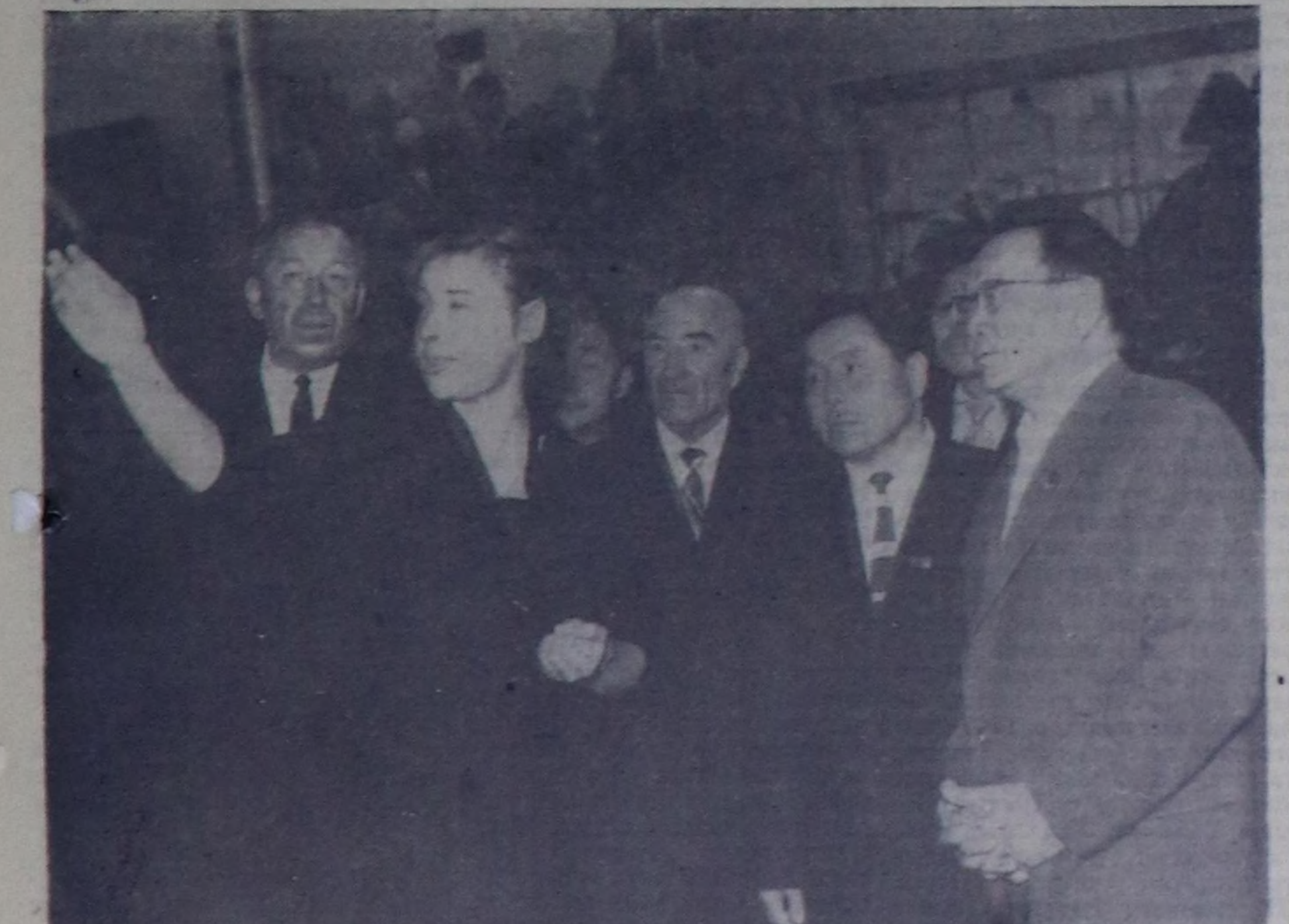
МОСКВА. СЭКП-нин XXII съездинин Тыва АССР-ден делегаттары 1961 чылдын Бүгү-эвилел уран чурулга делегаттын көрүп туралар. Фото В. Матюковтуу. (СЭТА-нын фотехроникасы).

Эштер! Республиканын ажалчы чоннары бүгү совет улус-биле кады, СЭКП-нин XXII съездинин төөгүтү шитпирлерин амыдыралга ботандырышаан, партиянын чаа Программанын айтканын төөгүтү орулгаларын чедипкинин күөсүдөр болгаш бистин чүркя коммунизмин тургузарынын ниети херезинге төлөтат салымшыкынын килер дөш боттарынын бүгү күштерин, чогаалчык бүгү энергиянын килеринге белин. (Ур адыш часнаашкыны).