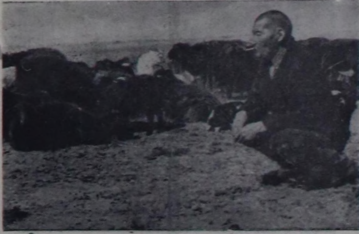
Чурунта: Сарыглор Сотна

«Барлык» совхозтун Аксы-Бардык салбырына чораш чагып орган бис. Ол хун биче хаттыр турган. Ыччала-даа Алды-Булак суурун чок кавымында тарыга шедерде тракторлар динирип, хону ажыл дайымын кынып чоруу турган.