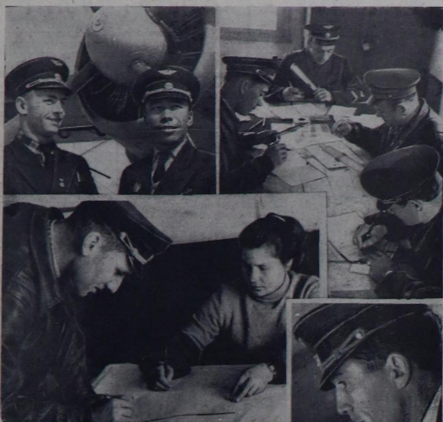
Уланчысы. Эгеи ийги арында