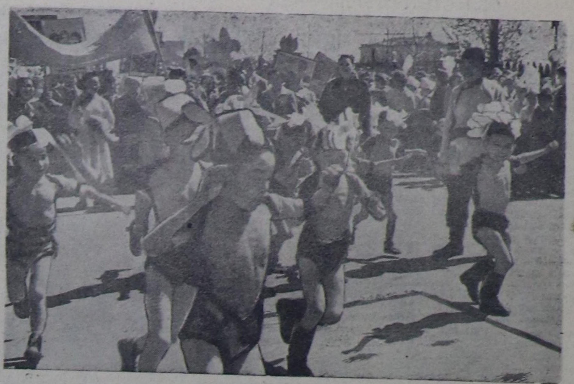
Чурукта: анык эзирлер девин үнүлкен.

Нью-Йорк, Чикаго, Детройт, Сан-Франциско, Лос-Анжелос, Вашингтон хоорайларга чораш совет журналистер каа-да барганда боттарынын америк журналистер өпнүктөрүн кичээткен-биле хурааткен турганар. Олар чүге журналистер-биле эвес, харны АКШ-тын хөй-ниити болгаш хураан ажылдакчылары-биле база садыг-үлөтүр эдери кижилер-биле ужурашкан болгаш беседалашканыр.