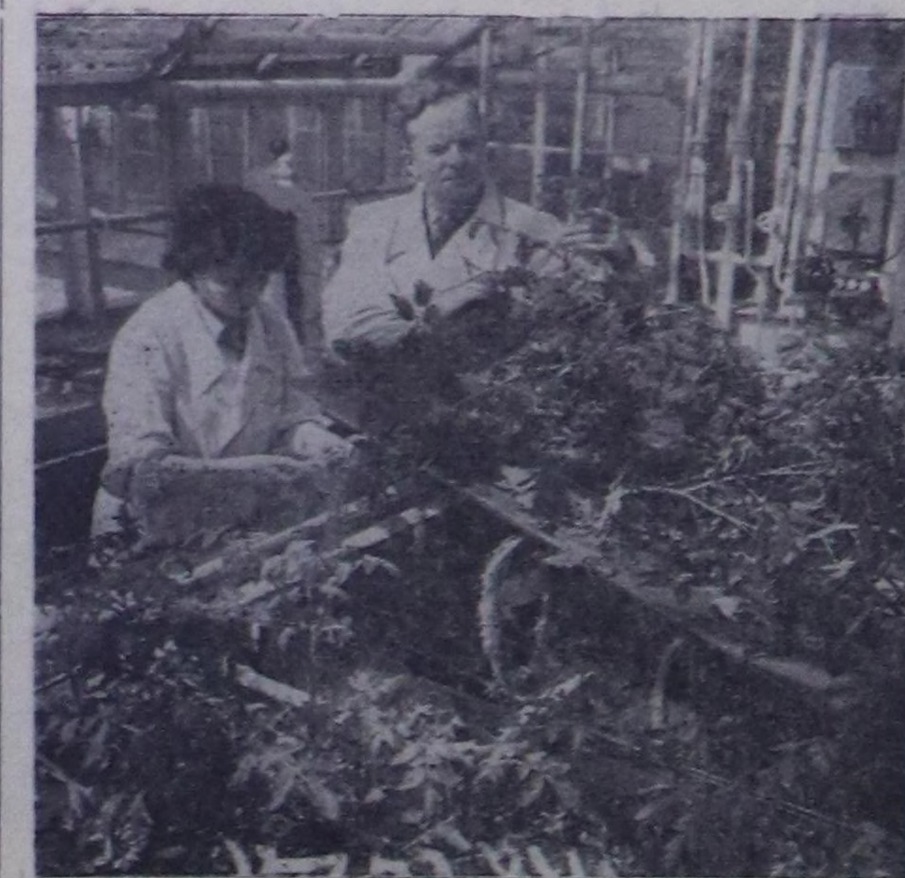
МОСКВА, ССРЭ-нин Эртемер академиясынын физиология институтунун лабораториясында доурак-хөрүн чок, чүгүле сүгүлдү оторду тургузган. Огородтук дөрбөлүн метр бурзу-ле ааза отордотан үш катпай хей-30-30 килограмма отуретерия берген.