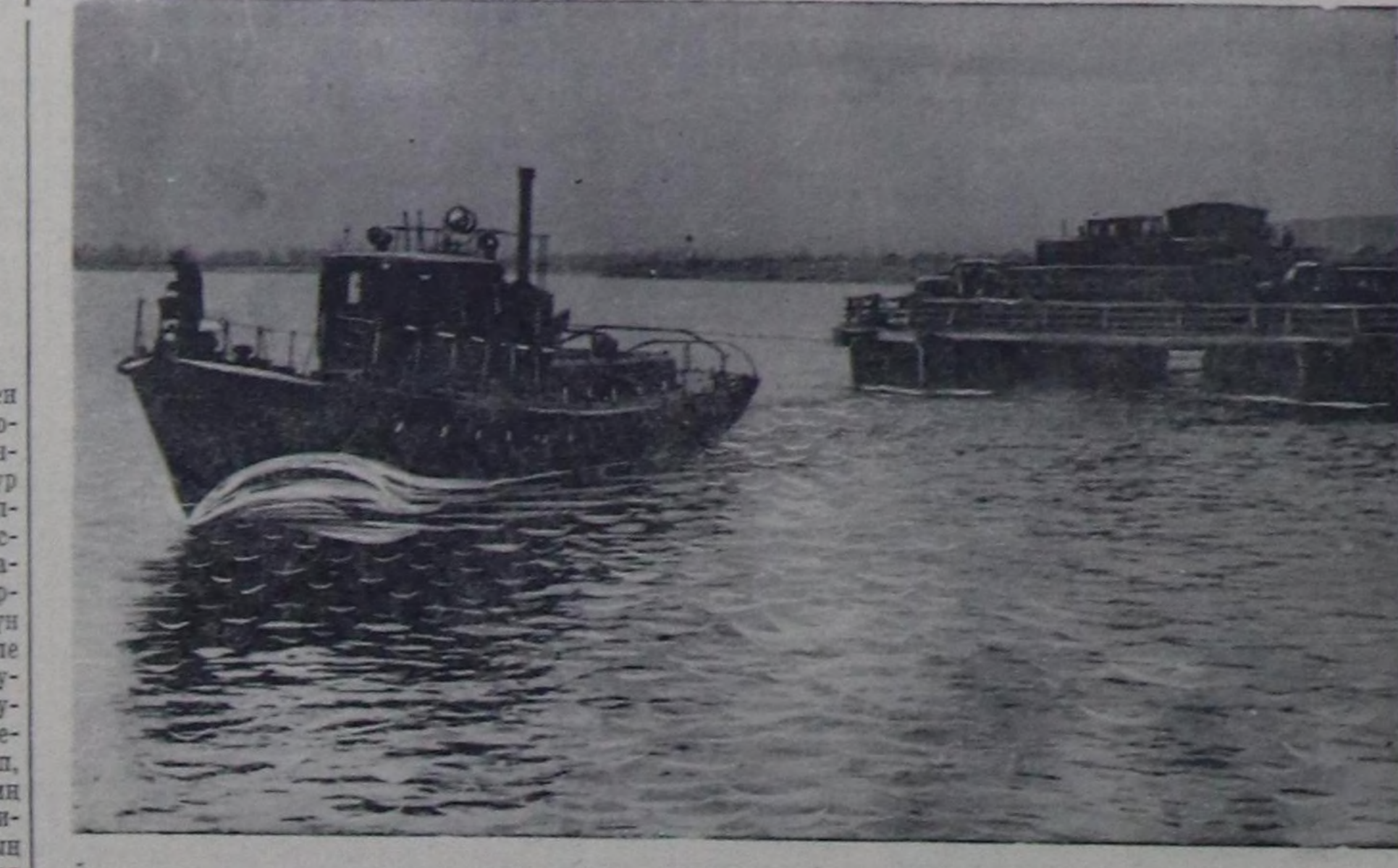
Улут-Хемни келип бар чорутуру.

Норвегияны болгаш Данияны чоңурун хөй куруузу барымы талакы куруелерин атомун дайынга белеткелени оларын чурттары киршилеп негеп турары Ослога болгаш конференция болгаш Копенгагенге болгаш хурал көргүзүп турар. Бичаарган, атом окулт «Поларис» деп ракеталар-биле чекселген суг азынган суг азынган беш хемелерин НАТО-ну коомалдыгына бээр дугайында ме-дел о ийи чурттарыны чоңуна кайы хере айымдыг дээрин билери бөрө эвес суг ала-биле чорутуп ол хемелерин чамдыкы Норвегияга болгаш Данияда тургустунган шериг-ла-лай базаларына көрдүгүн дээрин мындай билдинтир, чүге дээрге «Поларис» деп ракеталар «ортумак ыркышылдыг» болгаш «азынымы» чыгыр чоңуна тургузар кылдыр таарымчалыг боор турар. Норвегияны мугулдулары болгаш Данияны Балтыл дайында поортары «Поларис» деп ракеталарыг суг азынган америк хемелерине эи-не эптиг черлер болуп деп, НАТО-ну коомалдыгынын санап турары шагдан-на тура