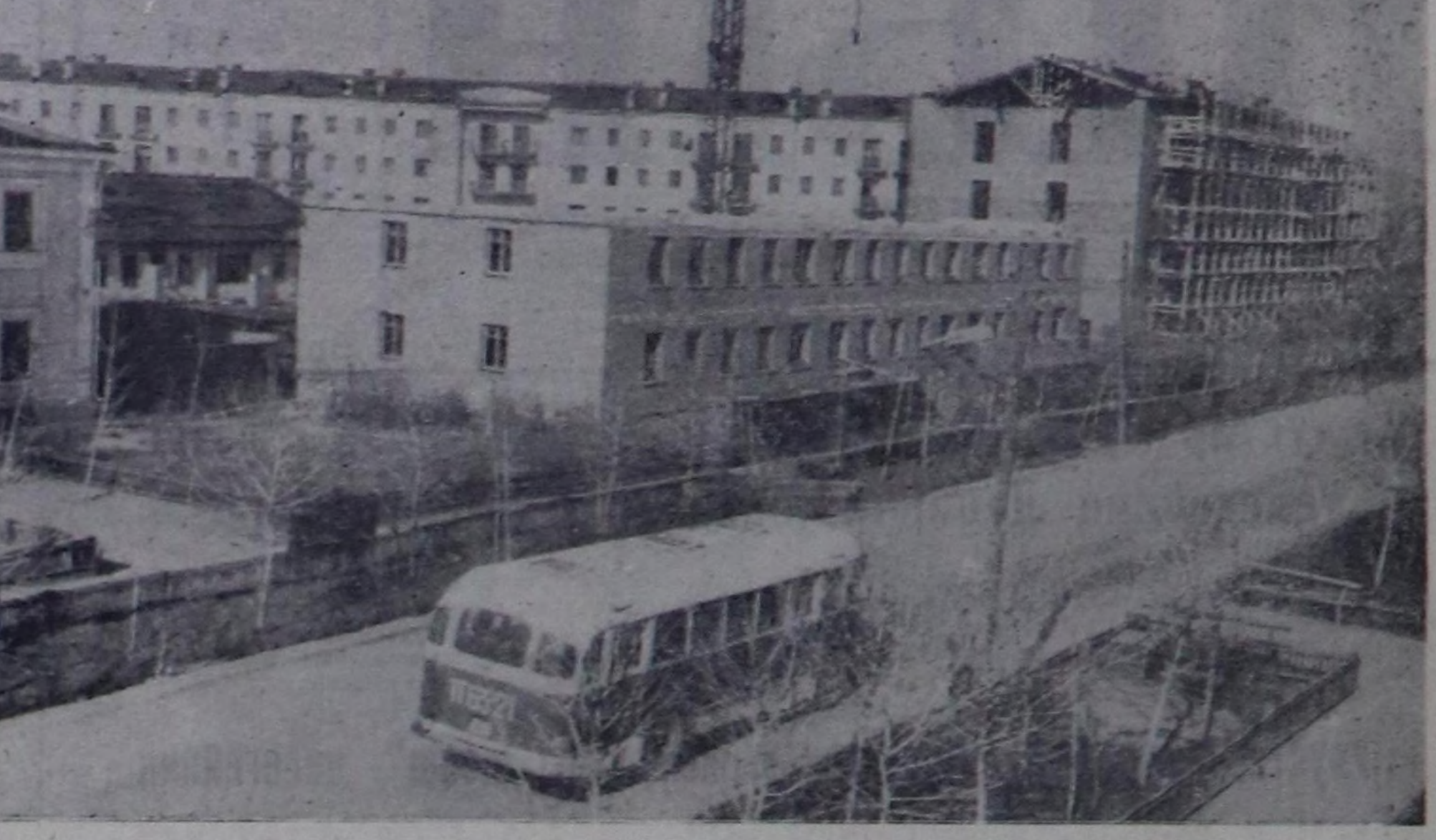
БИСТИН КЫЗЫЛЫВЫС БӨГҮН.