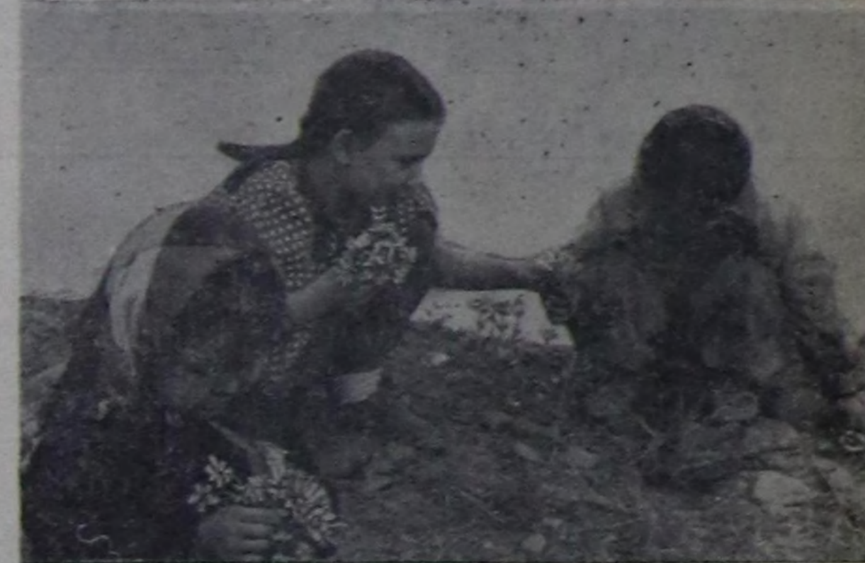
Чөмөктөөн уруглар.