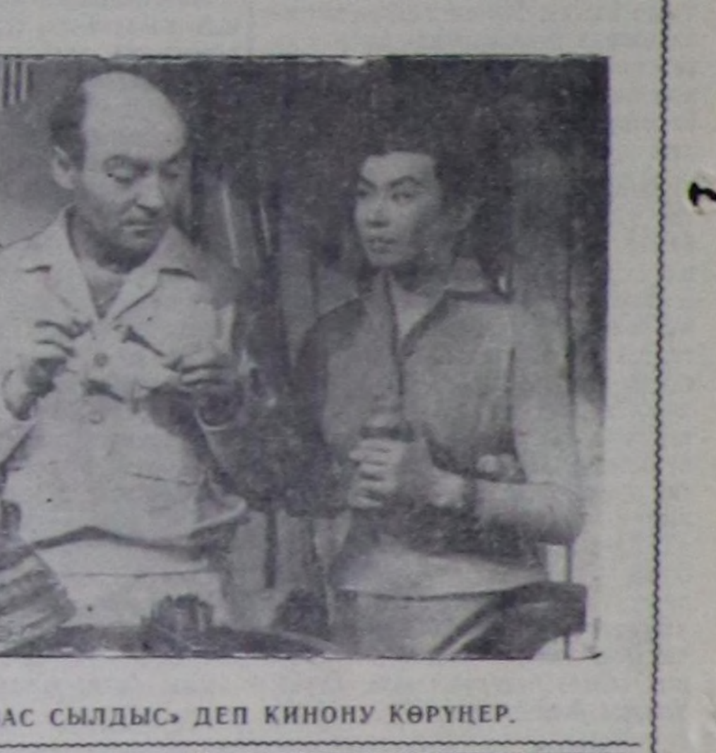
«ЫТТАВАС СЫЛДЫС» ДЕП КИНОҢУ КӨРҮҢЕР.