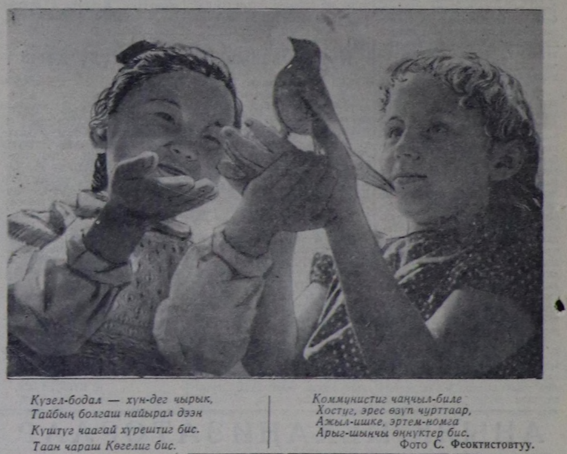
Кузел-бодал — хун-дег чырык, Тайбың болгаш найырал дээш, Куштуг чаагай хүрештиг бис. Таан чараш Көгелиг бис.

Тываның ажылчы чоннары бугу совет улус-биле кады СЭКП-ниң XX болгаш XXI съездилеринин төөгүдүг шиптирлерин амыдыралга боттандырар дээш демисежип турар. Чеди чылдың планын хуусаа бетинде кууседир дээш, партияның XXII съездинде чедишкениниң ужурлары дээш социалисттик чарыш, чуртун өске черлериндеги ышкыш, областа калбарып турар. Бистин партиявыстың Төп Комитети, Совет чазак бистин улугузувус улам-на байдал, аас-кежиктиг эки чурттазын дээш бүгү-ле чүвени кылып турар. Бистин национал оругавыстың барык дөртүн үш кезин киреин улустун материалдык болгаш культуруут дегерелдерин хандырыныга барып турар. Бүгү ажылчын, албан-ааскычлары 7 болгаш 6 шактыг ажыл хунуңче шимчедери доозулган. 1960 чылдан агадээш чондан үндүрүг тырттарын 5 чыл иштинде чөөртү чок кылдыр.