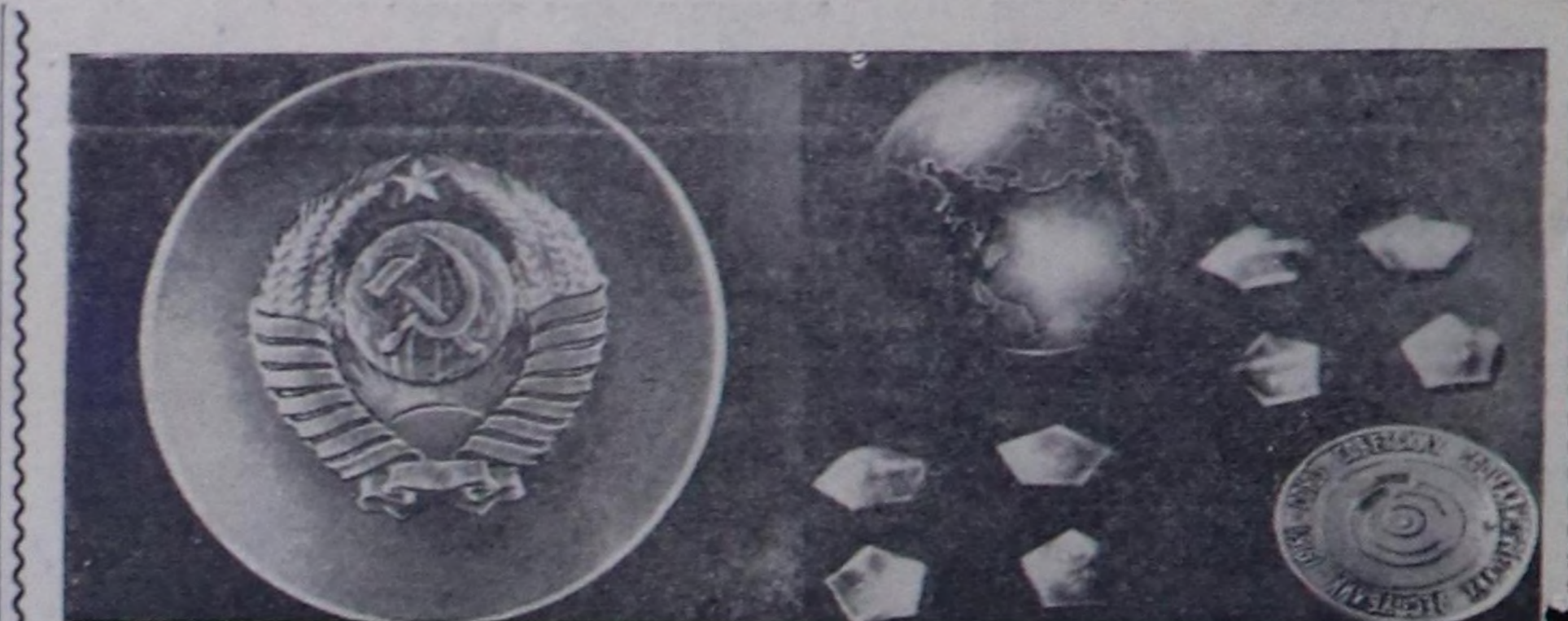
1961 чылдын февраль 12-ле Совет Эвилелинге планеталар аразына ужутар автомат башкарылгалыг станцияны Венера салдыс-сөс салып үндүрерин бир-ле дугаарында боттандырган.

Ам бо хүнерде аныяк чолаачы машина-биле ыраккы малчынарынын кемшталарына сиген, дус даш өсө-лаа чүтүлдериң чедиңип турар. Оон-биле ол чеди чыл планын күтүсидерге бодунуң үлүгү кирибишпаан, өскелерге тускай өртемни шамчылып турар. Бо чызын онгу классты доосар Куулар Бодур-оолду машинаны башкарып, оон нарын