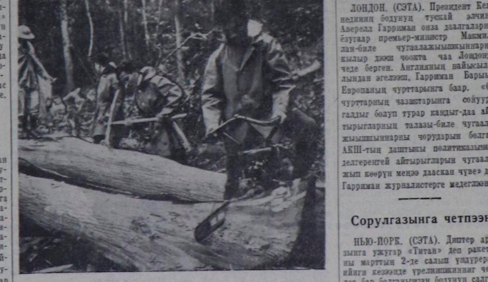
Вьетнам демократтыг республика. Нго-Дойда ыяш белеткээр черлерде.