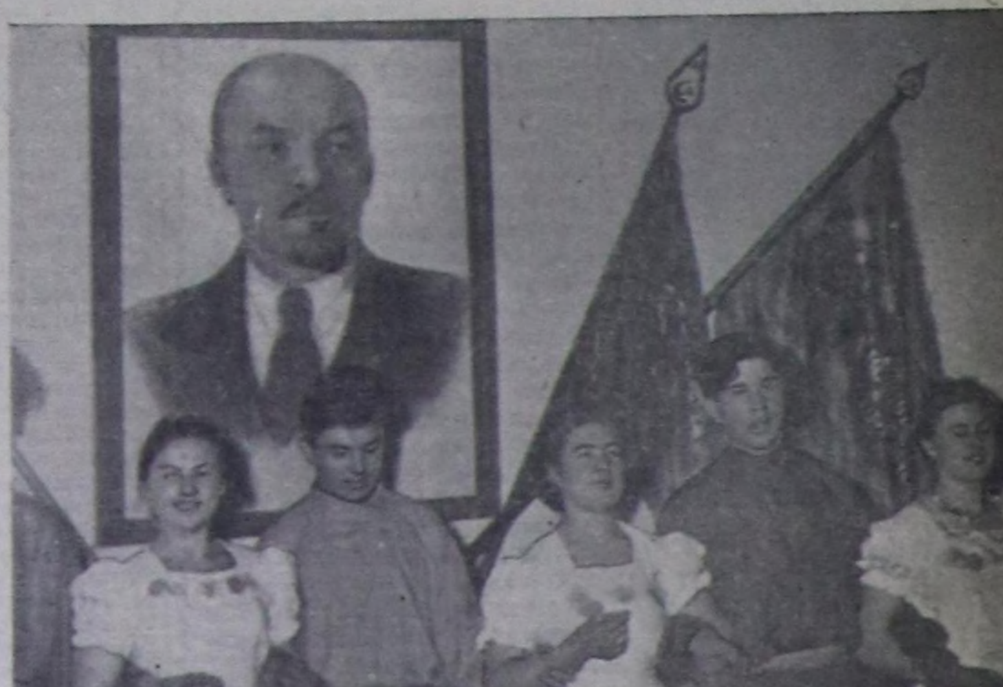
Пассажирлер АТЭ-ынын бот-тымыңдыр уран чүүл болгунуң киржикчилерин сонгузда участогуна концерт көргүзү турар.