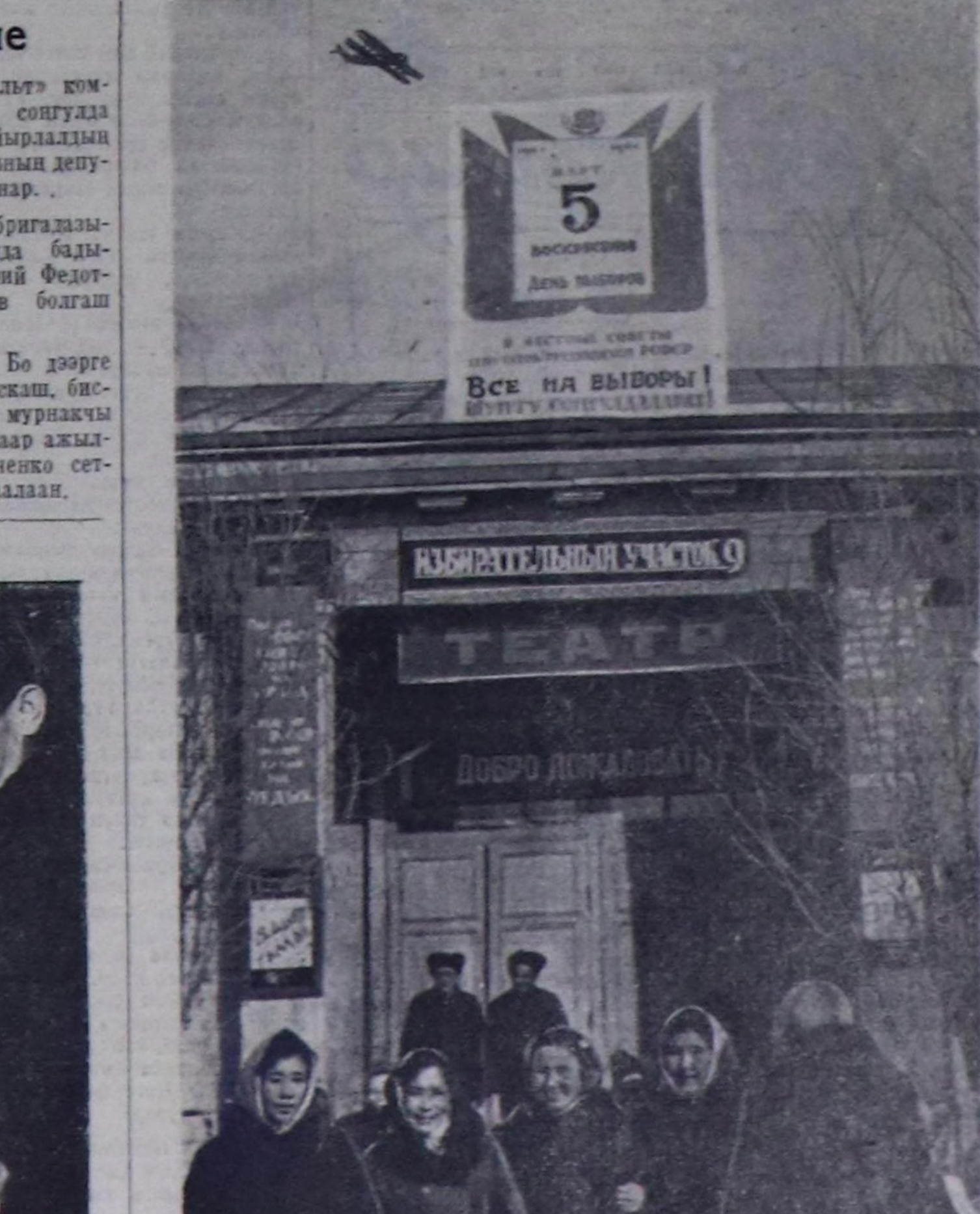
Кызыл хоорайнын №9 сонгузда участогу. Пассажирлер АТЭ-ынын бот-тымыңдыр уран чүүл болгунуң киржикчилерин сонгузда участогуна концерт көргүзү турар.