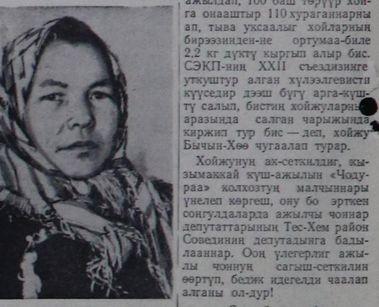
— 1961 чыда улам-на эки Сөзү болгаш фотозу О. Мандарыны.