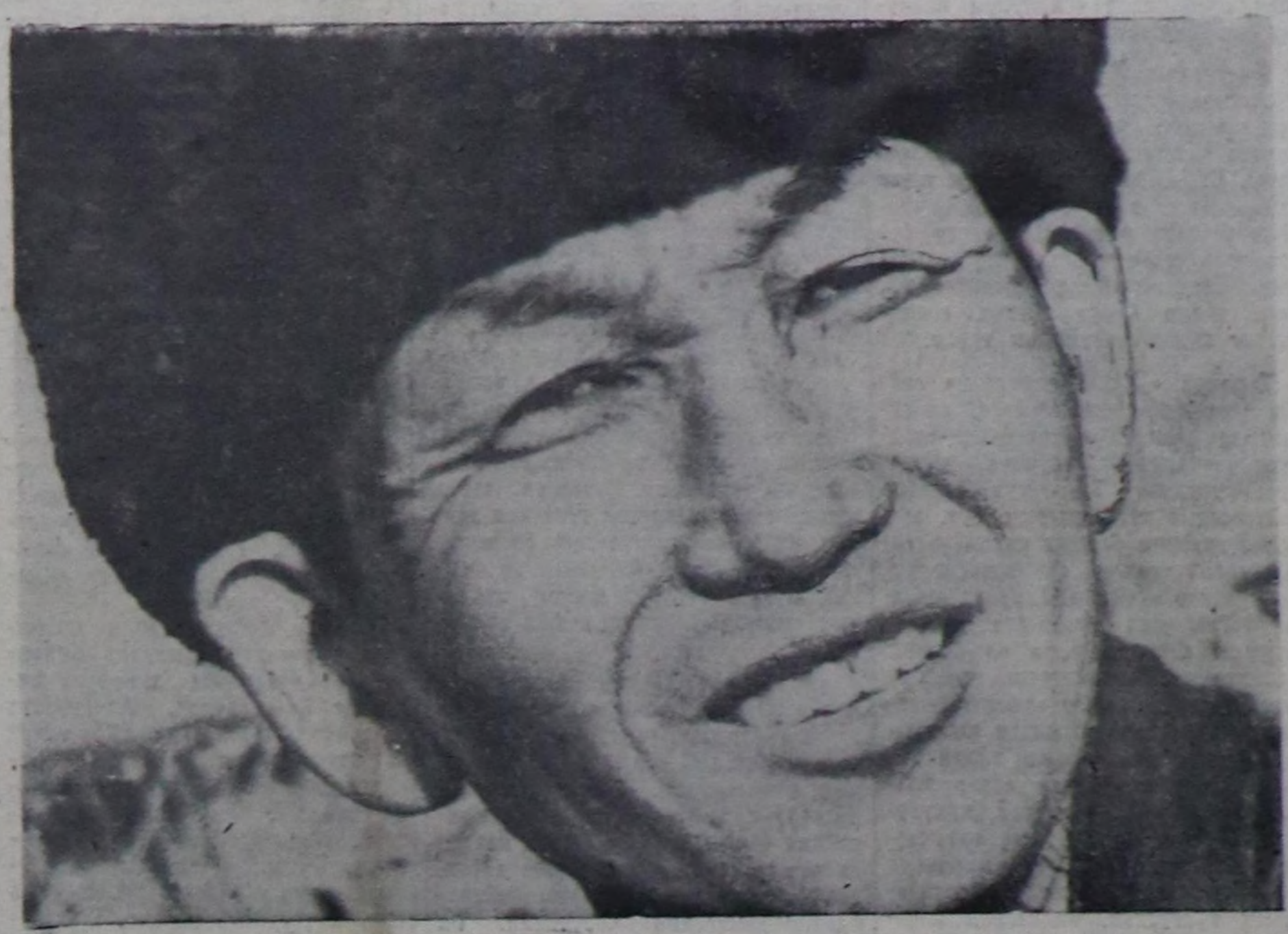
Чемгерген сөөлүнде хаваннарны арай чымыл болгаш дустуг суг-иле сугтарып турар бис. Казан чымыл бөөрге, апрель айда хаваннарнысты Борбак-Арыгже каяра бээр бис. Ичан 4 айда өрү намылг хаван-нарны биске немей хүдээлди бээр бөөр.

1961 чылда 2000 ажыг хаваннарны семиртир азырап, 200 тонна хаван эьдин бүдүрер дээш!