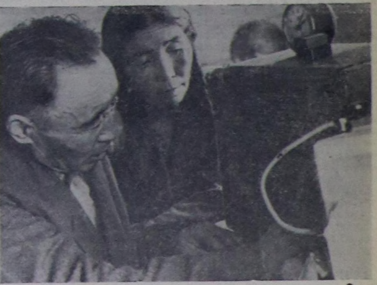
Бешки совет корабль-спутник дугайында солун-медээ бугу чуртта ышкыш Токунун, Тере-Хөдүн ачылганын болгаш Мунгун-Тайганын, Кара-Хөдүн малчыларында ол-ла дораян аямын берген.

Март 26-да Москвага Варшава керээзинин киржикчилери күрүнелерин Политиктиг консультативтиг комитединин хуралы аяптыган.