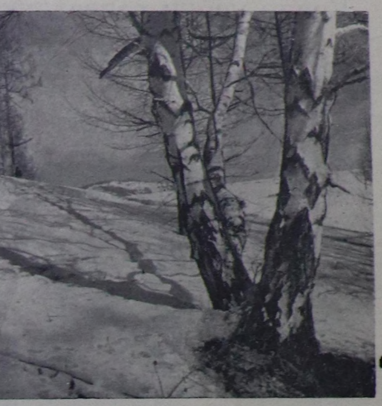
Часык каан хулаа.

Ук чөвүлө хуралда чугаалажып көрүп турар кол-кол айтырыларга хамма-рышкан болгаш АКШ-тын, Англиянын төлөөлөрүн мурнуудан калы кирген саналды смелээн. Ол организациянын бажына чангыс бүрүн эргелиг, шынгын болгаш шыгыч администратор-чатырыкчы олар ужурут деп америк төлөө оон ында мелеглээн.