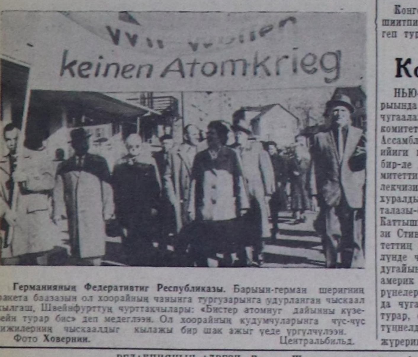
Германиянын Федеративтиг Республикасы. Барымын-герман шеригини ракетка баазаны ол хоорайнын чангына тургузарында удурланган чыскаал кылгаш, Швейнфуртун чурттакчылары: «Бистер атомун дайынны күзөө-вейн турар бис» деп мелеглээн. Ол хоорайнын кудумчуларына чус-чус кижилерин чыскаалдыг кылкы бир шак ажыг үдө үргүлчүлээн.

«ВЛКСМ-НИН 30 ЧЫЛЫ» (Улуг залга): «Рыжик»—6.45, 11.30 шактарда; «Леон Гаррос»—ажын дилеп чор—1.30, 3.30, 5.30, 7.30, 9.30 шактарда. (Биче залга): «Мультипликация»—12.30, 2.30 шактарда; «Кара-далай-жы кмс»—4.30, 6.30, 8.30 шактарда. «КАА-ХЕМ»: «Мультипликация» 10 шакта; «Сутга дүшкен корабил-чажыды» 11.15, 1.15, шактарда; «Беш хун, беш дүш»—3.15, 5.15, 9.15 шактарда. «ВОСТОК»: «Бүгү аргаар-биле» 11, 1 шактарда; «Катастрофа»—3.15, 5.15, 7.15, 9.15 шактарда.