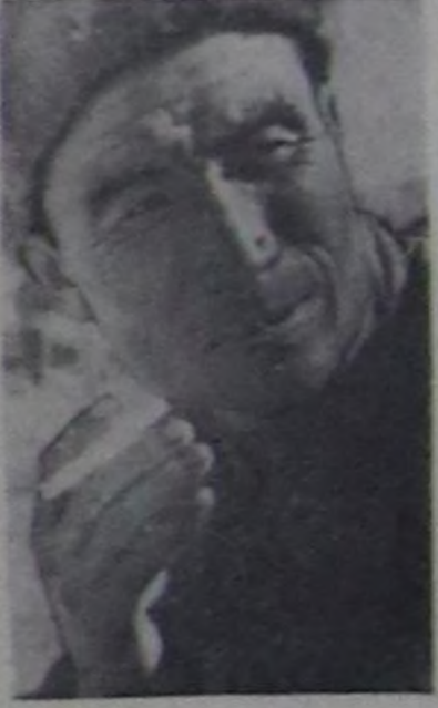
Эртен чылдын онаалгаларын чедишкенин күсеткен бис. Үлөтүрү бараанарынын магалынын болгаш столу-вайның даш тудууларын кылдып дооскаш, январь айдан эгелеп чаа школаның дөрт

Амгы үедө комбинат тудууну хемчээл улам калырып турар. Мен бо улуг тудууларны эгелегини бирги хүнүндө тура бо хүннерге чедир дашчы болуп ажылдап келдим. Ам комбинатта дашчы