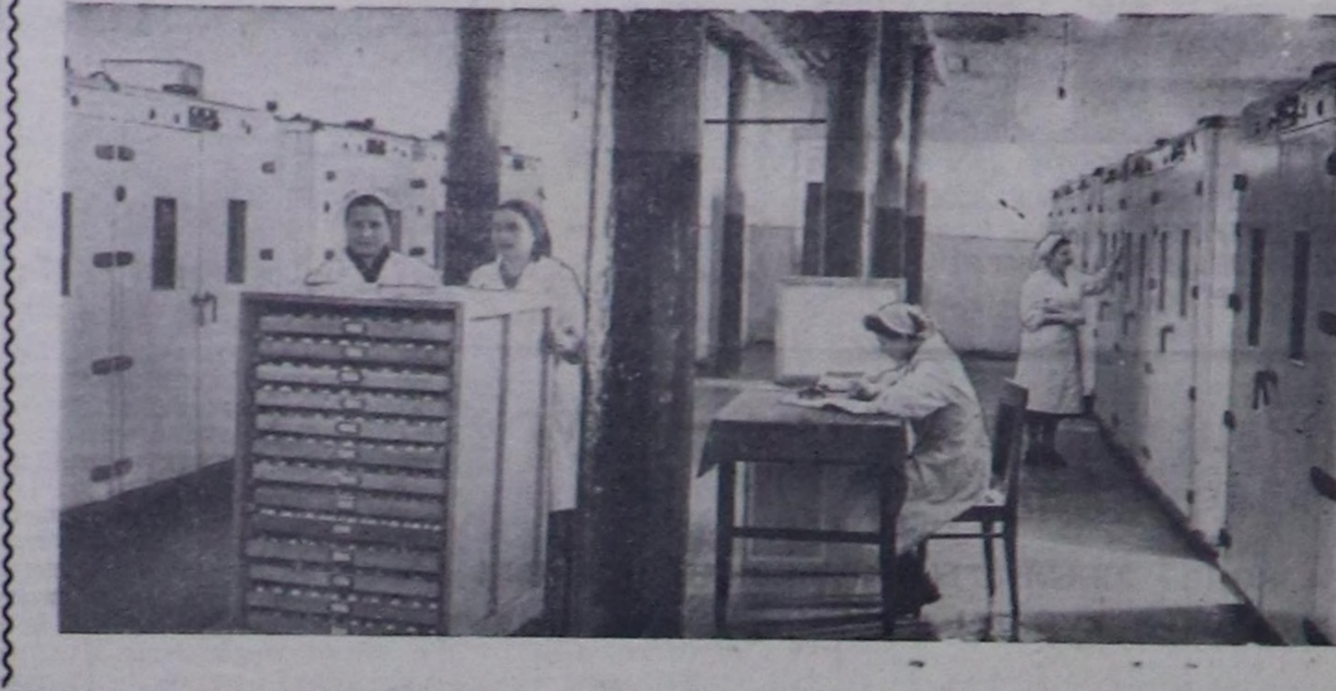
ПРИМОРСК КРАЙ. Буш ажылчынын инкубатор станциалары дага оолдарын бодун чыл дургузунда алдырыче шилчкен. Дага оолдарын өстүрүп турарында сезонут үени чайлаар чорук күш калканын чон ажылдар органы берип турар. Эң продуктулук күштар кышкы үезде оолдар кылдыр тургустунган болгаш бо чылды-на чуртаны берип өгөлзөр. Хороль станция күчүлүт инкубаторлар-биле дериттинген. Ол станция ажыл-агыйларга ам берин 46 муң дага оолдарын берген, а бугу чылдын дургузунда чартык миллион ажылчы бөөр ийикке, өрткен чылдындан 100 муң хой болур. Чурунта: инкубатор цетинде чуртулар салыр черде белеткедери.

биле 4 кг дүктү кыргып алмын. «Чаа орук» колхозтун хойжуу эш И. Авыккай төрүүр 100 хойдан 120 хураганнары өстүрер болгаш тыва уксаалы хой бургузундан 2,2 кг дүктү кыргып алмын хузаалган. Адынган хузааларын күтүсидир дөш колхозчу ажыл-ишчилер амгы үезде кызымак ажылдан турарлар. Районун колхозтарында төрөн 6485 хой, ишкунун 6443 аял, хураганын, 72 төрөн инектерин 72 бызааларын менди алган. Чер-чер Советтеринге сонгулдаарга белеткедери үезинде партия организациаларын ал чоруткан хемчеглеринын түннелинде март 5-те эркен сонгулдаарга районун сонгулчу чоннары шупту киришкенер. Чер-чер Советтеринге сонгулдаарын үезинде чедип адынган эки дуржулгаларын улам быжыгалап, партиялык политиктигиделиги ажылды мөөн сонгаар улам экижидери районда партия организациаларын мурнунда кол соругдаларын бирээзи болур. Т. БЕГЗИ, СЭКП Эриан райкомунун пропагандиз