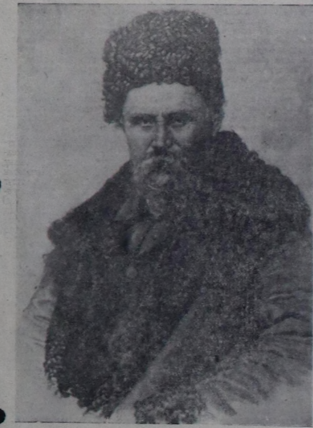
Т. Г. ШЕВЧЕНКО.

Багун украин улустун гениалдыг шүлүкчү, чурукчу, революсчу — демократ Т. Г. Шевченко мөчөн хундан бээр 100 чыл эртең. Тайбын камгалымын элээн хай национал комитеттерини санадып багун Тайбынын Бугу-деглейн чөвүдөлини Президиуму деглейн бугу чурттарына бо хуну демдегел эрттерини бир үн-биле дөстөткөн.