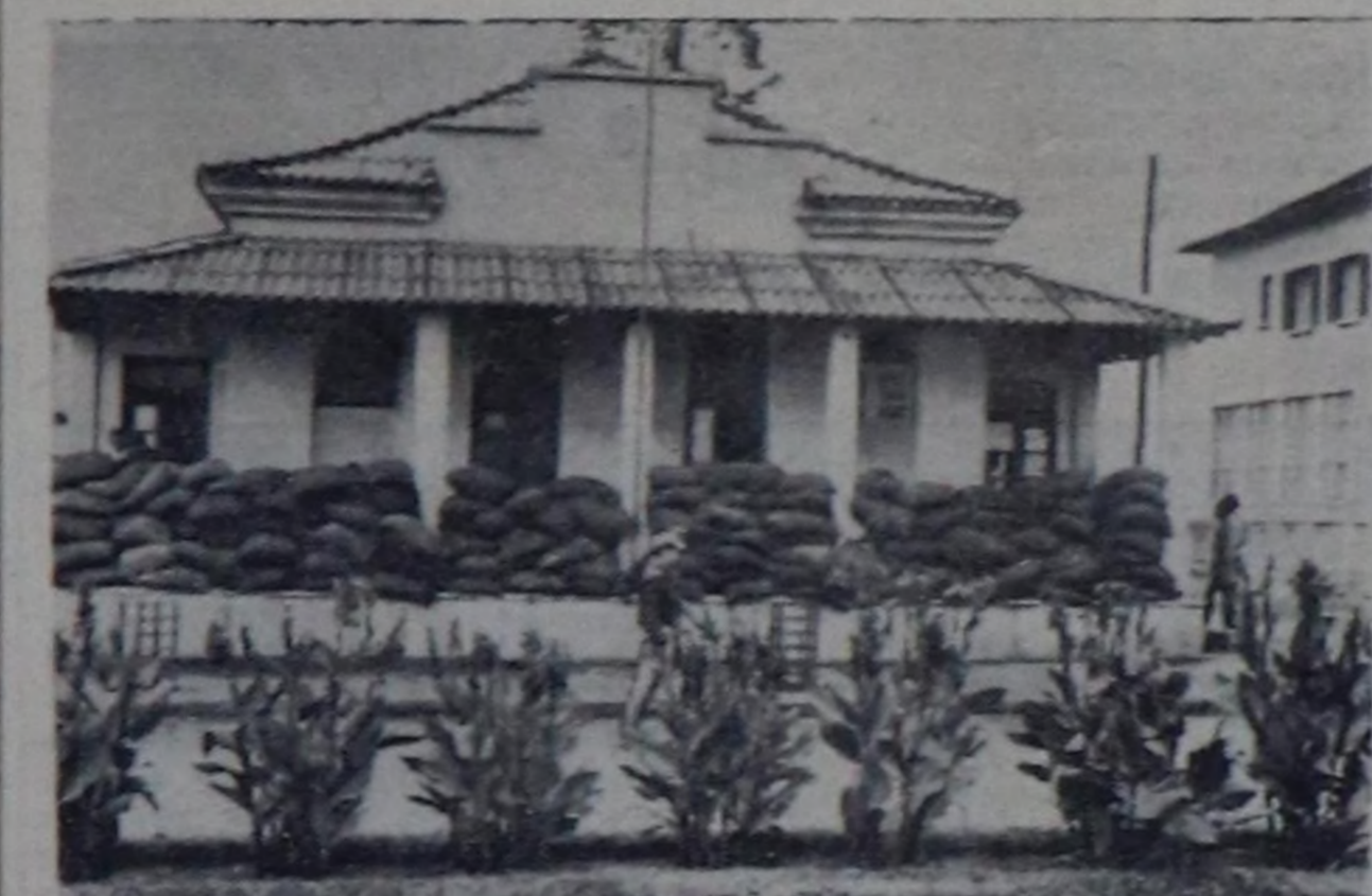
Сонгу Ангола. Португалдаа чурттал турар бажык. Ону долгандыр өлө-зонинг шоодийлар-биле онгулап каан, холстага дөш турар халымшымын кылган анголачылардын көргөзүш өлөз ону ийичап алгандар.