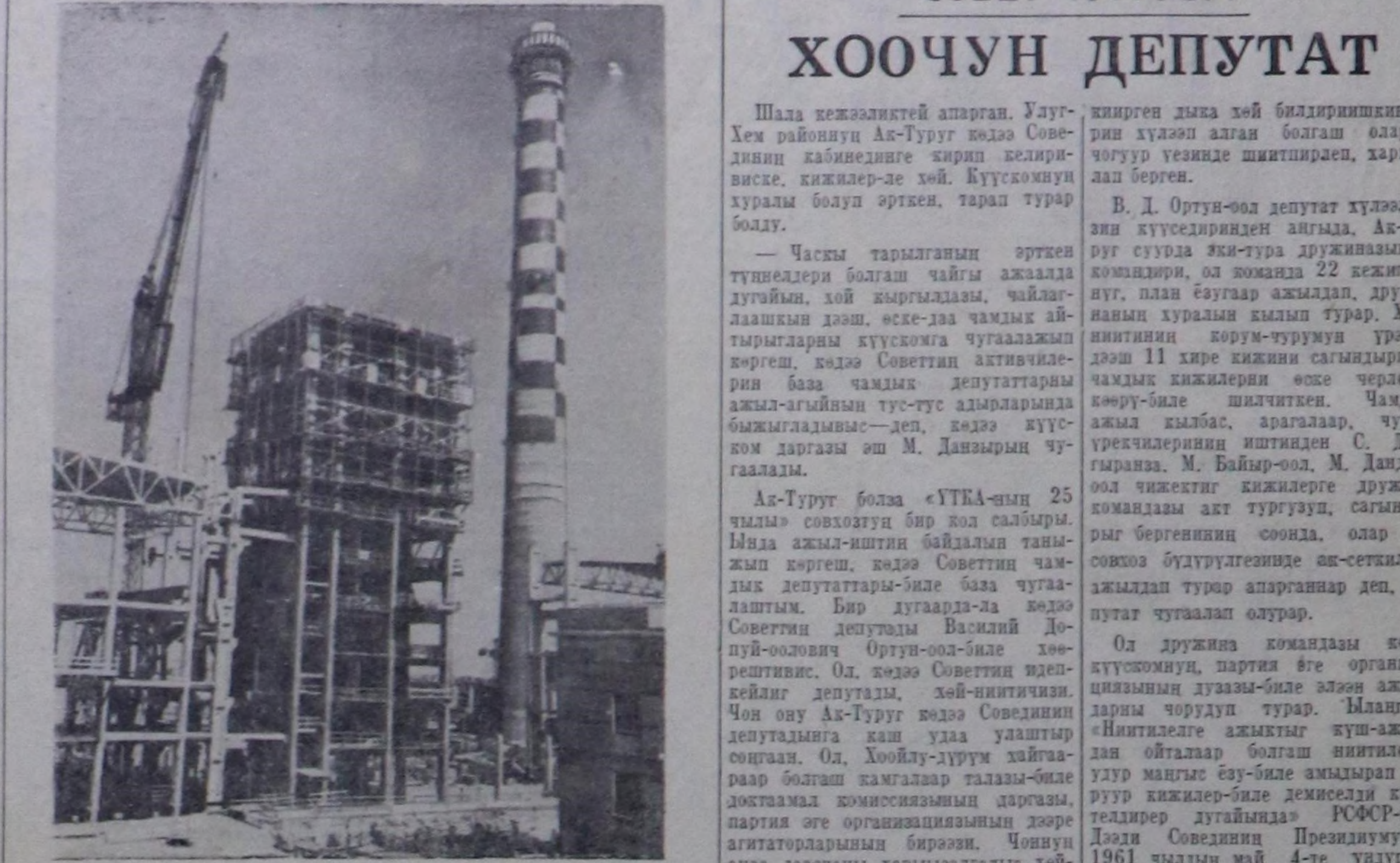
Иркутск Область, Ангарскиден ыран эвесе, нефть болбаазырадыр завод туудуп турар черде одалга-биле ажалдаар элентри төвү туудуп турар. Ол болза туудуп турар нефть заводун элентри күжү-биле, бус-биле болгаш ишиг суг-биле хандыра. Оң иңдей, чеди чылдың дургузунда аңаа тутуң турар кылымал волоконуну заводун база өл-ла ышкың хандырар. Ангарск хоорай база үстүнде айткын элентри төвүндө элентри күжүн алып.

«Ук болгун өрткөн өрөөдөлгө чылымды 24 кант кичээлден. Болгунун элөөң хей кичээлдеринге коммунист болгаш ажалчың партиялар