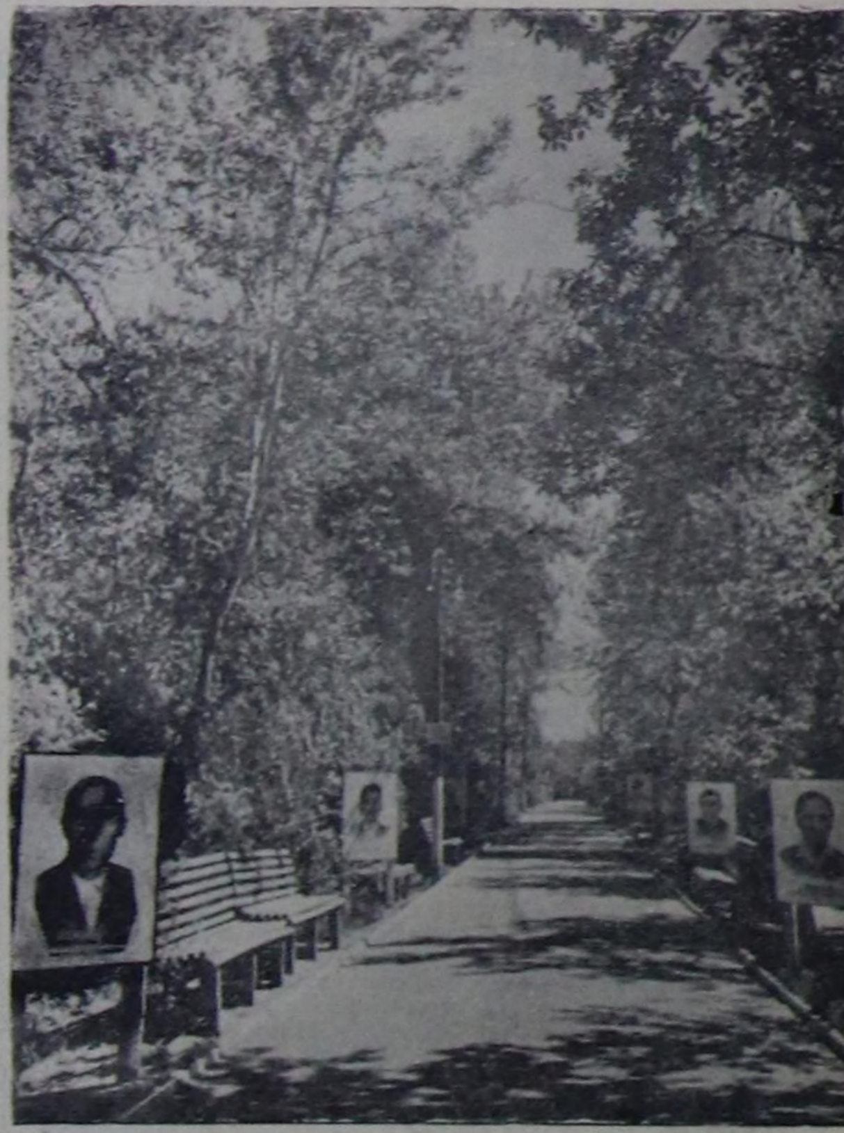
Кызылга Бултуренин болган дыштанымалык Гастелло алтыг пар-гында маалымар аллеясы.

Чүгүнө, Петушков болган меп ус-дарган училишенин директоруна чөдө бергезиле, Саратовтун инду-стриалды техникумунче бижи кыл-дыл бөзүр дилдесим. Бистин ды-лөвөсти ол эки сеткил-биле көргөн. Бистер халас биллетер ал алган, поэзияге олургулапкан, Волгаже халаткан бис.