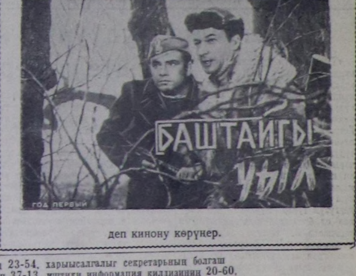
Баштайгы режиссер деп кинону көрүнер. 23-54, харысалгалы секретарынын болган 37-13, иштиги информация килдизинин 20-60, барганда 32-75 телефонче долгара.