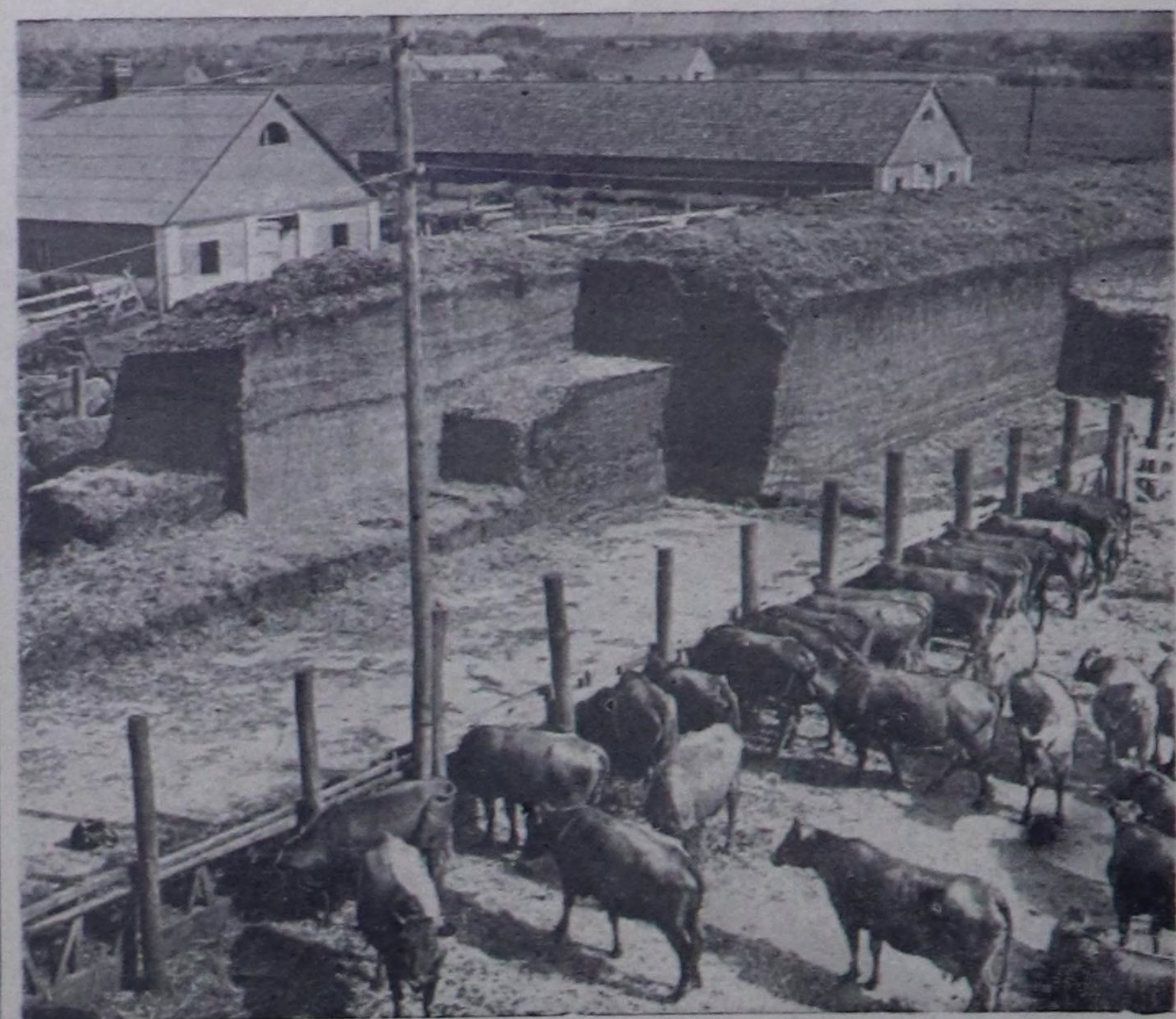
КРАСНОДАР КРАЯ, Тимашевск районда хаваан ажылдыны «Кубань» совхозунун сууруга үндө-лөш дуржулга-көргүзүгө амыл-агыйн организастап турар. Чеди чылдын ийги чылында ажыл-да-лай черини 100 гектарына ошаптыр 280 центнер эшти болгаш 253 центнер сүтү бундурген.