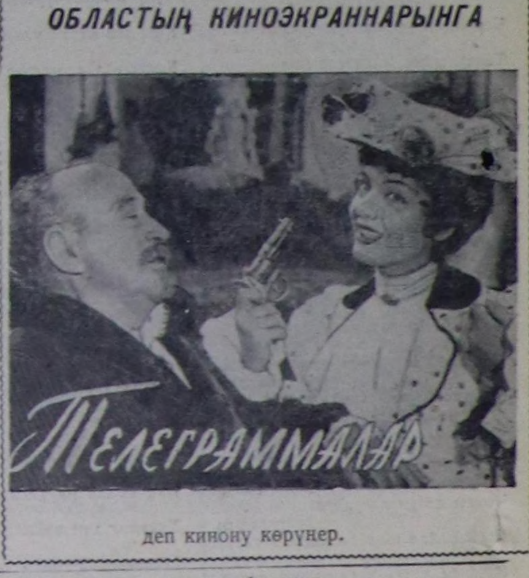
деп кинону көрүнер.