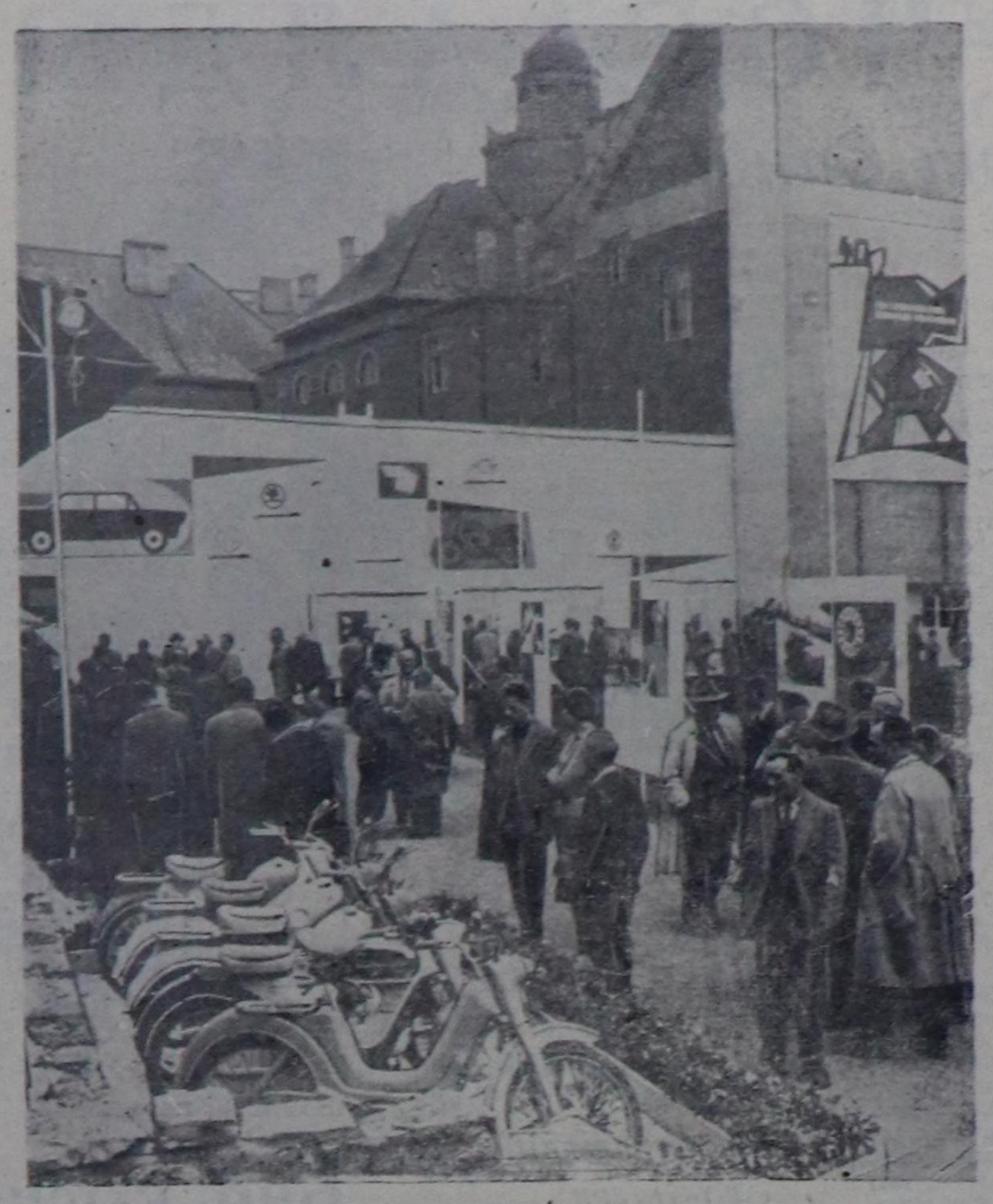
Чехословакиянын Социалисттик Республикасы, Прагада машиналар болгаш мотоциклдерди амыттыган. Ам 53 чурттарне сөөртүн үндүрүп турар чехослован автомобиль улетпунун продукциянын ында делген көрсүкенин. Дайын муркунун үезинге бодаарга, машиналарны болгаш мотоциклдерни дашкаар үндүрери 9 катал көвүдзөн. Чуртута: делгенгеде.