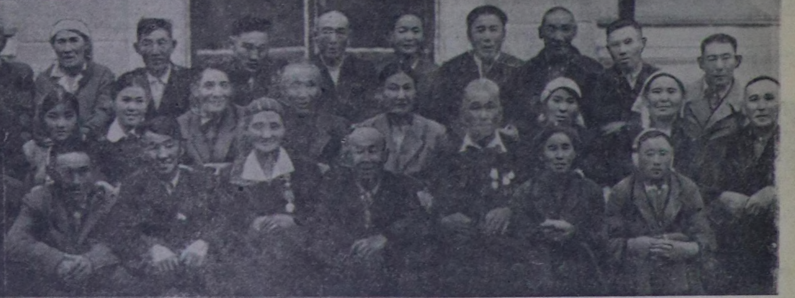
Июль 8—9 хуннеринде областың малчынарының Наадымын эрттирер дугайында СЭКП обкомунун бюрозунуң доктаалын өзүгээр бөгүн ук Наадым Кызыл хоорайда культуруның болгаш быштанкылааның Гастелло аттыг парыгының ногаан театрынга эгелзээр.