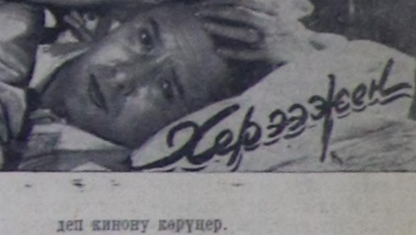
деп кинону көрүрөң.

РЕДАКЦИЈАНЫН АДРЕЗИ: Кызыл, Шеткинн кудумчузу, бажын № 3 ТЕЛЕФОННАРЫ: редакторунун 24-63, редакторунун оралакчызынын 23-35, редакторунун оралакчызынын 25-38, партияжи амыдырал болгаш культура амыдырал калдыктеринин 21-27, лтяжылдакчыларынын 22-64, бухгалтериянын 31-75, корректорларынын 21-47, Солун калбей барганда 32-75 телефонтө долгаар.