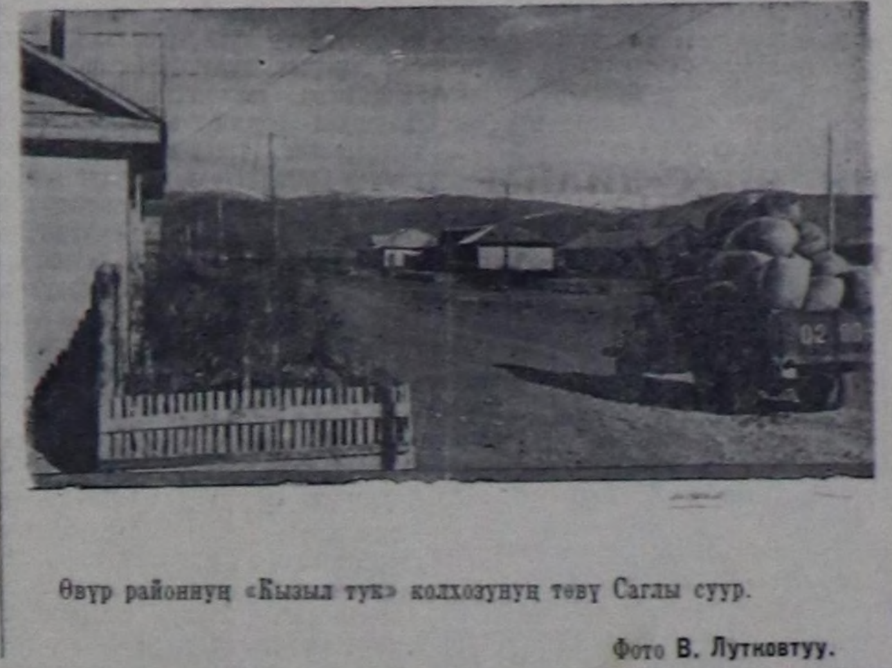
Өвүр районуң «Кызыл туя» колхозуңуң төвү Саглы суур.

Бо кинону «Мосфильм» киностудиясы бугуруп үндүргөн. С. БАИР.