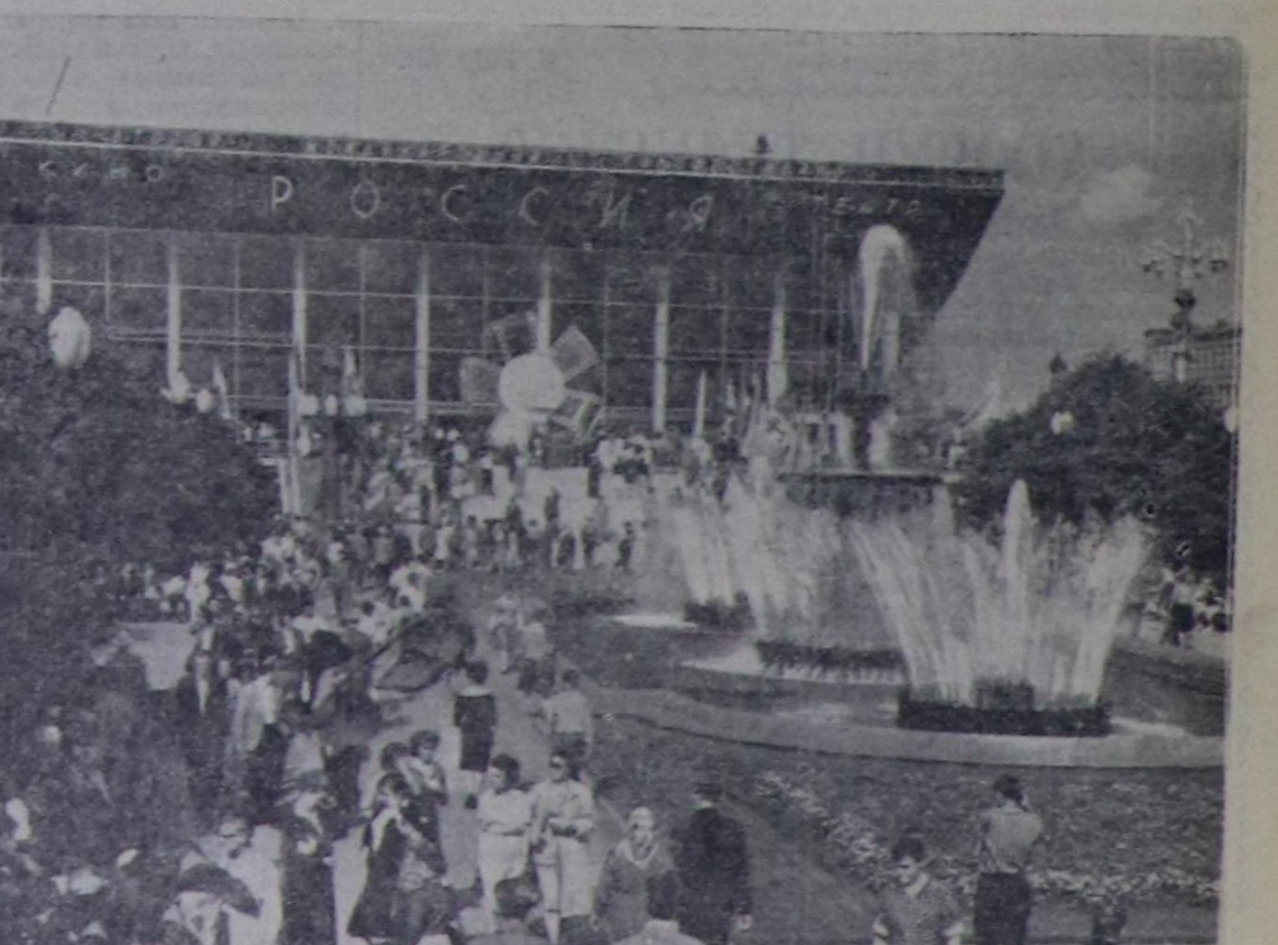
Москвада Пушкин шөлүндө чаа, найысылда эң чутула, «Россия» деп кинотеатр ажиттынар. Делегейниң Москвада ийги кинофестивалының фильмнерин ында көргүзүп турар.

Таңды районда «Совет Россия» колхозтун шөлдеринде чаагай тараалар быжып турар. Ону чогуур өйүндө ажаап алырынын дугайында колхозчулар сагыш салып туралар. Тараа кургадар болгаш урар черлерин бүрүн белен ботураган. Трактор-хову бригадаларында болгаш топ туралда тараа шыжаар черлерин септеп арылаан, склад херекселерин чүрүмчүткан. Тараа кургадар черлерде электри моторларын белен ботураган, электри дамчыдылгаларын, кургадылга агрегаттарын хынап, септеп каан.