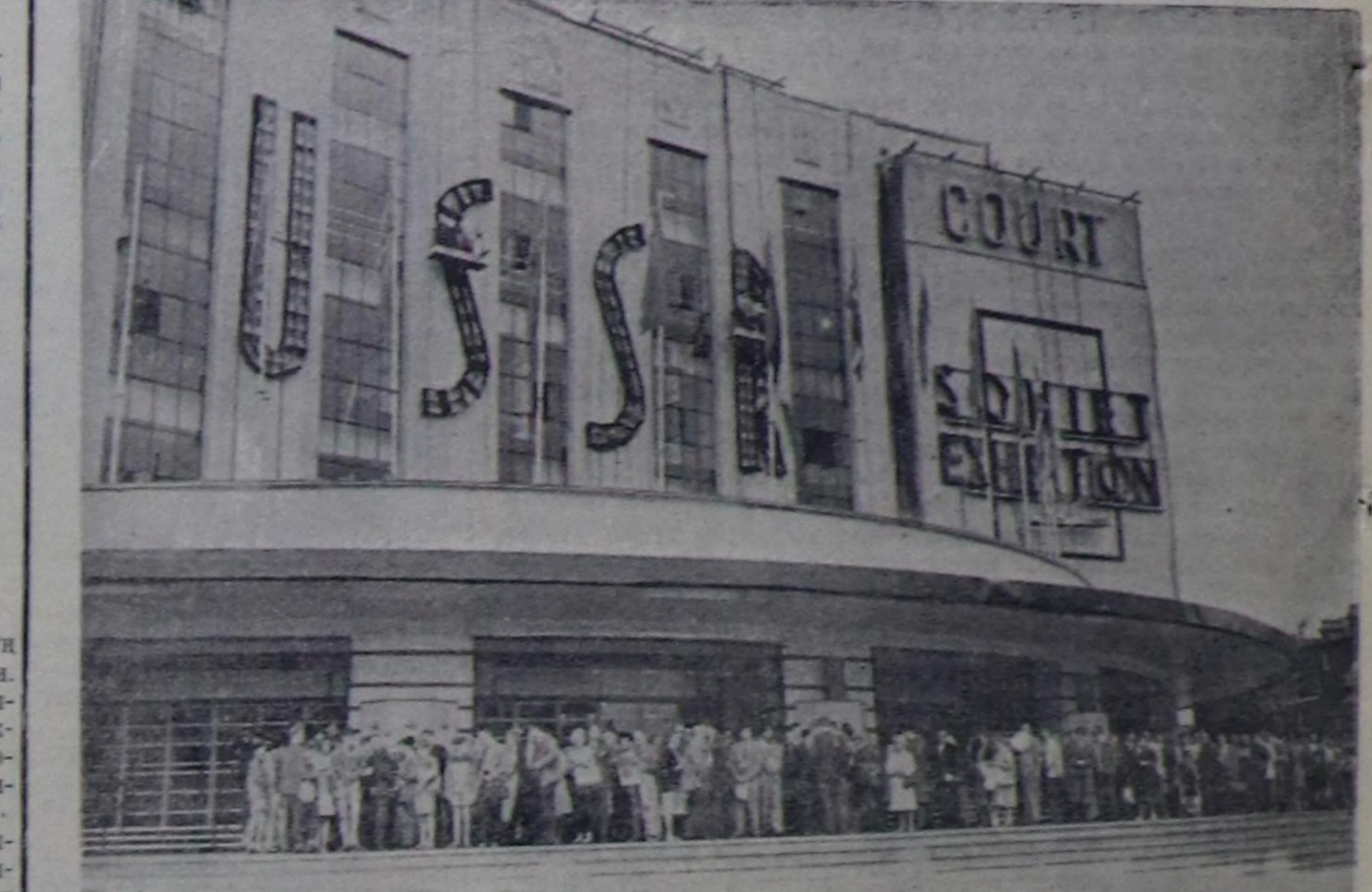
ЧУРУКТА: Делегележе кирер элжик англичанларнын ээлже манап турары.