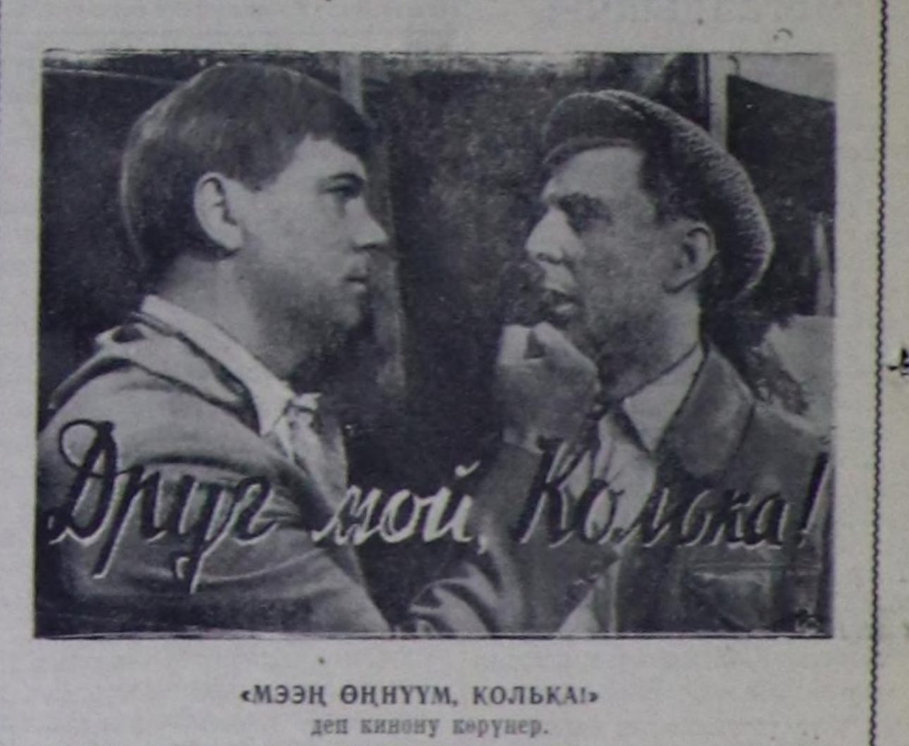
«МЭЭҢ ӨНҮҮМ, КОЛКА» деп кинону көрүңер.