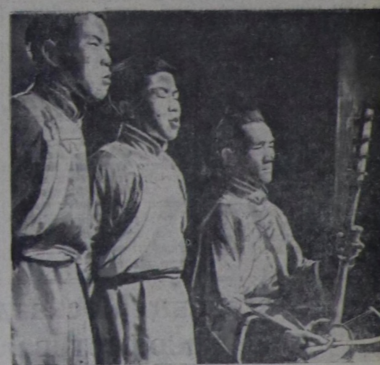
Ийн кижинин катый күүсеткени сыгыт аялганы чангыс аай, тода дыналып, аянын уран хевирин көрүзгүлөр турган.