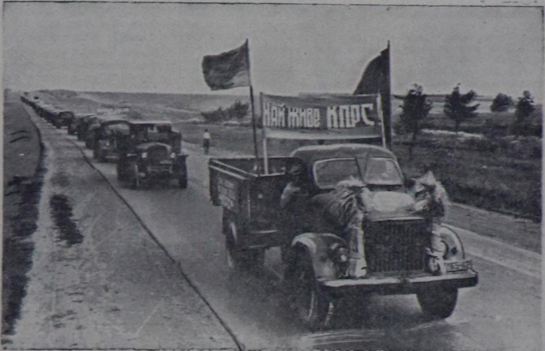
ПОЛТАВА ОБЛАСТЬ. Полтава районуну колхозтары дүжүт ажаап алышыкынын болгаш тараа дуаалажыг чедикширинин чорудуп турар. Байтагы ошон мун пуд кызыл-тасты элеваторда чедирген. СЭКП-ниң ХХП съездининге төлөпиг ужуражыр дөш демисешпашан, районун колхозтары күрүнеге тараа садарынын планын 15—18 хун ишине күүседирин дүзөгөн.