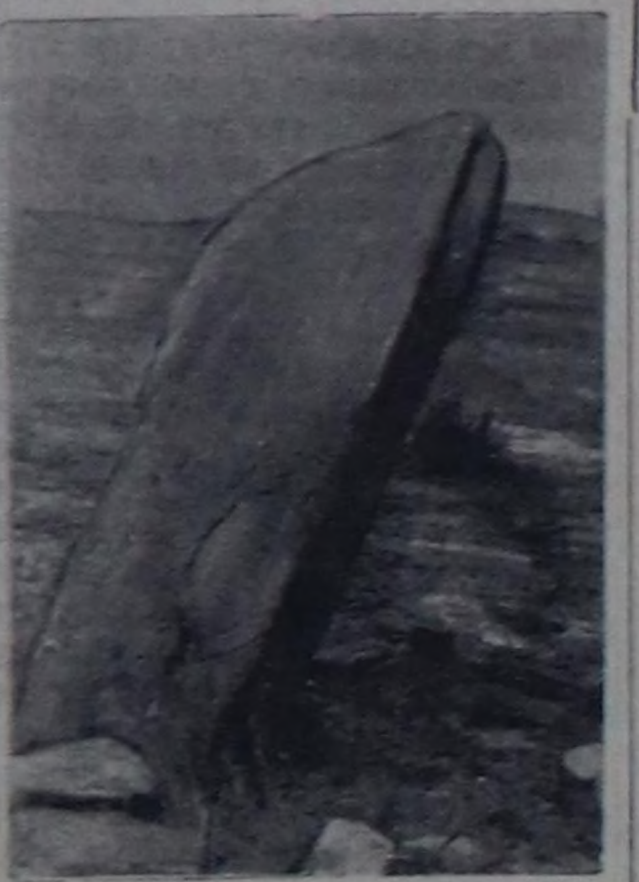
Чурукта: Тывада көжээлериниң бир хевир.

чидел музейниң чымып тургузар сорулга база салдыган. Төгү болгаш эртем талазы-биле улуг ужура-дузалыг бо ажылдык чедершикинниң ботландырып чорударына Тываның калбак хөй-инициализиң идеялеп киркилдигеи ролдуу дээрнэ чугаажок. Эртемденерге улуг дузаны Тываның колхозчулары, совхозтар ажилдакчылары—механизаторлар, кадарчылар, областын бузуң, суур бүрүзүнүн улуг, биче чурттакчылары чедирин болдуруп. Ол мнчаар эртем ужура-дузалыг бо чугула ажилга школарның өөреникчилери, башкылар, студентлер, эмчилер, геологтар, агрономнар, зоотехниктер эң идеялеп келгилер киркир ужураут. Турскаал көжээлериниң тип улуредери-биле кады дымды өөрениргине дузалыг-ла бүгү дымдыгыларын, медээлерин, чугааларын демдеглеп чымып, мончээр база эржекч чугула. Турскаал көжээлериниң кайда, кандыг байдалда туруп турарын дымдык литературадан болгаш төөгүзүн Тыва эртем-шичилел институтунче (Кызыл, Кочетов кудумчузу, бажын 12 «а») болгаш башкы чурт шичилел музейинче дымдыгы кончук күзенчиг. Бо талазы-биле дымдыгч дараазында чүдөдери тодардыр: көжээниң хевир (турар көжээ, чыдар көжээ, хада бижиктер болгаш дүрү-хевирлиг чуруктар), даштын өңү, бижиктердин аңгыда анаа чоран чуудар, ук турскаал көжээниң кайда, кандыг чурдурарын, кайы районнуң девискээринде турарын, оларның чурттакчылыг чедерин кайы уунда турарын, оң чанында хемнерин, дагарын, ол мнчаар турскаал көжээлерин айтып берип шыдар кижилерниң фамилияларын, оларның чурттап турар чедерин тода айтыр керек.