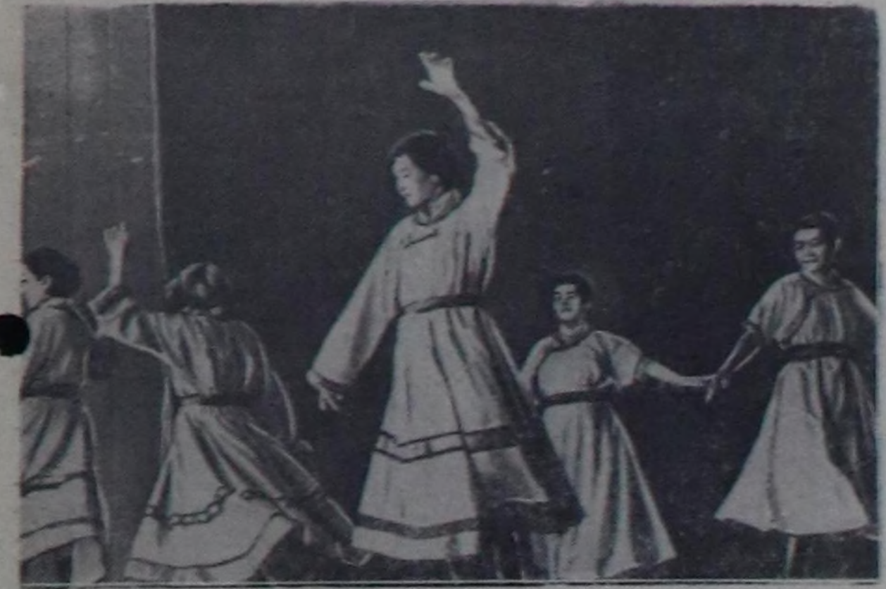
Бай-тайгажылар «Куулар» деп танымын күсөдүп турлар.