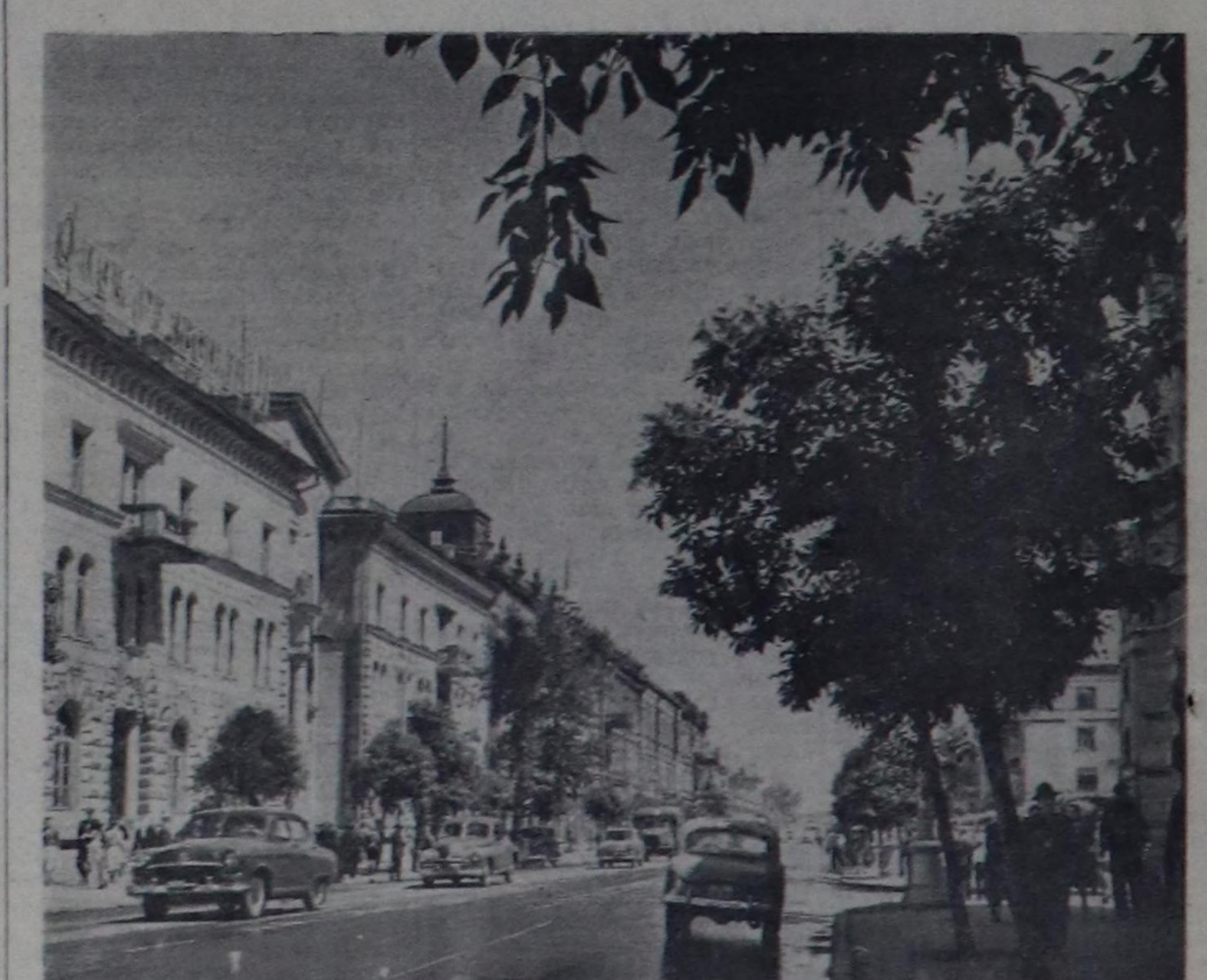
Иркутск. Карл Маркс кудуучуу.

волюция мурундагызында ийи катап хей чуртталга бажынарнын ажалгап кырген.