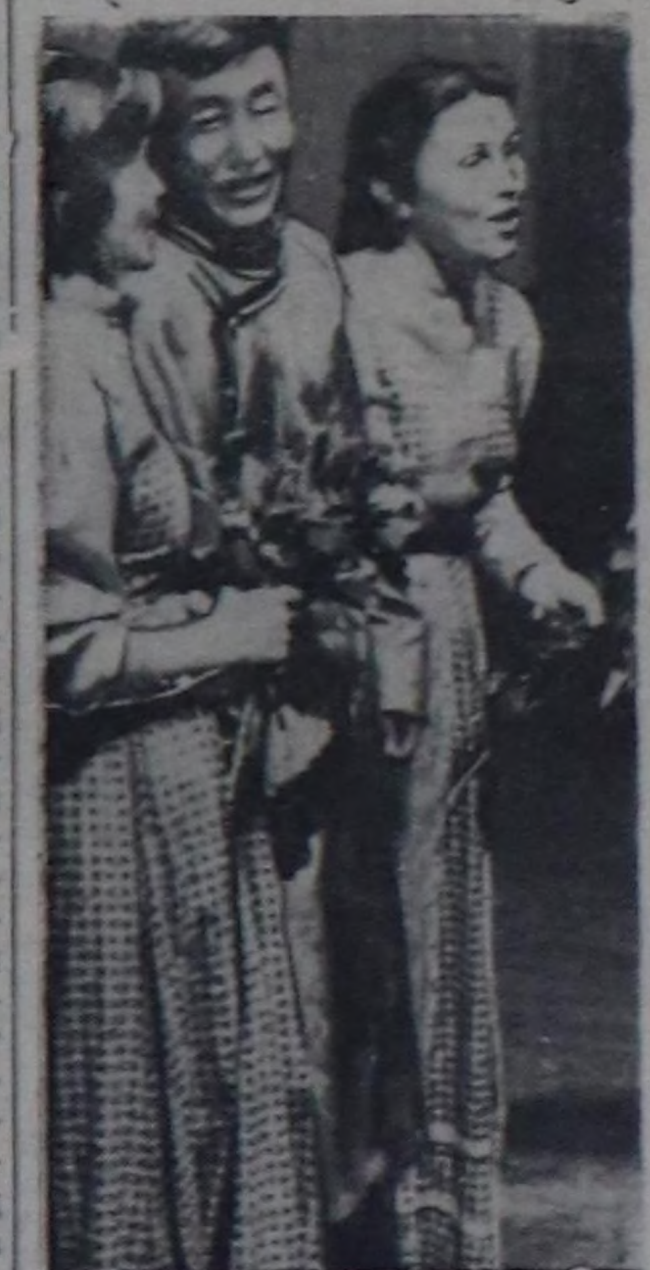
Чурукта: Чөөн-Хемчик районун бот-тыныгы урам чүүл бөлгүмүнү киржилгезин найы-ралдын ыры ыраажы турары.

Е. КВИТНЫХ, Кызылдын № 3 школанын башкысы.