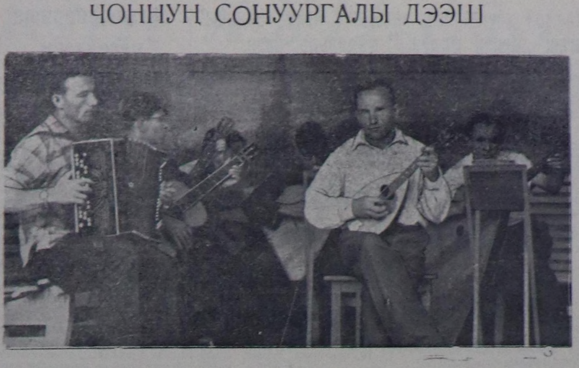
Областың хереглекчилер ништелиниң эвилелинде бот-тывынгыр уран чүүлүнүң улуг коллектив бар. Ол коллектив боктаамал ажилдап, чонга солун концерттерни көргүзүп турар.

бан-хаакчылар, дээди өөредилге черлеринин болгаш техникумнарнын студенттери, тудугчулар, чок-кавынын кезде ажил-агый каттыжымшыкынырын араттары, социализми тургузар талазы-биле моол улуска социализм чурттардан кези дузалажып турар тускай эртемнигер өрткөн. Чыксаалчылар Маркстын—Энгельстын—Ленинни, МАР-нын удурткучуларынын портреттери, моол улустун улуг чедикшикеринин дугайын чугаалап турар диаграммалары болгаш мааттарлы транспорттарынын тудуп алгаш чоруп турган. Делегейде баштайгы совет космонавт Ю. А. Гагаринин портретин, совет спутниктеринин болгаш космиктиг корабльдеринин долгандыр жузуп турар кылдыр чурраан бөмбүрөктин хевирин чыксаалчылар кудуруп алган чорган. Эң муракчы совет эртемге алдар болдурган, моол болгаш совет улустарын бугузабы байырынын алдар болдурган өөрүшкүгү Өөрөлд салымшыкыны чангылап турган. Улустун чыксаал байырлары 2 шаг ажы үеде үргүчүлөөн. Чыксаалга 120 муң ажы кизи киришкен. Хүннүң ийги чартында Улан-Баторнун топ стадионунга Улустун Улуг хуралын президиумунун даргазы Ж. Самбу надынын—моол улустун чамдык болган байырларын ажиткан. Аңаа спорттун явзы-бүрү маргыдаалары, өвнөр, массалиг селгүстөөшкөн болган.