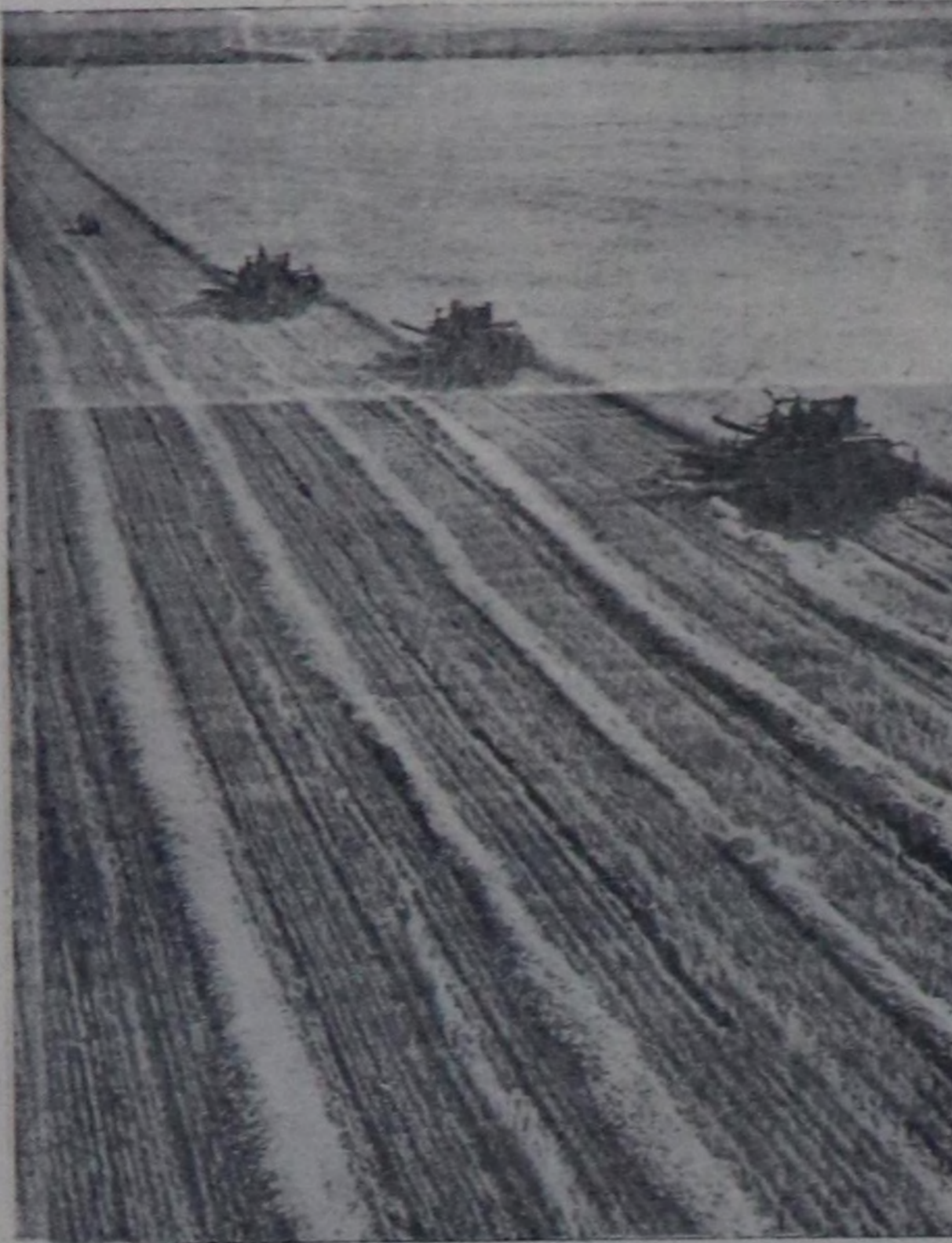
СТАВРОПОЛЬ КРАЙ. Күзүн тараан кызыл-тастың болгаш арбайның чаагай дүжүдүнүң ажаап алышыны Ставропольдун колхозтарында болгаш совхозтарында чоруп турар. Буюн чартын миллион гектар шөлдүн тараанын ажаап алып ужурул— ал болза эртен чылдындың үш чүс мүн гектар хөй, күрүнеге 75 миллион пуа тарааны дунаар. Чалдай кестирер кылдыр эде дерзэн 3620 бөдү чоруур болгаш конжугат комбай-нар, эмеш кылдыр кылган тараа кестирер 2650 машиналар шөлдөрдө ажылдап турар.