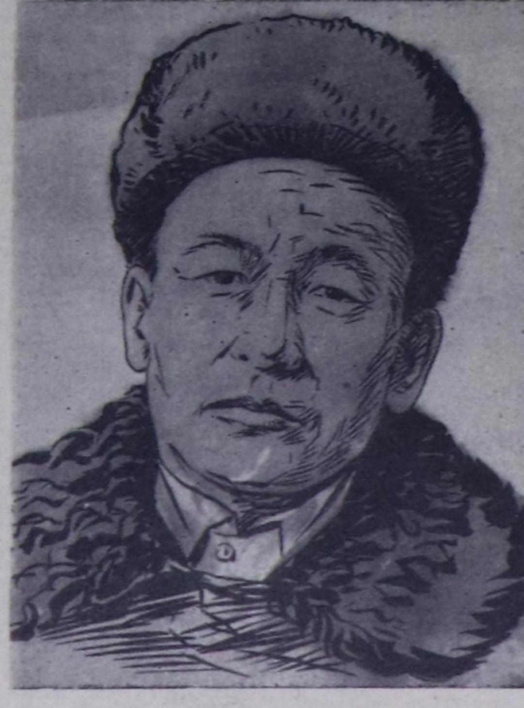
Орржак Лопсанчатын кайгамчыгыг челишикиннерин база ачаа Маадыр атты тыгысыкын баштай дыкнаш, өөрүп-даа, адааргал-даа турган мен. Өөрзөн чүвөм—угунда кайгыс-даа чандык чөм—Балн-Тала кижилери, бодум ышшаа хойжу мен чөм.

дишикиннериг бооп турары, алаарган чүвөм—мен Таңдынны кайгамчык делген оларлары, мал чөм эгээртинмес черде хиремделе куду түннелдим. Чүнүң-даа мунунда эш Лопсанчач хойларны ийи улаа оодадып турары менээ билдинген. Оон ышай оон кошарларын эдержилгеге канчаар кирип турары база менээ билдинген турар. «Мен канчап ыччаар ажилдап болбас мен» деп бедал менден ыравастан. Маадыр ышшаа эвес-даа болза, черде дээр түннелди көргүзөри менээ күзөңгит турган.