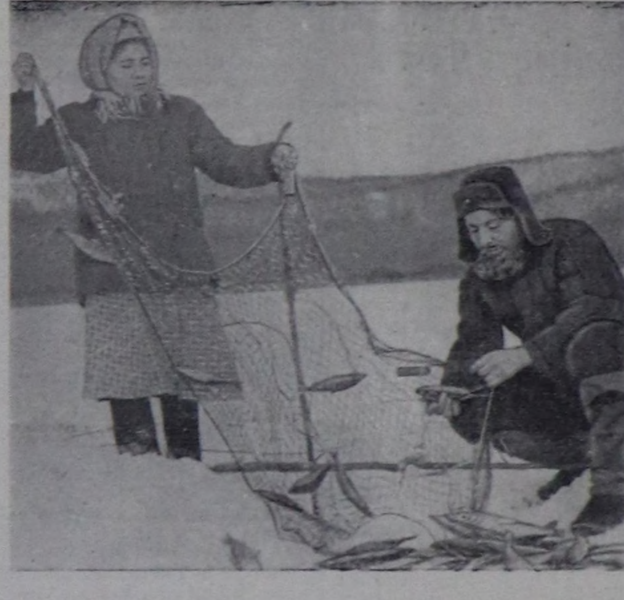
Хам-Сыраның анымыр-тывыш девискээринде элэн хам хемнер болгаш хөдөр бар. Олар калдыгы, мыйты, бел, шортан, мезил болгаш өске-даа балыктар-биле кончук байлак. Амгы үеде Ноян-Хөдү эриинде балыкчыларнык улуг бригадалары чурттап турар.

Чайын Соруг кемге балык тывыжыга ажылап турган мен. Ол хемде калырым, мыйты, бел, мезил дээш өске-даа балыктар кончук хей. Мен өм эээн-биле 2,5 тонна балыкты туткан скалка дужаган бис. Чаа анымыр сезон эгелээр билдек-ле тайгага аннап үңгөн бис. Эрткен чылдың анымыр тывыжынын планын 146 хуу күтсеттим. Бо сезонда бирги түңүштүзе 2 кишти, 175 динниң алуурш дужаган мен. Ол болза СЭКП ТК-нын эртен аявар Пленумунга белээм-дир. Партиянын ХХІ съездинде алар-барыны социалисттик чарыкка киринишпашан, алган худалделерини бугу өөртүтүлөр талазын биле ажыр күтселдириши күтээнип тур мен. Л. СЕЛИГЕВА, аңчы.