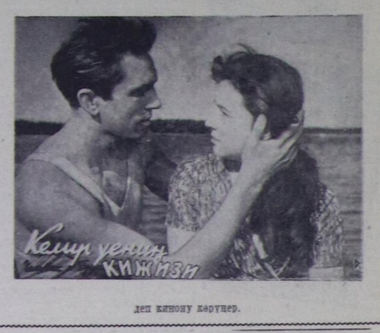
Кешү үезинде кызыл дөш деп кинону көрүтөр.