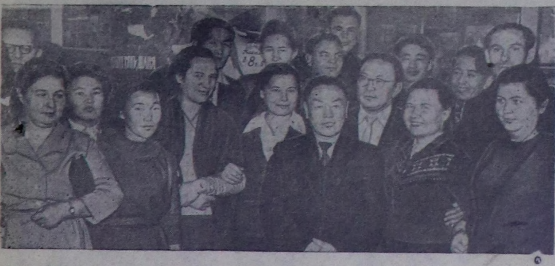
Тыва АССР-ниң культура-чырыдышкын албан чарларинин ажылдакчыларынын чөвүлел хуралы болуп өрткөн. СЭБП-ниң XXII съездининин ажылынын тундурлар болгаш республиканын культура ажылдакчыларынын сорулгаларынын дугайында айтырарыны анаа чугаалашкан. Республикага культура албан чарларинин ажылы чонун амыдыралы-биле улам сыйрып холбаштырып, СЭБП-ниң XXII съездининин ма-»