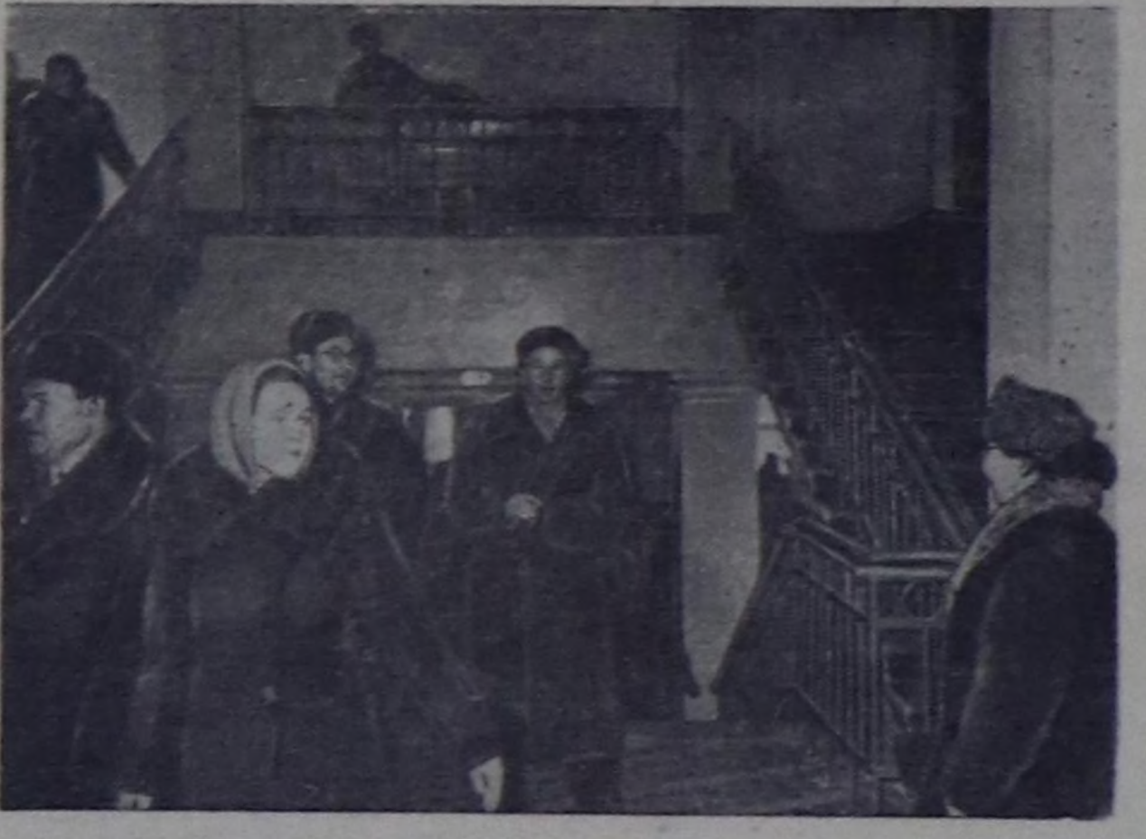
Чурукта: Кызылда чаа ажиттыган «Найрал» киностудияның ишти.