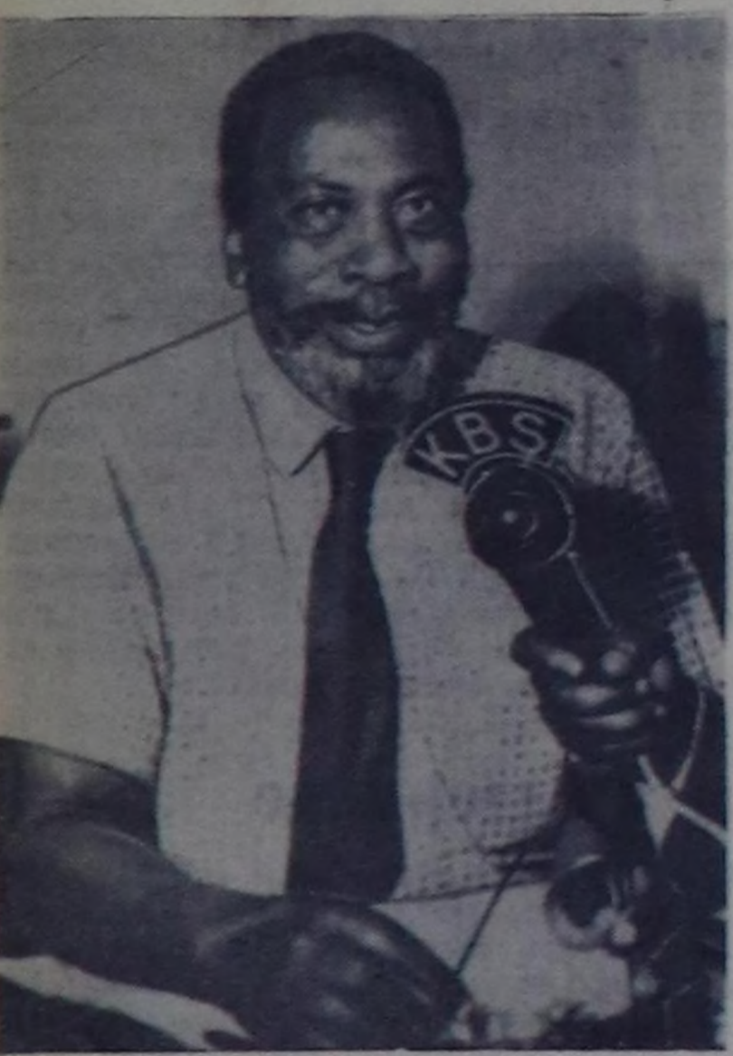
Джомо Кениата—Кения улустун национал-хосталгалыг шимчөө-шинияни удуручүзү. Ол болза сес ажыг чылда хоругдашынга болгаш шөлүгеге турган. Делегейин хей-ниитинин болгаш Кениянын улустунуң негел-дезин өзүгээр Джомо Кениатаны чоқтап англи эжелекчилер хостап удуур уурга таварышканнар.

БЕРЛИН. (СЭТА). Герман Демократтыг Республиканын наймысла-ды-биле Барын Берлиндин аразында кызыгарыян ийи тутуларын барын берлин өчкү-чөңгөчилер августун 24-че дүңдөин урөрин орадашканнар. Боттарынын хууда аймык чок чорууну эрге-ажыктары барымдалаары-биле кызыгар-га канып-даа өчкү-чөңгөчилер байддык мөөнелинишкини кылбазы-че Барын Берлиндин хамаат-лары ГДР-ни иштиги херектер министерствоу августун 24-те база