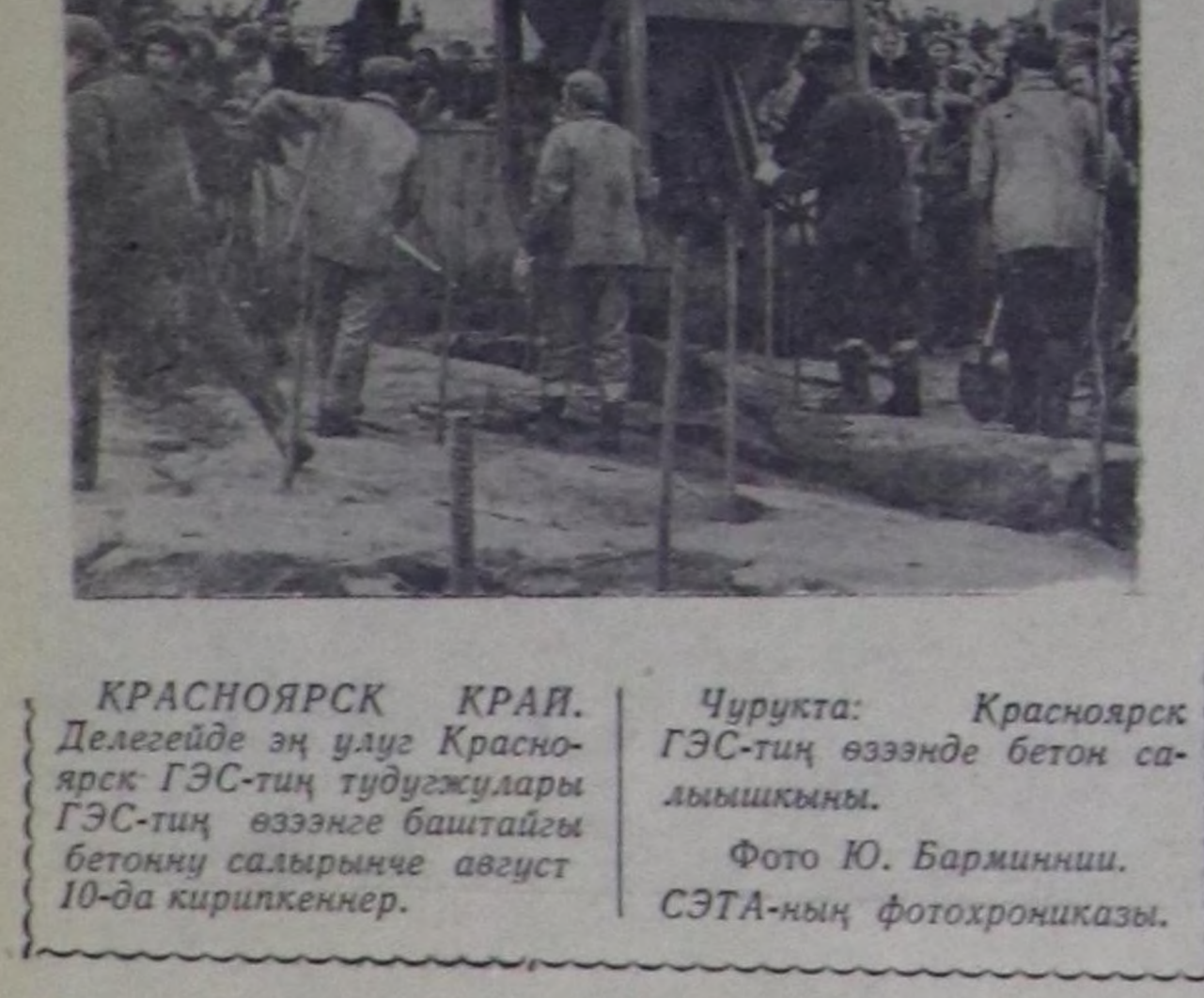
Чурукта: Красноярск ГЭС-тиң өззөңдө бетон салымшыкы.

Улетпур, транспорт, харылза талзын-биле доктаамал комиссия (даргазы А. Грозов) активти мобилизаставышкан, улутпур бдүдүрүгелериниң социалист күрөөлөдириниң күөсөдөң болгаш бдүдүрүп үндүрүп турар продукцияны шындыр кириштирериң дугайында хоорестетти сессияныга чугаалажыр айтырыгың беткезиле. Эш Грозов бо айтыры талзын-биле сессияга илелек кылган, хоорайнык улутпур бдүдүрүгелериниң ажылдык четпестери, колбаса фабриказының, хлеб, сүт заводтарының