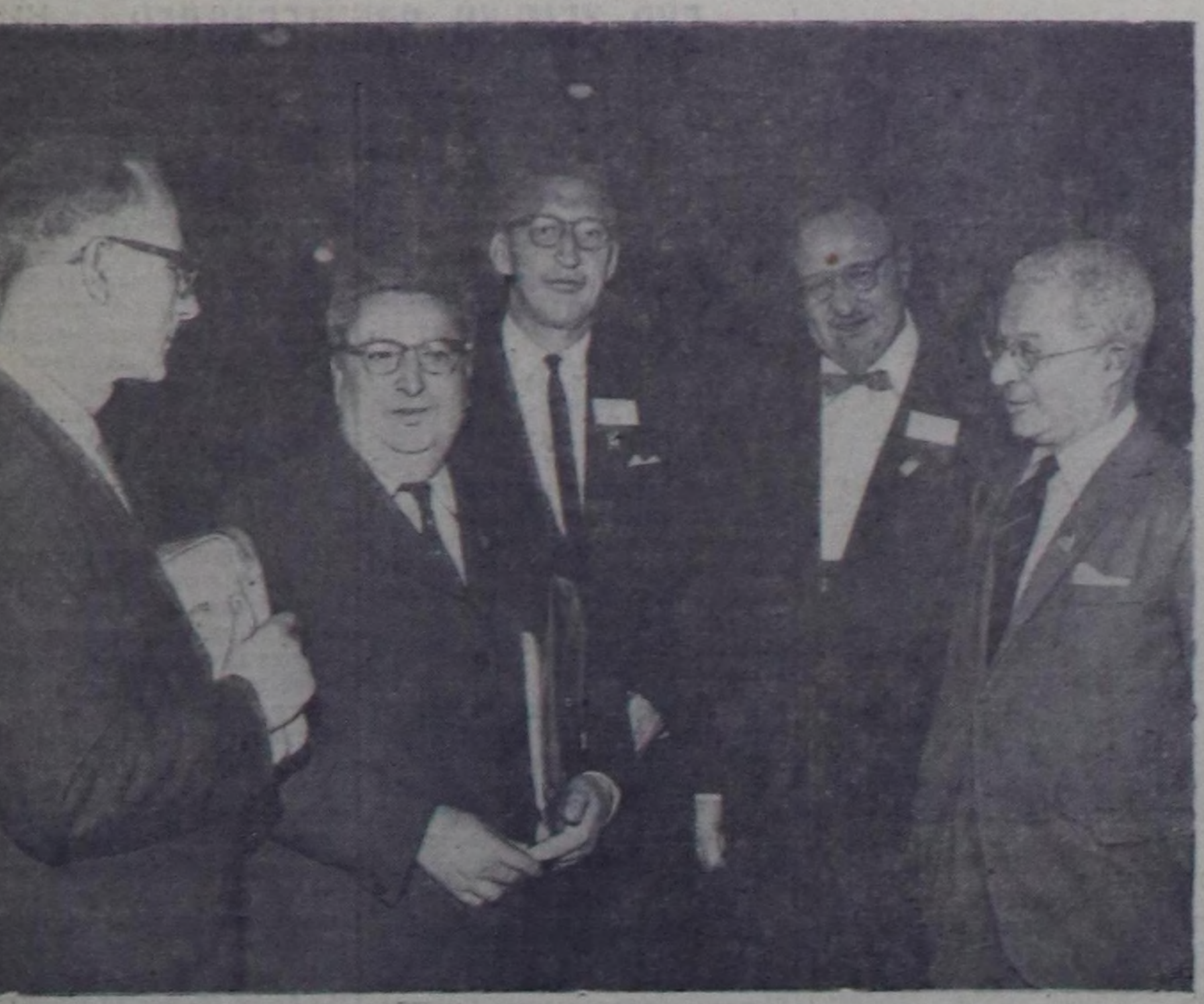
Москва. В. И. Ленин аттыг стадионун Топ спорт Ордунга чөөфта чаа делегейин бөшки биохимиктер конгресс болуп эрткен.

2. Өрт аймылын азы арым-шевер эвес байдалы таварыштырып болур туудуларын бо чымылган болгаш мотодромунга Чехословакиянын, Польшаның болгаш Совет Эвилелиниң мототехникчилериниң маргалдазы болган.