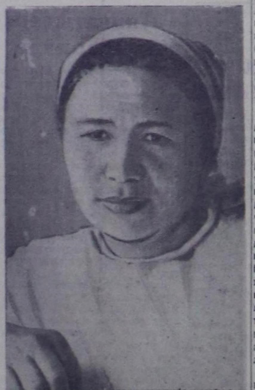
В. Ф. Дудаева.