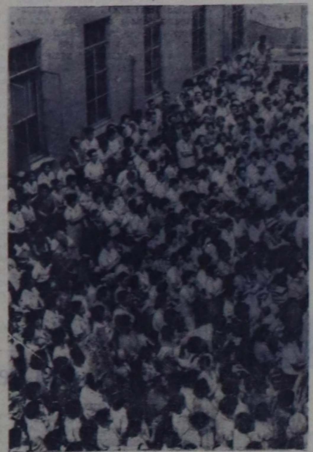
Бо чакын Японияга полкомисиятын аарып чоруктуң муң аажы таварыгалары даямдалганын. Элең каш он-он таварыгаларга аараң кижилер өлүгүн турган. Полкомисиятке уду эмерия — галантиянын болгаш дигр вакцинына СССР-ден салып алырын чакса бовайын турарынын дугайында дынадымы япон парламентга парлап үндүргөн. Совет эмерия садып алырын негез иелерин шынчешкини бүтү чуртка калбарып үнгөн. Хей-ийти санал-оноланың басымыкыны биле япон чакан Совет Эвилелинде 10 миллион түң вакцины садып алган. Чуртука: Токиодо урутлар полкомисиятке уду совет дигр вакцины алыр дээр чыглан чоң.

нистрлер Чөвүлелинин Даргазынын бири ораалкчысы А. И. Микоян япон чакантык кижигунеринге алдар болдурган эртемиңи шайдаланы тургускан. Август 17-де жеке Япониянын үн эң улуг экономиктиг организациялары: экономиктиг организацияларын Федерациясы, Япониянын садыг-улуттур палатасы, делегей садымын жөгүдериинин Япон чөвүлели А. И. Микоянга алдар болдурган дүштеки шайдаланы тургускан. Дүштеки шайдалага ол организацияларын даргалары, а ол ышкаш садымын болгаш үлүпүрүн эң улуг компанияларын төлөөкчилери одурушкан. (СЭТА).