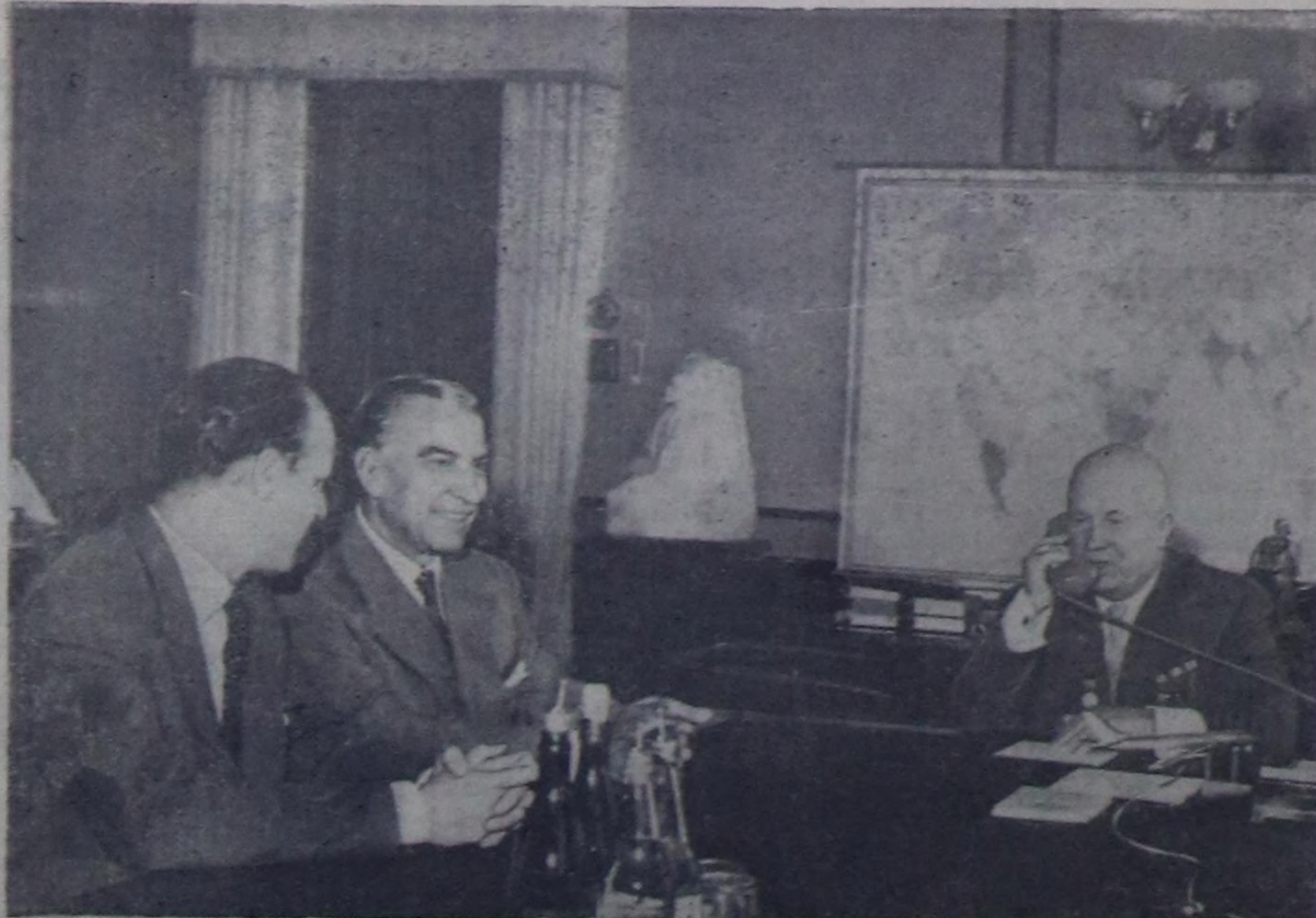
МОСКВА. 1961 чылдын август 7-де Н. С. Хрущев черге чүткө чаа кээп чонупан ужудукчу-комсомолат Г. С. Титов-биле телефон дамчыштыр чугаалашкан.