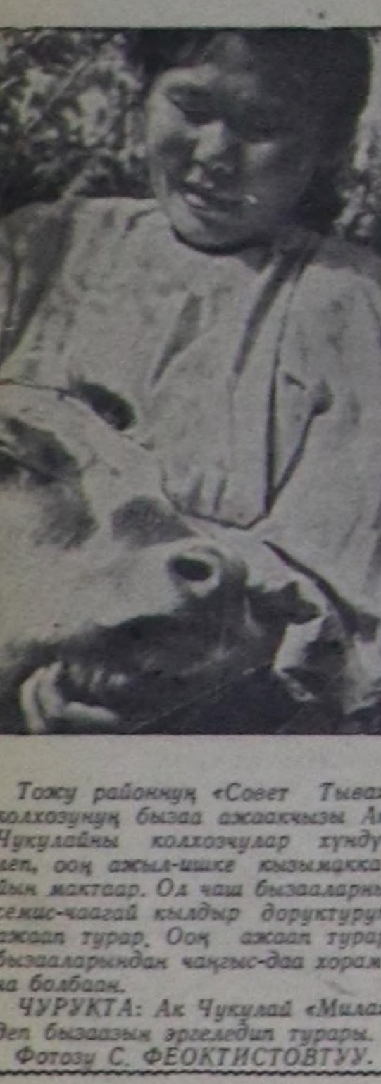
Тожу районун «Совет Тыва» колхозунун бисте ажыдашкан Ак Чукулдай колхозчулар күндү-лөт, оң ажыл-ишке кызыкса-бын мажар. Ол чаш бозааларын семис-чагай кылдыр доруктуруп ажаал турар. Оң ажаал турар бозааларыңдан чакың-даа хорам-ка болган.

Бистин областа СЭКП обкомунун, хооромунун болгаш райкомарын планын 104,4 хуу, транспорт орга-