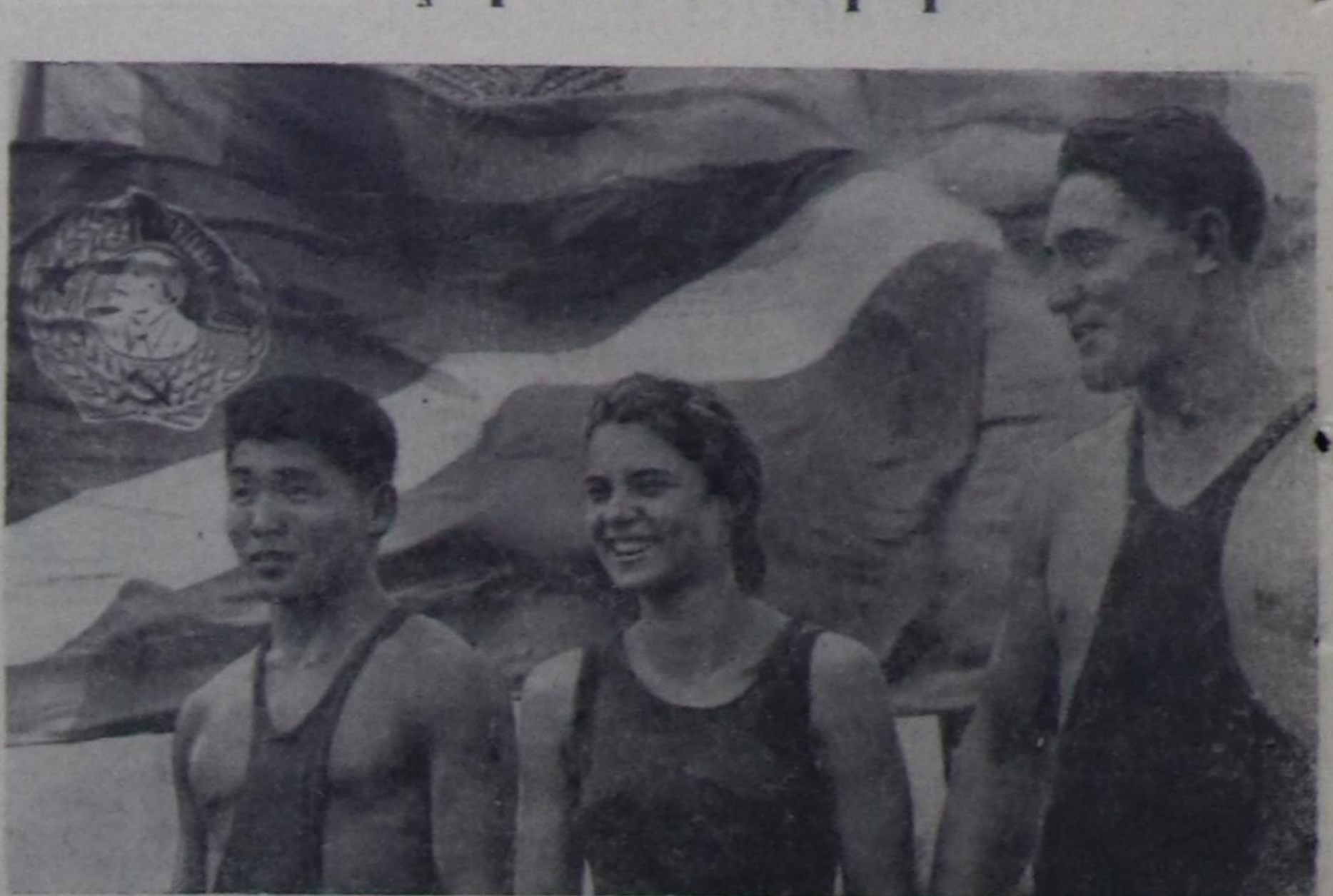
Фотоплакат Г. Сиротинниң.

«КУШ-КУЛЬТУРА БОЛГАШ СПОРТ КИЖИЛЕРНИҢ ХУН БУРУДЕГИ АМЫДРАЛЫҢГА ЭРГЕЖӨК ЧУГУДА ЧУГУ БОЛУ БЭЭР» деп СЭП-нің Програмазының төлөвилелинде айтылган. Бо дөргө коммунистич шилгеле үезинде күш-культура шимчөөшкениң миллион-миллион чаз кижилер немежил, күш-культура болгаш спортту массалыг, бугу улусту болдура дээни ол.