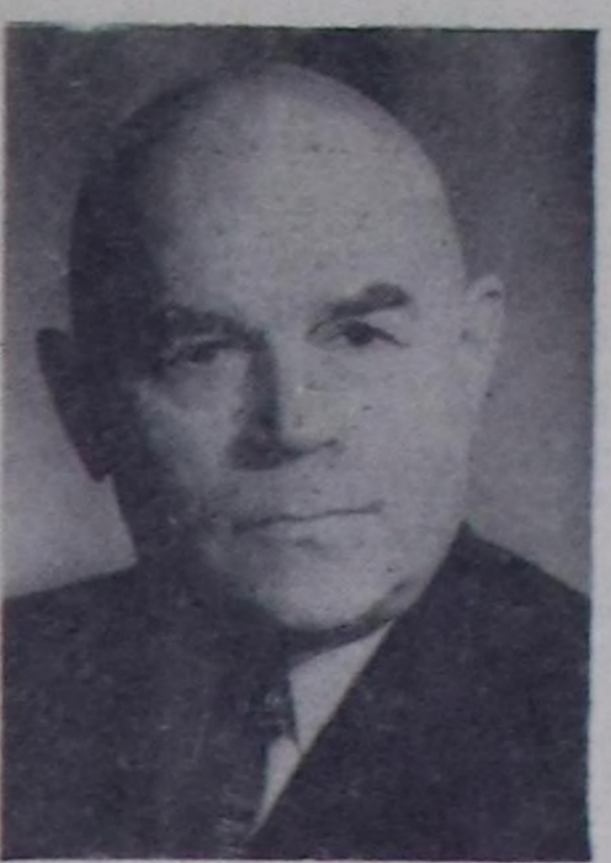
Н. М. Страхов.