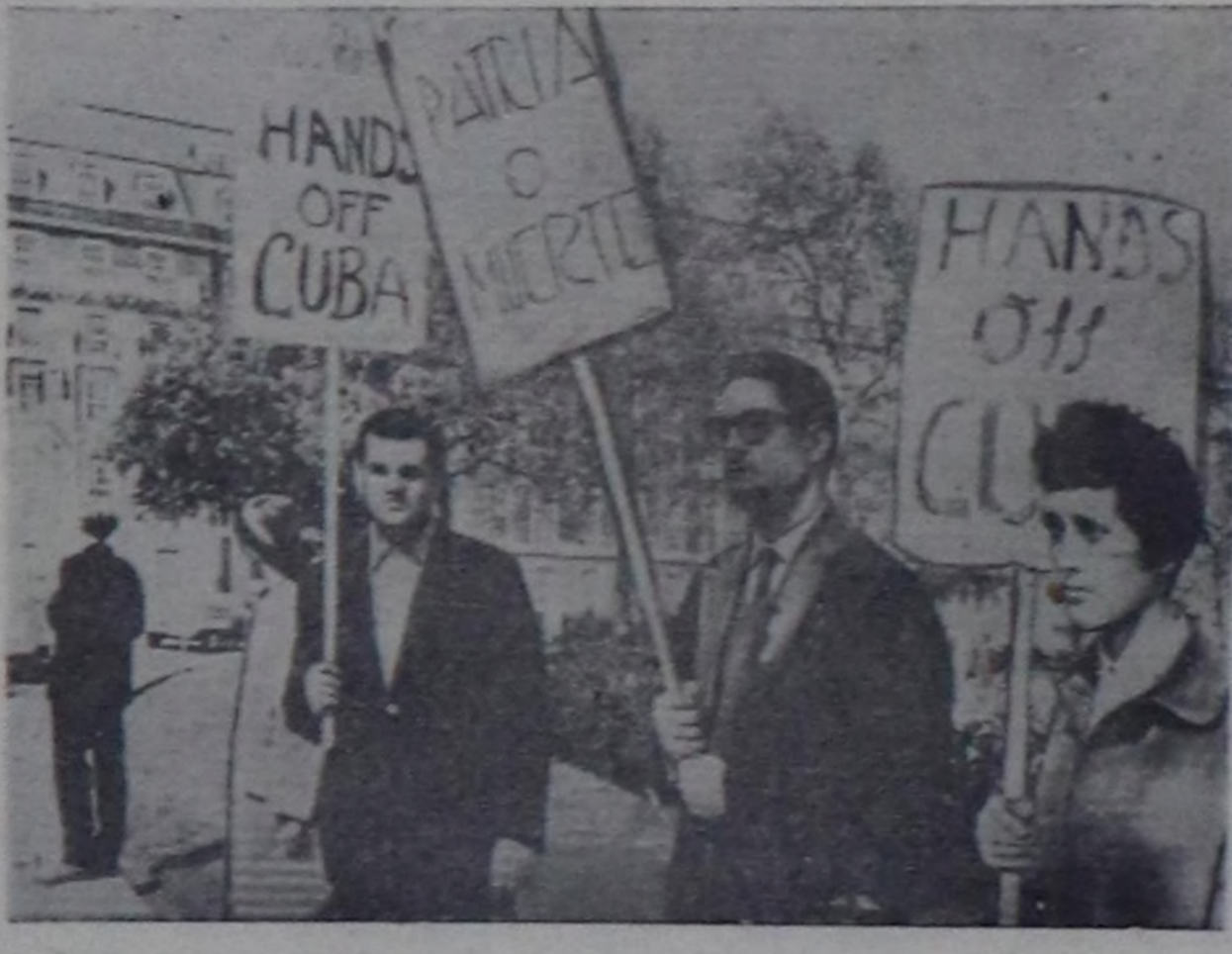
Англия. Чокта Бубага удуу чөпектиг интервенция болуп турда, АКШ-тын Лондонда элчин чериниң бажымышкы чыныга дыка хөй амыктар кыйгырылган болган негеделер бижип каан плакаттарын тууду алган, ол агрессияга удуурашп турганар. Студентилериниң холууда плакаттарда: «Кубадан холун ырат!», «Төрөөн чурт азы аду!» деп бижип кааны көстүп тур. (Фото-чуртукту фототелеграф дамыштыр алган).

ПАРИЖ. (СЭТА). Франс Пресс агентиледин корреспондентинин Элизабетвилден дымнатканы болза Катанганын шитки херектер «Министри» Мунго дээрэн «эрге-чатырганы бодуучу хорууга алган, Чомбени хостазын баар болза, Леопольдильге удуу дайын эгелээр мен» деп шиттирлээв.