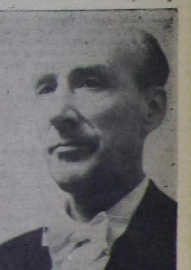
Е. А. Мравинский.