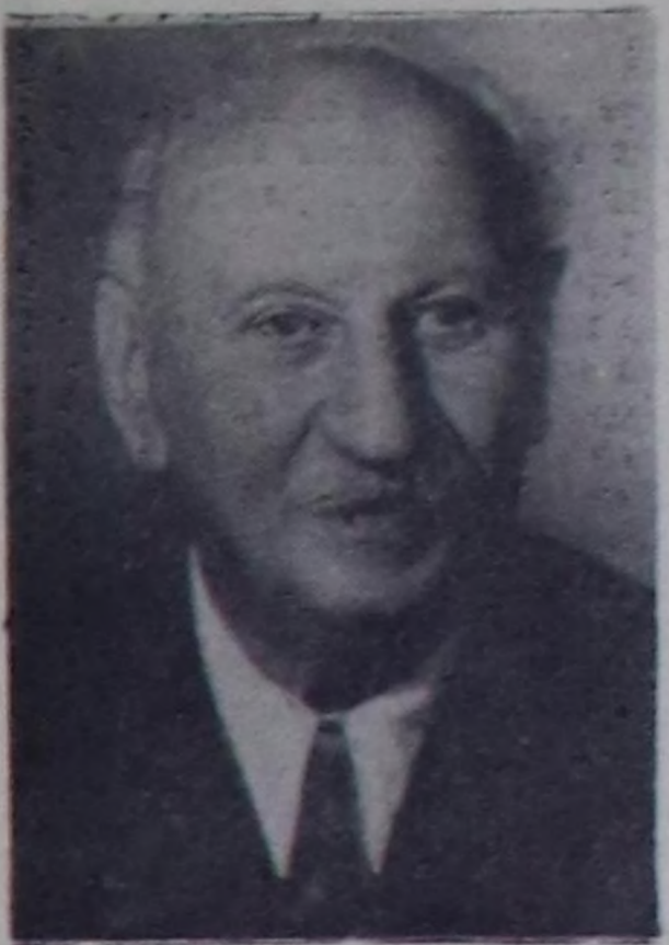
А. Ф. Иоффе.