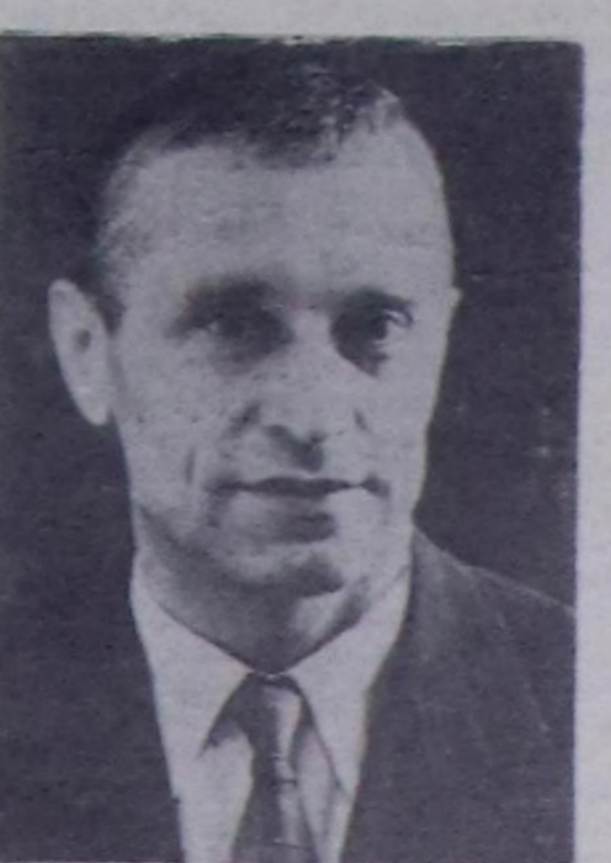
Н. М. Амосов.