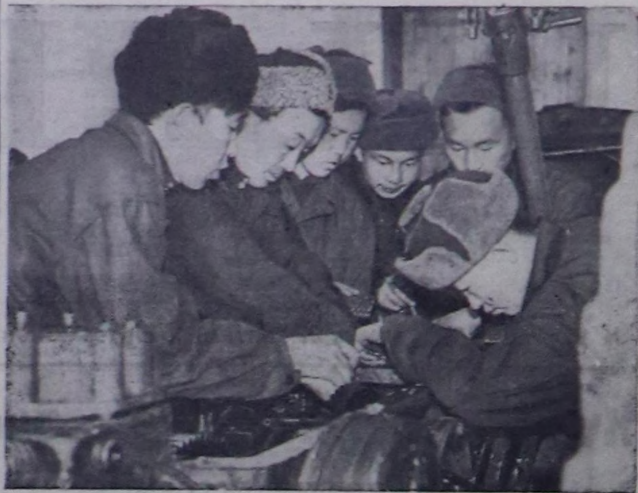
Тыванын механизаторларынын саны чыл тудум көвүдөтүр турар. Көдө ажал-агыл механизаторларынын Балгазында учула-шезин дески билилгит бугун от-рад машинистер-трактористер бо чылын дозуп үнер. Ол амык кижилер бедик дүктүтү алыр

дөш демисепишаан бистин об-ластың ховуларына удавас ажылдап эгелээрлер.