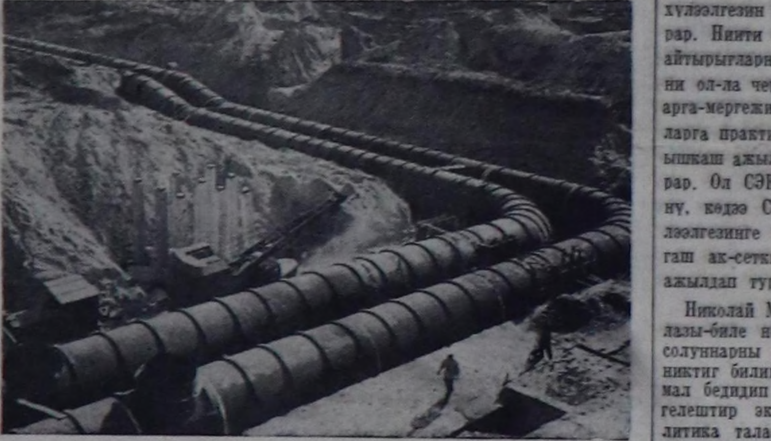
ЧУРУНТА: Змиевскинин суг күжү-биле ажылдар электри станциязынын тудуунда. Бо чу-рунту бугу-эвилелдин «Чеди чыл боттанышында» деп фото-чу-рун делгезден алган. СЭТА-нын фотохрониказы.

белен турганнар. Олар өңү-хөрө-гүннү колхоз-кооперативтиг хевир бодуну аргаларын ам-даа ыракта-ла төптөөн, ол хевирин ам-даа хөг-жүдөр херек дөзөрин барымдаала-байн турганнар. Оң өскө бир чижек. Боттук байдалар тургузууга берген муракчы колхозтарда болгаш сов-тарда колхозчулар болгаш совхоз-тарын ажылчылары боттарынын инектерин нитинин ажал-агынынга сактылашкан, а боттарынын өг-бүлө-деринге херек сүт продуктуларын нитинин ажал-агынынга садып ап турар апарган. Чамдык удурукчу-лар инектерин нитинин ажал-агы-нынга ажаарынын аргалары бол-гаш ажалчы чоннарын сүт продук-тулары-биле хандырынын байдалы белеткенин өөрүбүзе, бугу ине-терин массалык-биле садип алырын эгелеш, ол хемчегин хажытпааннар. А практика кырынга ажал-херекке ол хоралы болган.