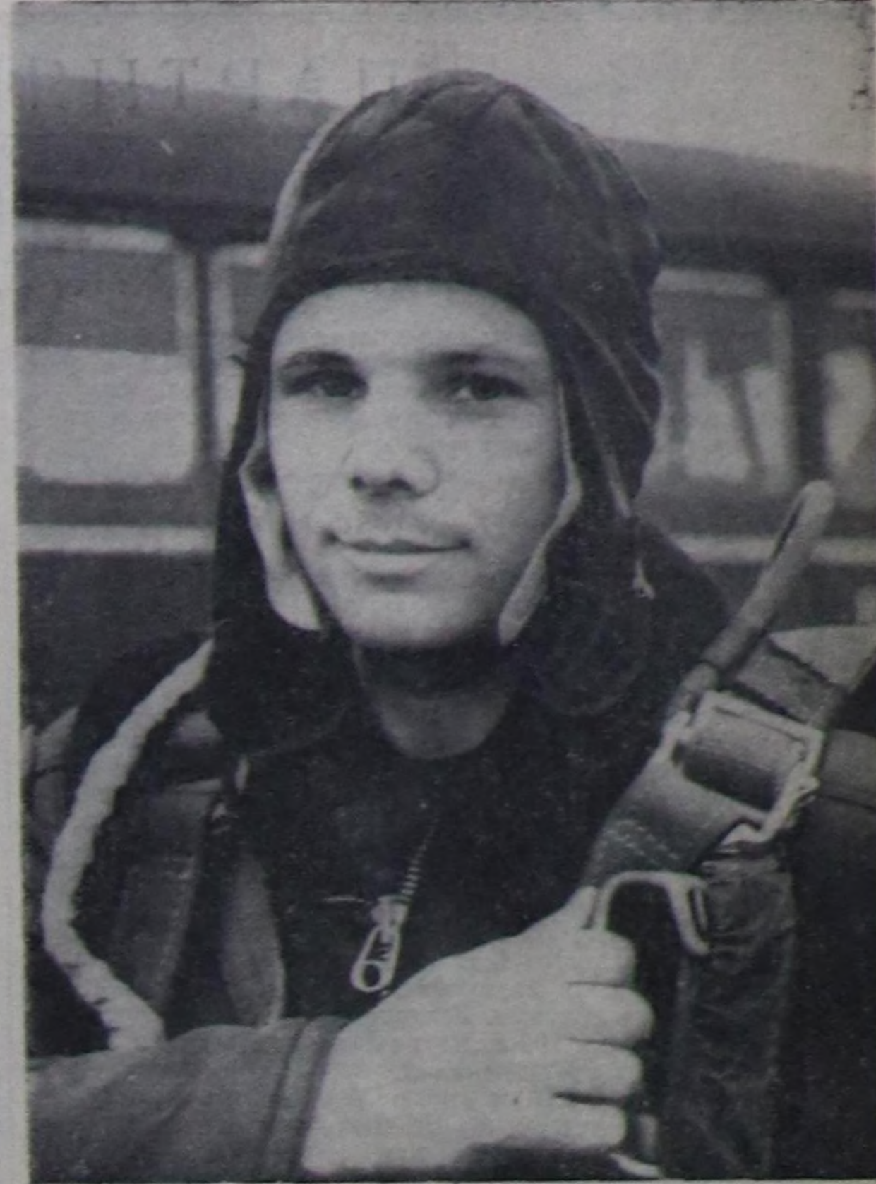
ЮРИЙ АЛЕКСЕЕВИЧ ГАГАРИН.