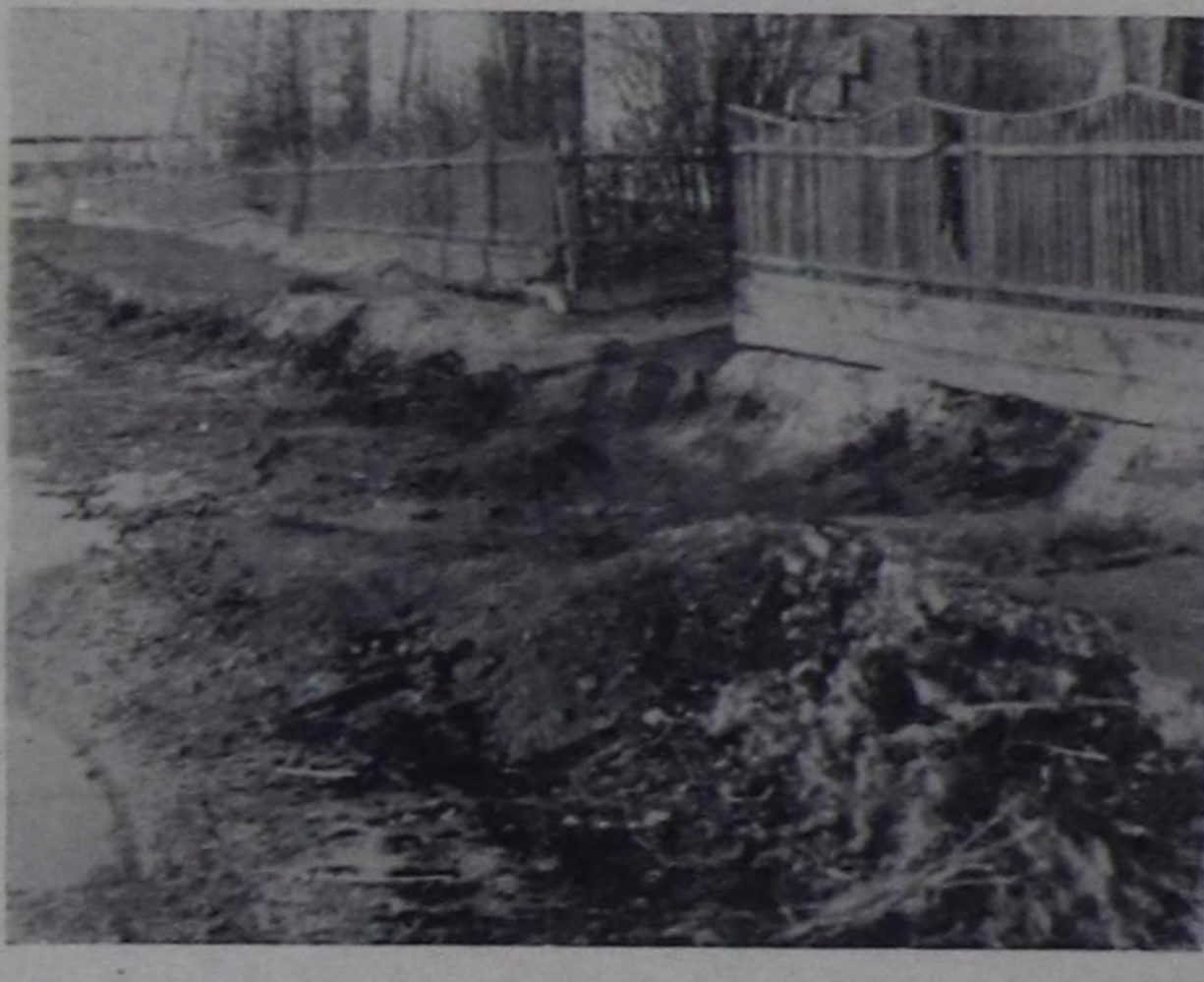
Уругларның өмнөлөзи Улуг-Хемниң кырында бе? Дайымай, топтап көргө: Далай ышкыш бөктүг суг-дур!