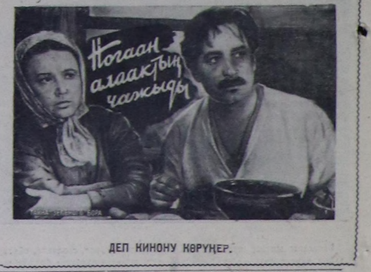
ДЕП НИНОНУ КӨРҮҢӨР. «Тогаан алаактын чакыры»