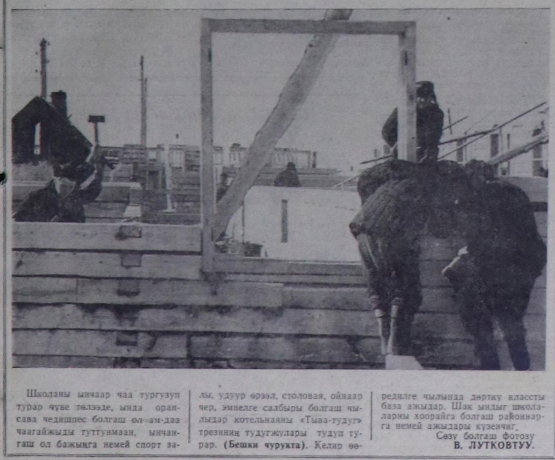
Школяны иначар чаа тургузуп турар чүве төлөөдө, мында орансава чедипес болгаш ол ам-даа чагайжыды туртувасыз, ыңчанган ол бажында немец спорт залы, удуур өрөөл, столовая, ойнаар чер, эмиңге салбыр болгаш чылдыр котельнякы «Тыва-туду» трезиниң тудукчулары тудуп турар. (Бешки чурукта). Келир өөреникче чылында дөрткү классты база амылдар. Шак ындыг школялары хоорайга болгаш районнарга немей амылдары күөсөт. Сөзү болгаш фотоуу В. ЛУТКОВУУ.