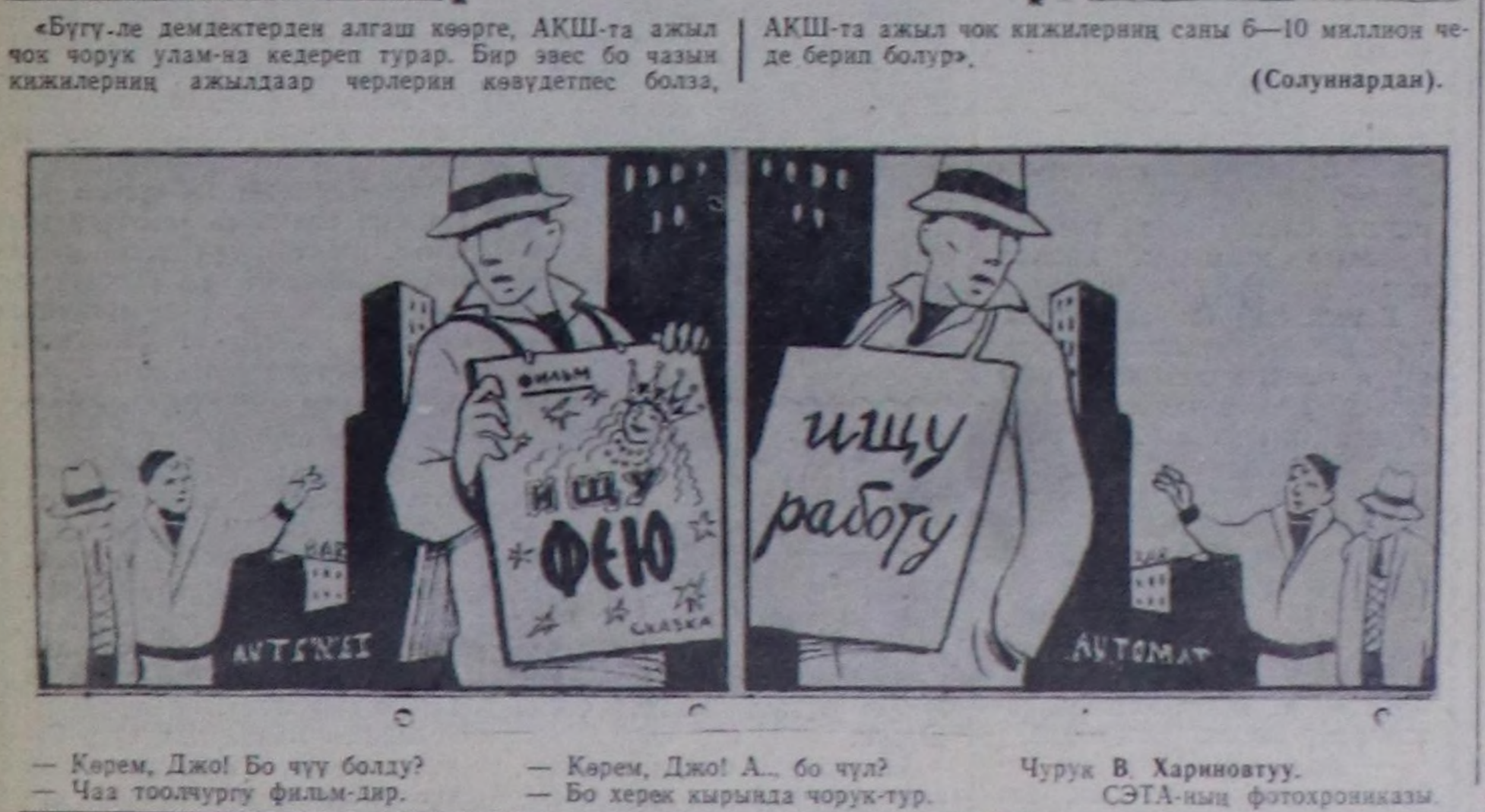
«Бүгү-ле демдектерден алгаш көргө, АКШ-та ажыл чок чорук улам-на кедереп турар. Бир эвес бо чангыс кижилерин ажалдар черлерин көвүдөп болза, АКШ-та ажыл чок кижилерини саны 6—10 миллион чедер берил болур, (Солуннардан).

БЕЛГРАД. (СЭТА). Конгода султандар чуртту сандарларынын улам ханымылар дээш бар шала-биле оралдажып турар. Оон «юридиктиг суррун» Таанаривке болган чөвүлө хуралга салган. Таанаривини конституцияга улук «шинтирели» болза каныг-даа үнесин чок дээрин дүрүм өзүгүз апаанын меделелдеринге чангыс эвес улаа демделеттигини турганы билдинтар. Мычылда-лаа өскөргө илеткеттер Касавубу, Чөмбө болгаш Калонжи оларын Малагаш Республиканын найсыдалыгы буттарынын ач салган апа сазымчыгажы болза Конгода байдалды күнелдире-биле өскөргө» деп көрү шийчилг болуп турар. Мычынга апаа «үндөлзөөш» белгы шериг болгаш чартык шериг кижилери Конгодан үндүренин