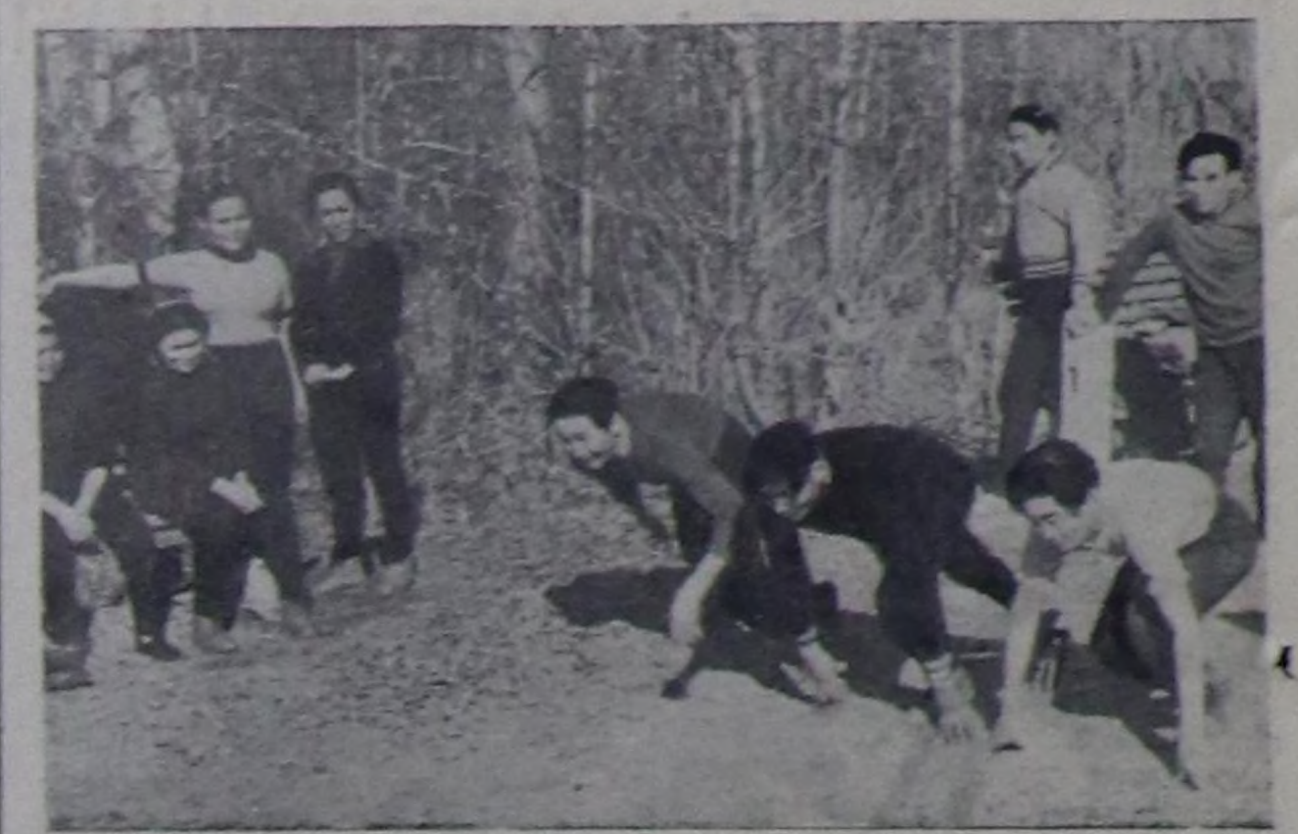
Спортчулар старта.

чуулар, а ол шакта 10-дан 50 рубль чедир акша ойнаашкынары база бар. Төлөгө чоруктан 4 хүнүн дургузулда Кызылдың ажаалап кассаларында 3600 ажык рубль түңгө ойнаашкына таварышкан 1600 лотерея билеттери келген. Ойнап үргүчүлөп турар. Акша-бараан лотереязын индиги үндүрүлгөтүн таралылазы Кызыл хаорайын, областың де-вискээринде бо чымдык март 20-ден эгелеш. Бо үндүрүлгөн ойнаашкыны 1961 чымдын июнь 22-де Новосибирск хоорайга болур. Индиги үндүрүшкүнүн билеттери-биле «Улук» деп 45 автомашиналар, «ИЖ-56» деп 195 мотоциклери, моторлуг 240 чак-тал-тергелери, «Саратов-2» деп 1800 соодукулары, 2565 хол шактарын, 4165 фотоаппараттары, «Ижы-даа 84 рубль өртөктү» — 1800, а 127 рубль 50 көпеек өртөктү 405 хевистерин болган эске-даа өртөктү чүгүдери ойнап ап болур. С. ОСИПОВ, Кызыл хоорайың Төл ажаалап кассанын инспектору.