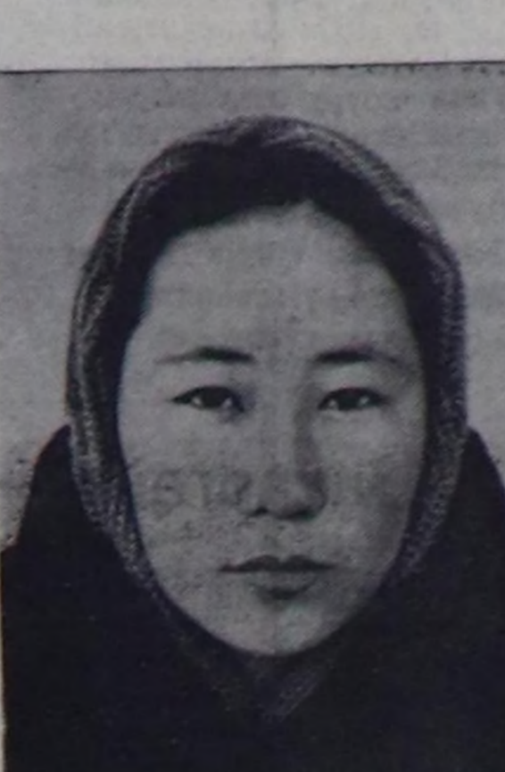
С. Чочаймаа школага өрөйрүп турган үезинде бедик фермада саанчылап турар азыгына үрөйрүчү дугулашкан, инек сазгып, инектерин, биззаларын ажалып келген. Үш чыл бурунгаар ол чедир чыл школанын өрөйрүчү дугулашкан. Оон соонда комсомолу кыс саанчыга ажалдап эгелзэн, мурнакчы саанчыларын дуржуулаган өрөйрүп, ажаллап турар апарган. Эрткен чыл ол 10 инектерин бирзезинденне 1336 кг сүтү сазган, бо чылдын бир инектенне 1350 кг-нын саарын хулазган. Бо анык саанчы Өвүр районун «Торгалы» колхозунун дээр саанчыларынын бирзези.