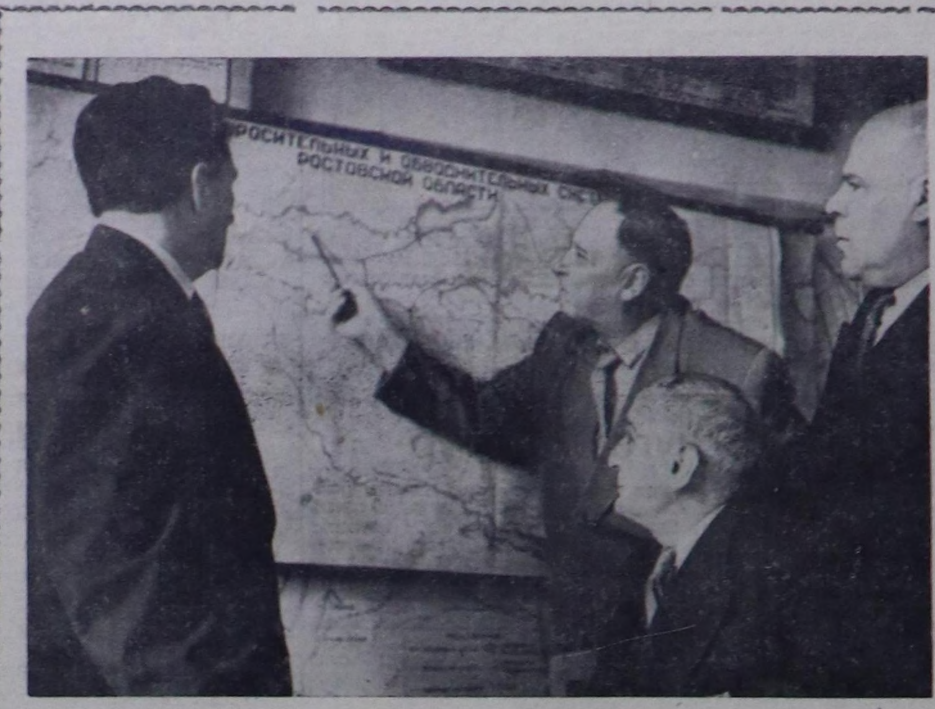
ИЙИ РАЙОННАРДА ЧАСКЫ ХОВУ АЖЫЛДАРЫ

Кыйгырыгы Тыва автономнуг областың үлетпүр бүдүрүлгелеринин, транспорт болгаш тудуг организацияларынын ажылдакчыларынын, партия болгаш ажыл-агый активинин чөвүлел хуралына чангыс үн-биле хүлөө алыр.