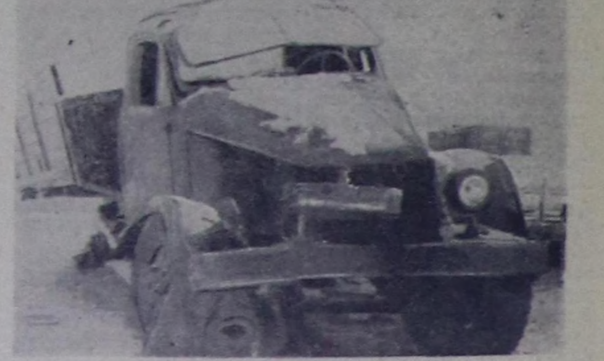
Өвүр районунун «Торгалыг» колхозунда 18 автомашиналарын чам чүтлө сезиң дүңгү чоруп турар. Колхоз баштаар черининг техникаже ичээлгени салбай, хайгааралды кошкеткенинден өрткөндөрү шүтү үрелге, ажылдалган үнгөн. Чаа машиназы 3 чыл чедир эдилелгени үрел алган болуру бо колхозтун чолочыларында шүтү чөмчө алган.

Машина каа-ла үрелген болду ол-ла черинге туруп калырында оон бар кезектери тоймагалаттына берген болур. Мааза чаңгыс кижик: өрткөн чылым октябрда чолочы С. Дүңгүн шериг келдиришкенин чоруду бетинде машиназын хүлээди бер дөш колхоз баштаар черинге бөзгө, ожаарбанындан ол үнелет эвез черге тура сандан үнгөн.