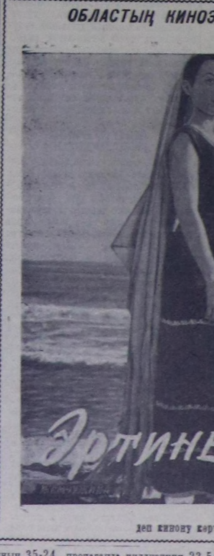
деп кинону көрүңөр.