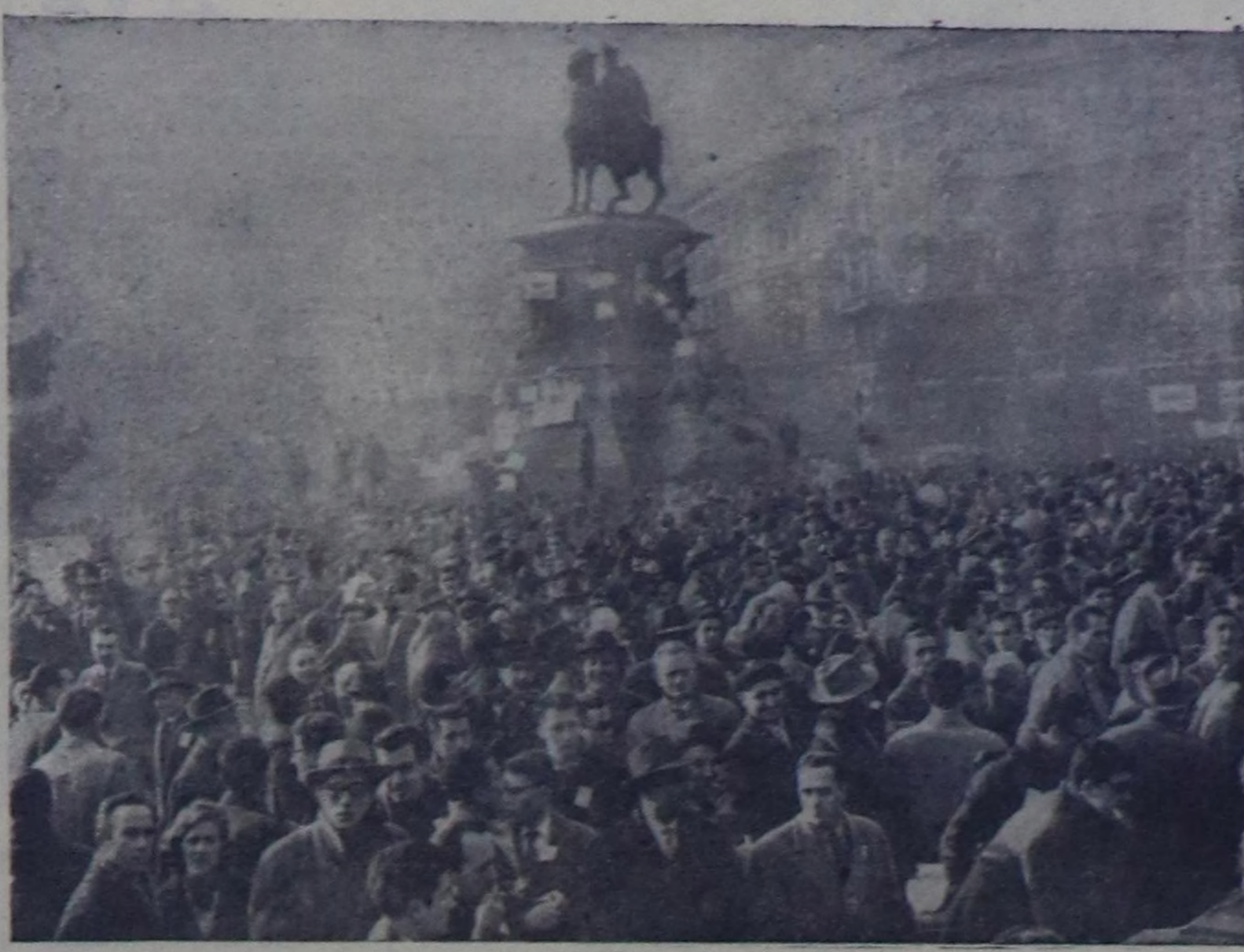
Италия. Милан хоорайныч ажил сокамдык чурат элээн каш муң электромеханиктери чоокта чаа боттарынын өг-бүдөлөрүн-биле кады хоорайнын бир шөлүгө чыгууларын. Олар үлөтүр ээлеринин илдип үндүргөн ажил телесиврин кызырар, дээр шиптиринге удурланышыкынын кылганнар.

жикчилерин тулуу жоругдан. Эргечегиргалар бир өвөс доп-доруан ажылаунас болунарча ажылдан үдүрер бис дээрин бүүдүрүлгө өөрөдигезинин школарарынын ажил сокамшыкыныга кырыш турар ажылактарына баш улуу сагындрыгыны кылган.