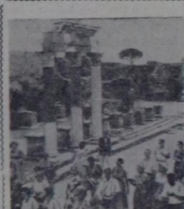
Эрткен чылды октябрьдын орта үзүндө болук совет туристер Италияга чораванар болгаш эрте бургу Помпей коорайны артышкынын көргөнер. Чурукта: совет туристерин Помпейнин артышкынын көрүп турары.

ТОКИО. (СЭТА). Япониянын Социалист партиянын Топ Комитетинин пленуму бодунун ажилын