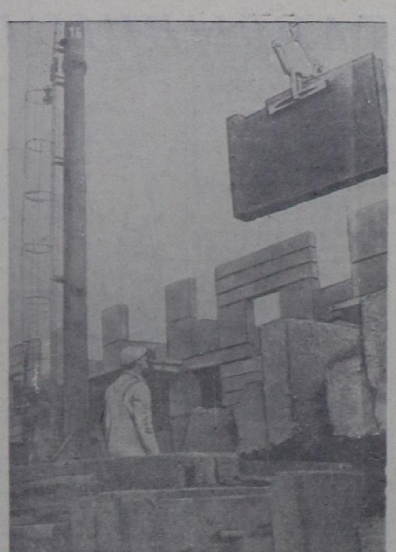
Герман Демократтык Республикада социалист чарыш улам-на калбарып турар. Берлинде 2 дугар шугудуга шугумену (Трифтевтин тудугу) ажилдары, мастерлер болгаш инженерлер болза Магдебуртта хемчээл херекселдерин заводунун ажилы чоннарнын кыйгырыш эдерин, 1960 чылда социалист чарышты калбартып чорударычы республиканын бугу-де тудугуларын кыйгырган. Чурукта: Берлинде Трифтевтин тудугу участогунда.

АКШ-тын даштык политиказынга доктааш, президент эрги политикаын үргүлдөөнине кыйгырган. «Он чылдарын дүргүндө Американын эскерлеме чок сорулга болза күш дөжөрүн тургудун чугаалажышкынын аргазы-биле тайбын чүткү болган» деп ол меделгөн.