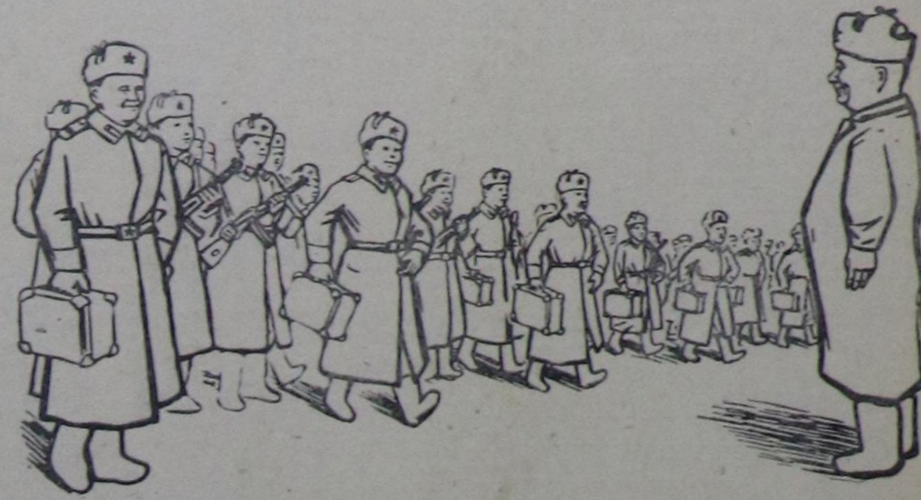
— Уштүң бирөөн-ле чыскаалдан үнүр!

даа курунелер кирген турзун дээш совет кижилер бүгү- ле чүвени кылдыр. Коммунисттик ништалды тургузарының оруу-биле хажык чок чорбушаан, Совет Эвилели улустар аразында тайбыңның улуг херээн моон ыңай чайгылыш чок камгалаар.