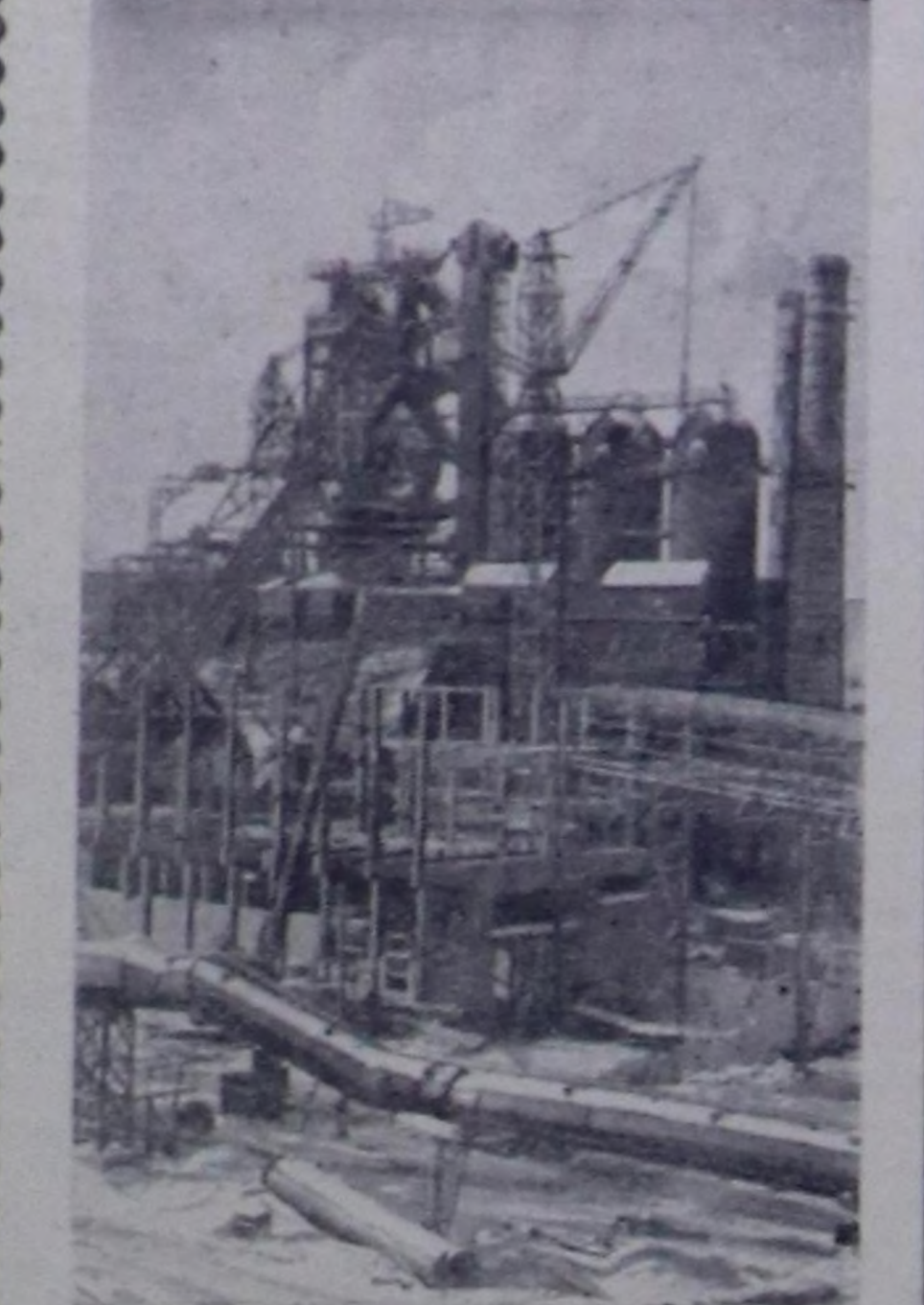
Казах ССР. Темир-Тауда карагандын ме-таллургия заводунуң тузунда хайымышкынныг хунаер эртин турар. Мында комсомолдуң 40 чөл өттүг Казахстаннын баштайгы домназын ажылаалга киирерине белеткен турар. Эпекчилер дыка улуг ажылды кылганнар. Олар бир хонукта-ла 800 кубометр бетону са-лып, он-он тонна демир конструкцияларын, хей санын технологтуг дерилгелерин чымык апташ. Казахстаннын домназын тузушкуну-биле чергелештир Кузнецкийн, Челябинскийн болгаш Магнитогорскийн металлургия бодуруга-леринге машинист, метатрижи кадрларын белеткен. Чурукта: Казахстан домназын ишти хевирин.

Винница область. Стрижавскийн септелге-техника станциязын коллективинде бодуруга планын хуусаа бетинде күөсөдүшөр дөш социали-стик чарыш калбарган. Механизаторлар эртен чылдың декабрь планын өзүгээр 40 тракторлар-ны септээр тургаш, колхозтарын 76 тракторлар-ны септээр. Станциянын ажылычылары ол күш-ажылчы чедикшиктерин СЭКП Төп Коми-тетиниң декабрь Планумунга аадар бодурганнар.