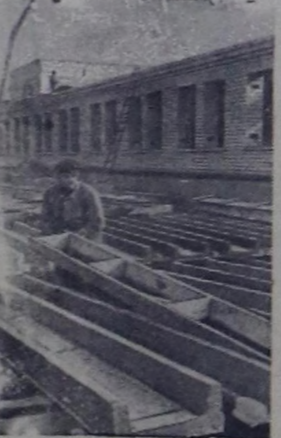
Латвия ССР. Республиканың 40 районунда колхозтар аразынын тулут организациязынын тургускан болгаш олар бо чылын барык 80 миллион рубльдин ажылдарын кылар. Тулут черлеринин күчүзү улам улгалып турар. Чижээ, туйбу заводтарына чылда бүдүрүчүлүү 8 миллион туубука, а чыдай заводтарына—3.000 тоннага улгалган.

Лиепайск, Эргльск, Вентспилсск, Добельск болгаш өске-даа районнара колхозтарын кеттишкан күштери-биле дыка хой чаш тулут чоруп турар.