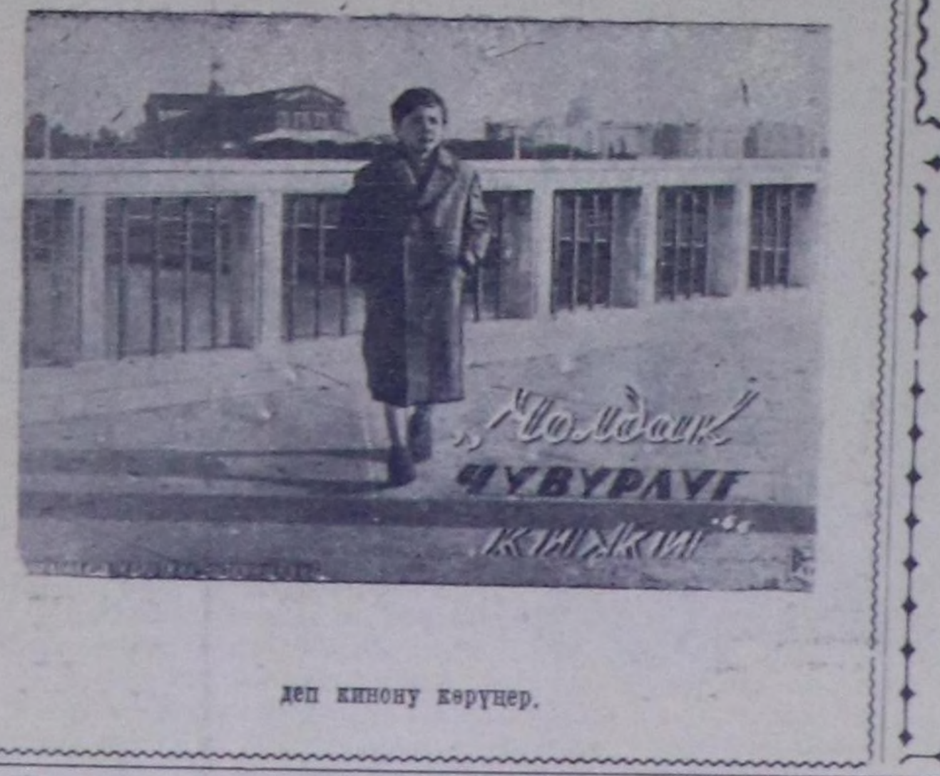
деп кинону көрүнер.

РЕДАКЦИЈАНЫҢ АДРЕЗИ: Кызыл, Шетинкинн кудумчузу, бажын № 3. ТЕЛЕФОННАРЫ: редакторун 24-63, редакторунн орадакчызынын 35—24, партижн амдырал кидизинин 23-54, хамысалгалык редакциянын 37-13, кезе ажил-алгый кидизинин 22-64, иштик информация кидизинин 21-47, пропаганда, улугтур болгаш транспорт кидизтеринин 23-35, чагаа, култура болгаш амдырал кидизтеринин 21-27, бухгалтериянын 25-38, корректорларынн 20-60.