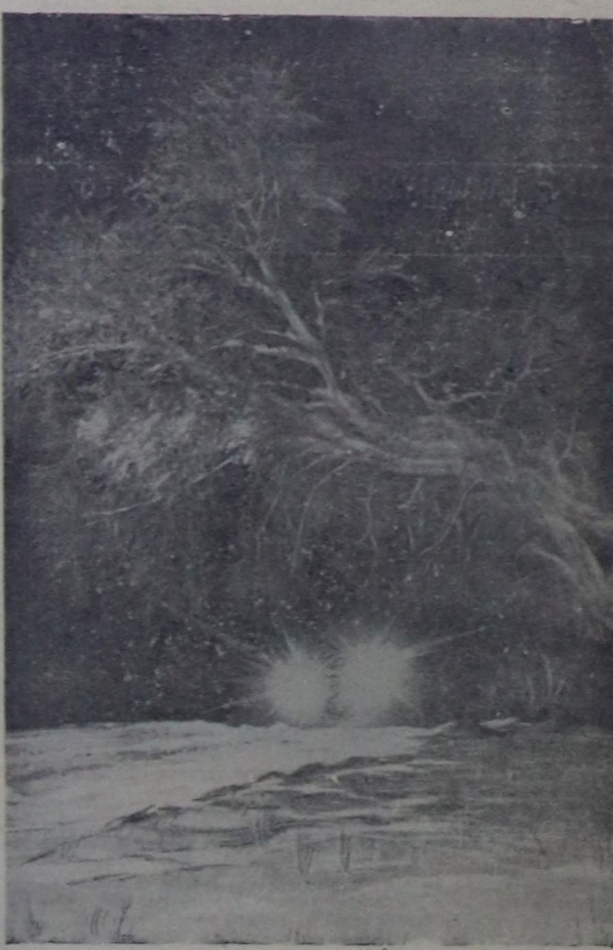
Кышкы дүвөкчү орукта. Фотогуд К. Сиротинни.

Аденуэрниң медегели берлин айтирымы шиттирлээриң бурунгаар шитчөтөйин турар деп «Дейли телеграф» солунуң хайгааракчысы бижээн. ЛОНДОН. (СЭТА). Англияны даштыкы херектер министрствозунуң январь 12-де болган парлагга конференцияныга Барыын Берлинге Аденуэрниң кылган медегелиниң дугайында дымка хөй айтирыглар дугайың даштыкы херектер министрствозунуң төлөөлечилеринден айтирган. Анаа бо айтирыг талазы-биле Барыын Германияны канцлериңизниң туржу англи чакаткыч туржунга чөрүлдөшөк болуп турар деп дээриниң дугайың оон колду айтирып турган. «Даштыкы курунелерниң министрлериңиз медегелерин даштыкы херектер министрствозу тайылбырлаваас укжурлук чүвө» деп чыдадаанаш, Аденуэрниң чугаалаан тайылбырларында министрствозунуң төлөөлечилерин онсаалп.