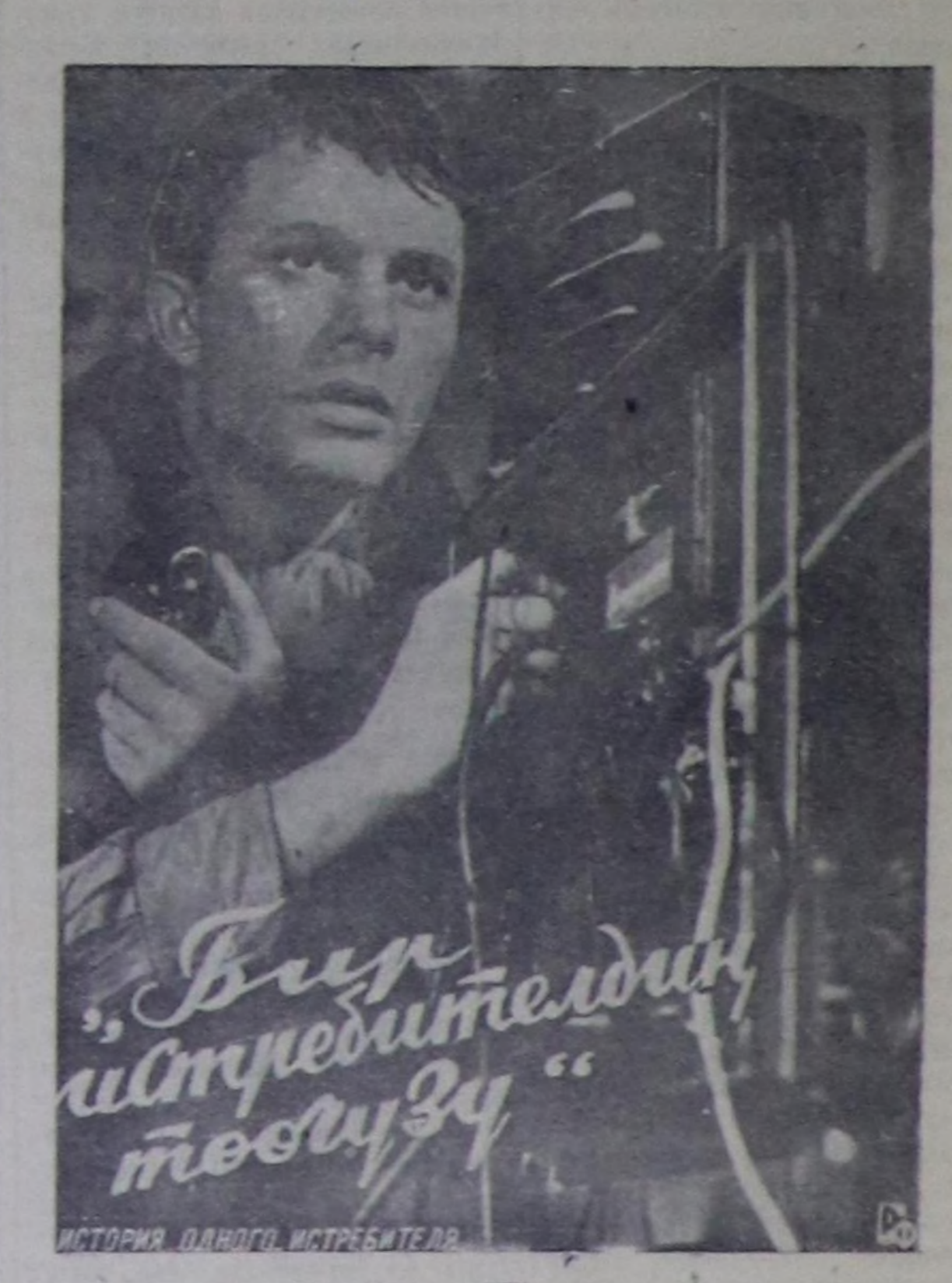
ИСТОРИЯ ОДНОГО ИСТРЕБИТЕЛЯ деп кинону көрүңер.