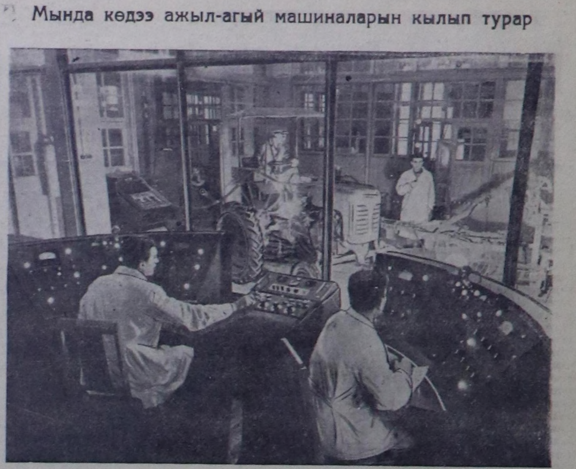
Көдөө ажал-агый машиналарынын тудуушкунууну бүтүзүлгө эртем-шиячилел институтунун Топ тээзометриктик станциясында көдөө ажал-агый бүдүрүлгезинин хей күш үнөр чорудулгаларын механизастарына чаа машиналарын хей санниг конструкцияларын чо чылны шенеп көргөн. Оларны ол институт көдөө ажал-агый машиналарын тударынын бүдүрүлгелеринин конструктор бюралары-биле кады кылгалын болгаш массалык-биле бүдүрүп үндүрүнгө база дуржулга кылар кылдыр бүдүрүп үндүрүнгө шагда-ла сүмөлзөн. Амгы үеде институтта чаа 79 машиналарны чогаалдыр болгаш экижерлер талзы-биле ажал чоруп турар.

Сүт-Хөл районунун хереглежилеринин коллективинин бүтү ажалын, албан-хаакчылары СЭКП ТК-ның декабрь Пленумунун доктаалы-биле бүрүн танымал эртеркен. Көдөө ажал-агыйны улам ырай көжүдериин айтырыгы райпо коллективинге база-ла бүрүн хамаарыр.