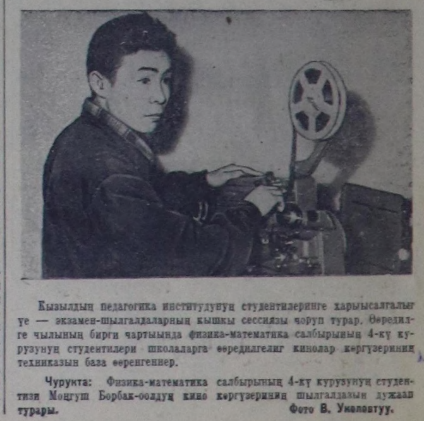
Бызылдың педагогика институтунуң студенттеринге харысалгалыг үе — экемен-шыгаладарың кышы сессиязы чоруп турар. Өөредилге чылыңды бириг чартымында физика-математика салбырыңда 4-кү курсузун студентилери школарга өөредилгелг кинолар көргүзөрүнн техниканың базэ өөренингер.

Ийги улудуна бөлүмнүнүн ажылың түнелсин үндүрүп, оларын удуртуку башкыларыны эки амыкчаанын демдегелээ. Чижээ, ыр-шын бөлүмнүнүн талантыг школячылар илереп турар. Ол бөлүмнүнүн кижикчилери колхозчуларга ийи улаа содун концерттерин көргүскен.