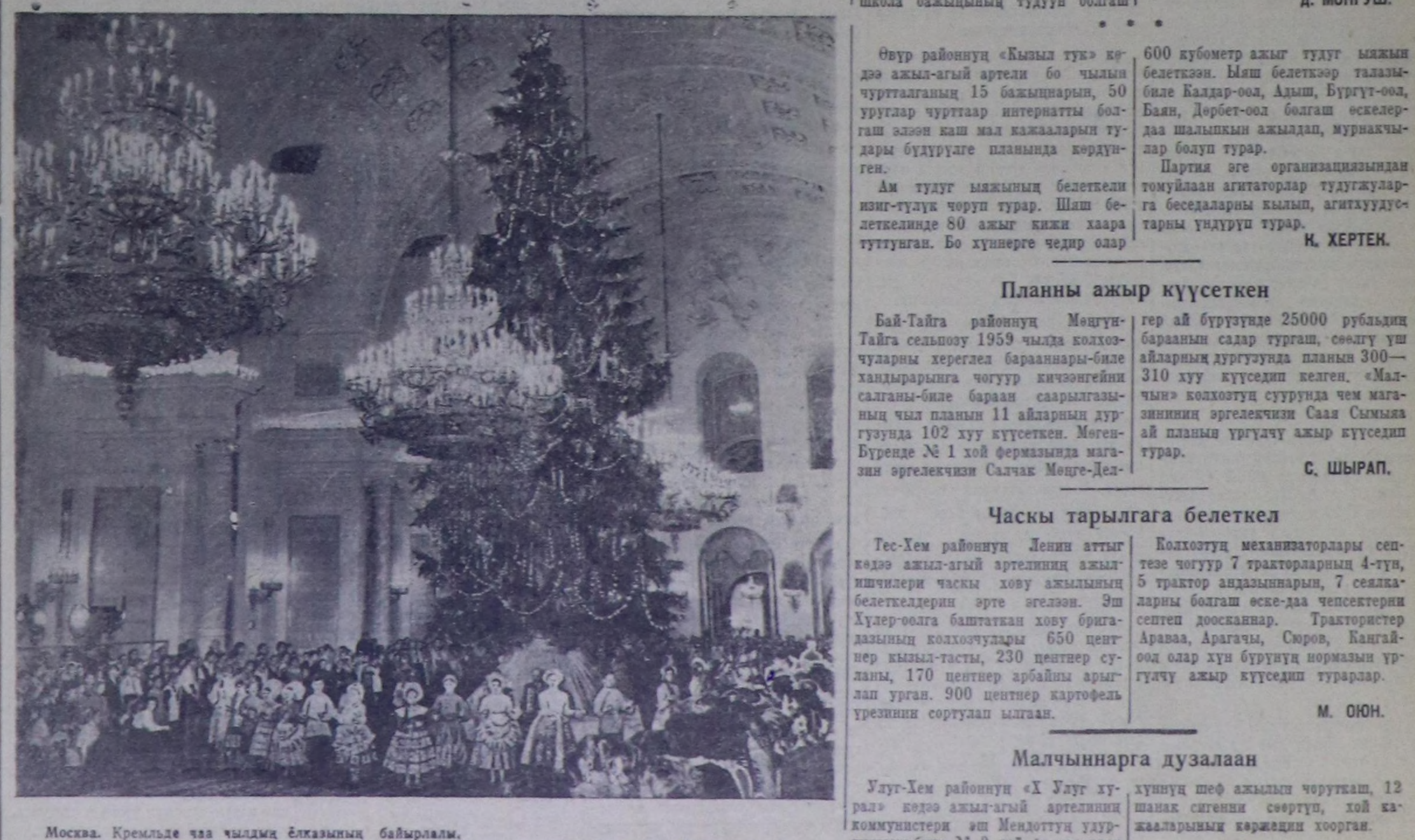
Москва. Кремльде чаа чылдың йказының байырылы. Чуртук: Кремльдин Улуг өрдүкүң Георгийск залында чаа чылдың йказының байырылы.