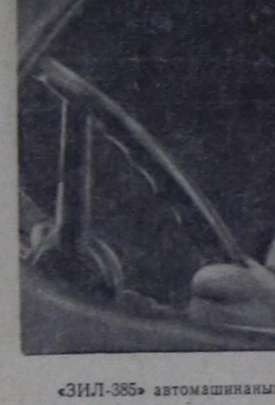
Экскаваторлар, автомашиналар болгаш өске-даа механизмер шу-туп урелишкени чөк ажалдап тур-га, а оларны баштарыңчылары — аскаваторщиктер, чолаачылар эң кызымаккай ажылдамышкан.

Бо хайнымыкының ажылдар чөрүп турар чер часкаар кижин кырыңче ис баспаң а хар-бале