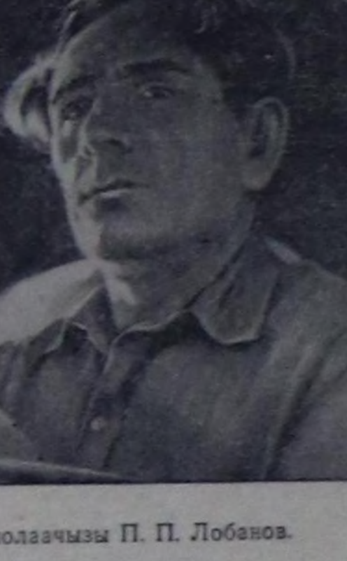
Экскаваторлар, автомашиналар болгаш өске-даа механизмер шу-туп урелишкени чөк ажалдап тур-га, а оларны баштарыңчылары — аскаваторщиктер, чолаачылар эң кызымаккай ажылдамышкан.

Бо чымын мында кылдыңган бугу ажылдарың өргижирөөн, то-жудаңгай аргадар-биле күөсеткен болза элээн каш чылдар өрттөр болгаш чүс-чүс кижялерниң күжү негетинер турган. Амгы үедө мында чүгө 3 экскаваторлар бол-ган 17 самосвал автомашиналар ажалдап турар. Олар чуугаа чай дургузунда боон 70 муң ажыг кубометр довракты калкыш, ыра-дыр сөөртүп машаннар.