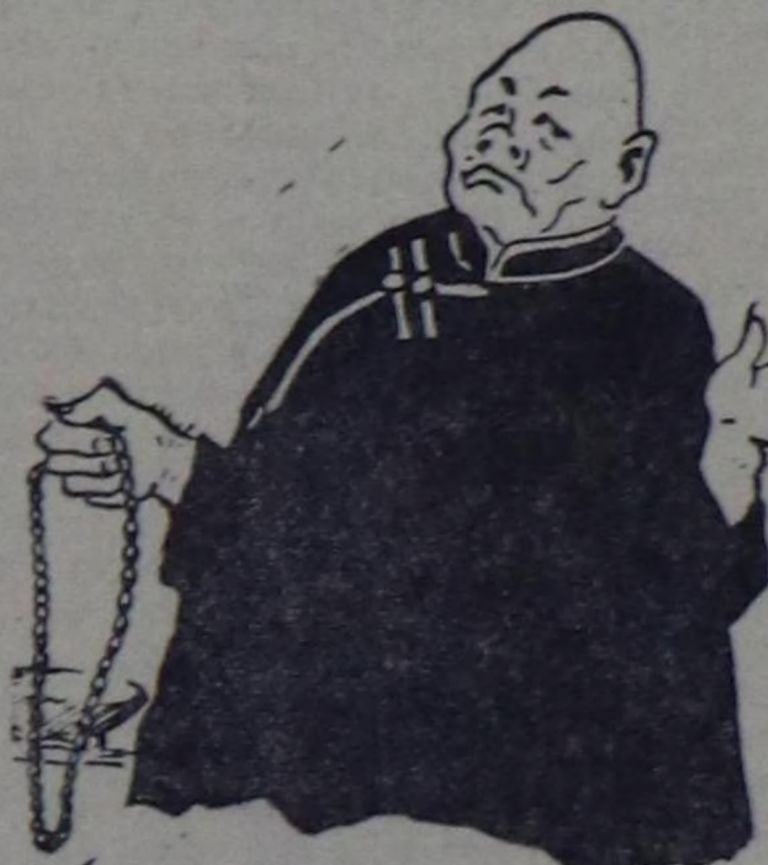
Өг кырында деспиле заржы кургадып каан тур. Ооң өөнгө кире бөзгө, шаанда хуу амдырал үезинде чурттал чораян кулакшургуу кижилерин өө сагышка кирер. Орун үзүүнде шаанда бола 5—6 паш дигир улуг-ла хүре доккаарда хойт-пак. Эжик кастымында таарда икиг божаны сарыктар азып каан тур. Шой паһтарда долу хаймылданган сүтүү өрөмөлөп каан... Удараанда илектер сүргөн кара атытгы кижиге

Т. КЫЗЫЛ-ОЛ. «Шыптыг тускай корреспонденти». РЕДАКЦИЯДАН: «Ажыл кылбас кижиге—чөм чивес»—бо дээрге, социализмиң хоойдуу болгай. Ыныг турбуке бистин чуртувуска коммунизмиң долу тилелгези дээш, чырыктыг келир үе дээш демисежип турар совет кижилерин ак-сеткилдиг, тайбын куш-ажылы-биле тургустул байлаан халас шилдириниң кезээр, ажык ийн-чангыс кижилерин бистин аравыста барын үстүнле фактыг чугаалап турар. Нитилеге ажыктыг ажыл кылбас, амдыралдыг төлөк чок оруунда мангыстап, тояан-чылап, улус мөлчүп, арга-ларым чамдыг турар ыныг ийн-чангыс кижилериниң илалы-биле илеретип, ол дугайында боттарынын санал сумелериңиң солунга кирерин «Шыныг» номчуучуларыңга редакция сумелеп турар.