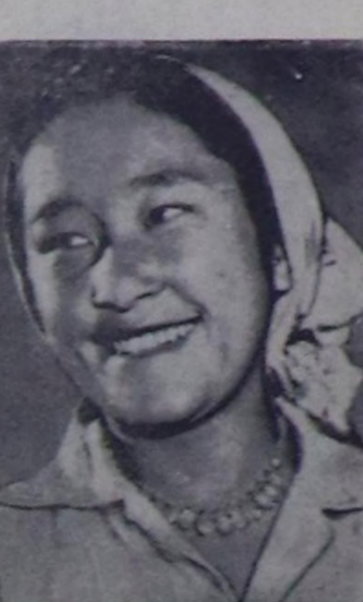
Бий-Хем районунч «Тилкеге» колхозу хойну тарым бөвөздөрүн чорудуп турар. Сесерлиг уласту-гунга сентябрь болган октябрь айларда 1700, а ноябрьда 1200 хойну тарым бөвөздөрүн планнаан. Мына хун бүрүде 70 — 80 хойну тарым турар.