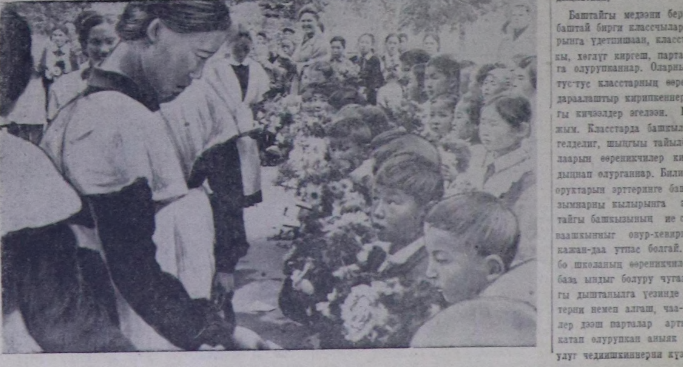
Баштайгы медэни берген. Эң-не баштай бири классчылар башкыла- рына үдетипкан, классчарга кат- кы, хөгүлү киргеш, парталар артын- га олурушканнар. Оларнын соонда тустус классчарын өөрөшкүчлери даралаштыр кирипкенер. Баштай- гы кичөөлдөр эгелөөн. Школа ыр- жым. Классчар башкыларын иле- гелдениң, шылты тайкылар чуула- лаары өөрөшкүчлөр кичөөлгейлиг дыңнап олурганнар. Билигин берге оруктары эрттеринге баштайгы ба- зымдары кылмында эң-не баш- тайгы башкыларын не сагыш чо- лашкынынын өвүр-көвөрип алжы качан-да ултас болгай. Ичанрга бо школанын өөрөшкүчлерин өөл база ыңдыг болуру чуулаажок. Чай- гы дыштанылгасы үзүндө чаа күш- терин немен алгаш, чаа-чаа билгил- лер дөш парталар артында база катап олурупкан анык өвүктөргө улу чедмишкенин хүзөөлдөр!

Чурунта: № 2 школанын онгу классчыларын бири классчыла- рынга белектер берип турары.