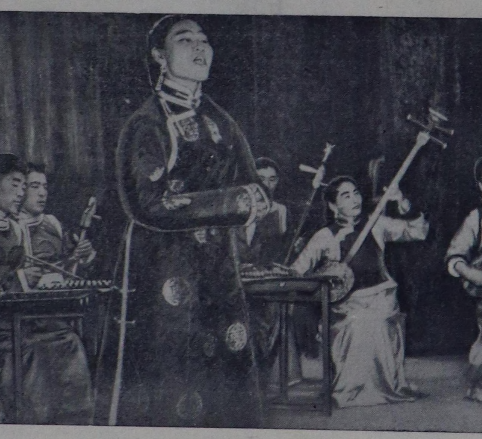
Чурукта: национал хөгжүмүнүң үөлөгүн-биле аныктарың болгаш студенттерниң VI бүүгү-делегей фестивалының лауреады Сосорнуң

Моол улустун төлөөлекчилери Шагаан-Арыгның ортумак школа-зынга, чамдык магазинерге болгаш өске-даа черлерге чорланнар. Кезээкиниң 8 шак. Районунуң культура бажымының залын көрүкчүлөр долур олурупкан. Моол артистериниң концерти совет бол-гаш моол улустарын найыралына-га турсааган ийнигини ир-биле ажалтыган. Национал торту тоонарык, хөгүмүл моол артистер-ниң көргүскөн номер бүүрүнү көрүкчүлөр димиттиг адыш жаскашкыны-биле үткүп турган. Танды бөлүк моол танцыны бедик мергежил-биле, илангыла ийниги кириши турар школалар Эрденебелер, Лажустер оларны авангард танцылаанын, бөлүк жөгүмчүлөрдүн «Мунгараныч үш тей» деп сургагыт моол операдан үзүндү күүсеткени, ол ышкаш Тываның «Дей-өө», орус улустун «Алдарды далай, ийниги Байкал» деп ырызы күүс-көткөн көрүкчүлөр катап-катап дилеп турган. Концерт сойда көрүкчүлөр моол артистерге чекет туускан болгаш киди чурукта тырттырганнар. Август 30-де моол артистер Сүт-Хад районче чорупканнар. Н. ЧИЧИНИН.