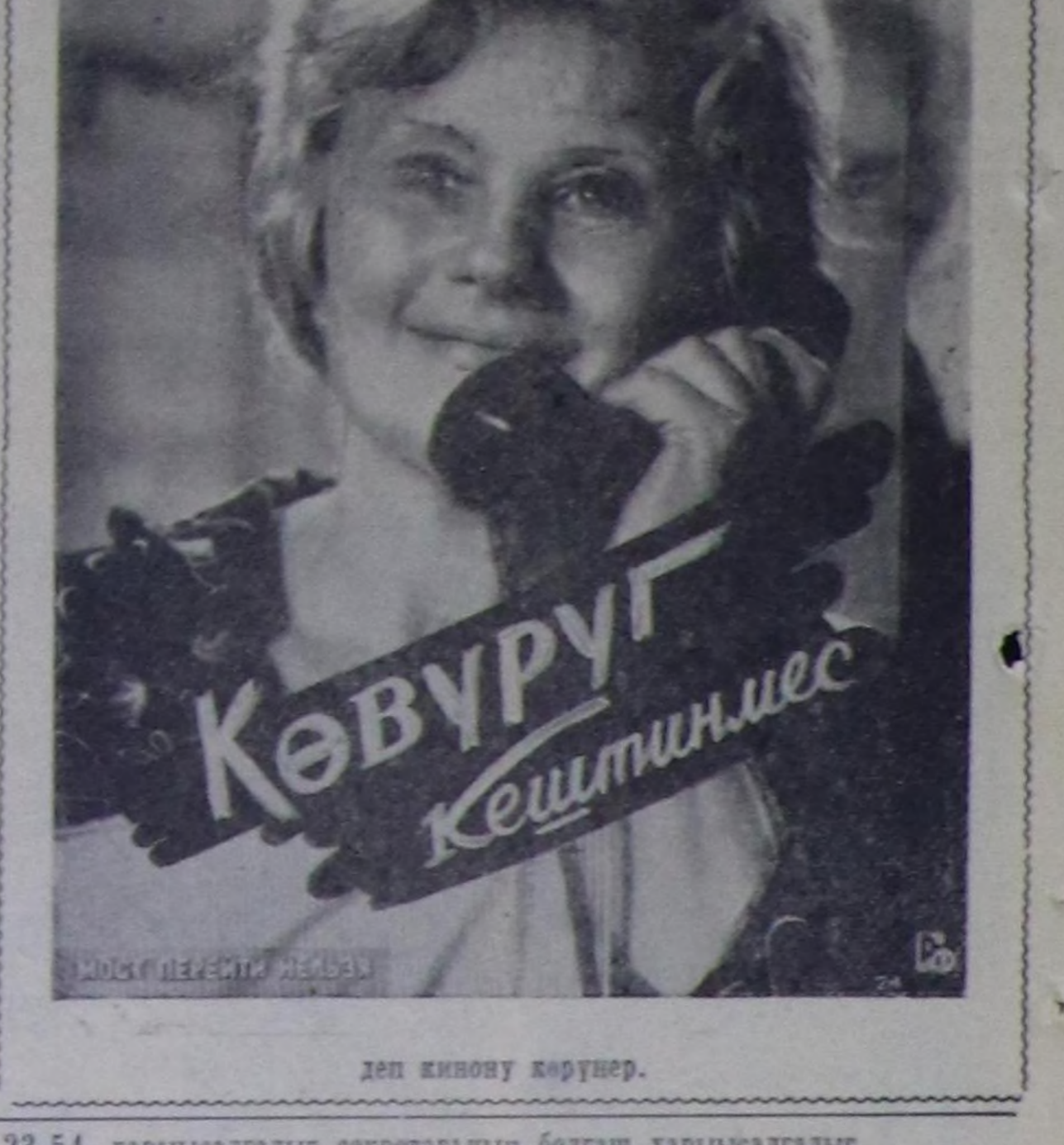
Көвүрүг Кештиниев деп кинону көрүөр.