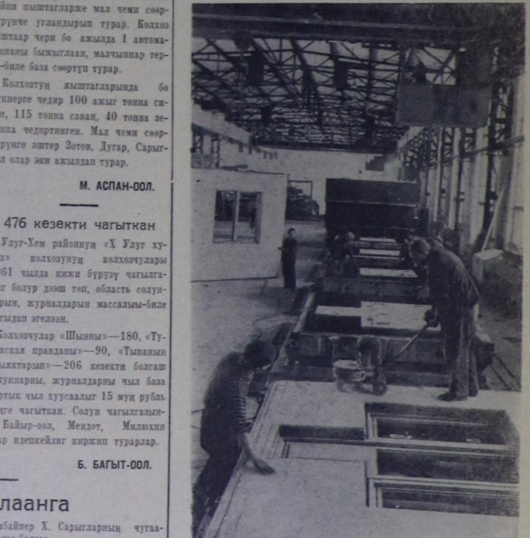
Владивосток. «Главвазостоктудунуң» бажынарның улуг-улу кезектерин кылыр өң баштайгы завод мында хуусаалыңдан өрте дужааттыган. Ук заводту долуу-биле механизастаан болгаш ам чылдың-ла 30 муң дөрбөчтин метр чуртталга шөлүн хандылар. Ол дөдөгө барык-ла 80-80 кварталыг; 14 бажынар-дыр. Анаа бажының бүтү-ле кезектерин—ханаларын, дөвирлерин дээш өске-дөө чүдүлгелерин кылып турар. Бажынарның дагыгы ханаларын керематтиг бетондан кудуп тургашкылар. Ол чаа материалдык шынары дыкы эки.

Хакасияның «Москва» союзунуң малчынары боттарының байырлаалыга күш-ажылчы чедишкениңериг ужуражып турарлар. Союзтоң хойжылары дук кыргычдызын чыл келген тудуу-ла көвүдизип турар. Олар бо чылдың дук кыргычдызынын талазы-биле обласка эң дөдө сөөргүзүңгү чедип ап, чүдгө дук кыргычдызында 5 млн. 300 муң рубльдин оруктамы алганнар. Союзтоң бүтү хойжыларын кол бүрүзүңгү-не ортума-биле 6 кг дук кыргыч алдынган. Кадарын Михаил Матвеевич Баркалов бодунун каларып турары